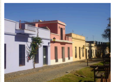
Lucia Iglesias / http://whc.unesco.org/en/list/747/gallery/