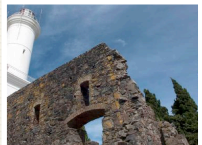
OUR PLACE The World Heritage Collection / http://whc.unesco.org/en/list/747/gallery/