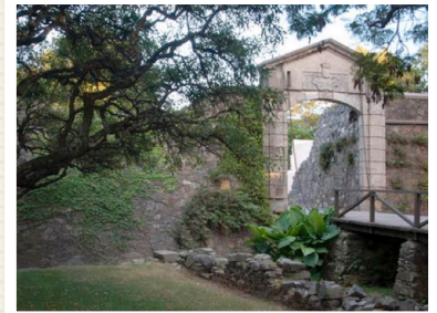
OUR PLACE The World Heritage Collection / http://whc.unesco.org/en/list/747/gallery/