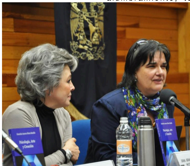
Presentación del libro: Psicología, Arte y Creación