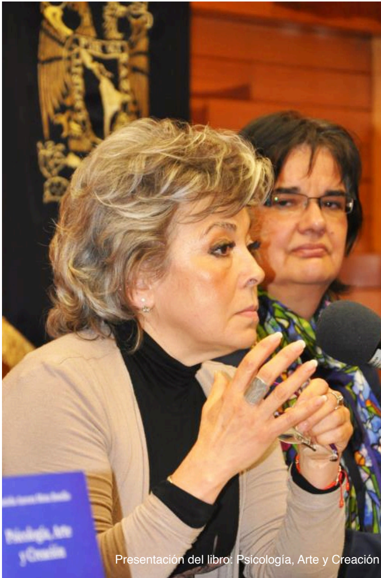
Presentación del libro: Psicología, Arte y Creación

“El libro responde a la obsesión de buscar la verdad. Primero llegue a la ciencia y al ver que es una verdad que a veces no es tan verdadera me fui a la filosofía. En la idea de hacer puentes entre varias disciplinas. Cuando me puse a estudiar a los filósofos serios y duros, que no hablan español, me fui a los más duros y por ello, empecé a caminar por la vía de una serie de preguntas, que no eran solamente las que ellos decían, las que para mí, había que abordar.” G.Mota