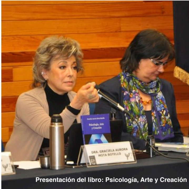
Presentación del libro: Psicología, Arte y Creación

“Algo que me enseñó el libro era a no tener duda de mis dudas. Y en consecuencia, había que caminar por la vía de mis preguntas. Y como la primera fue pensar si el tema del arte era o no verdadero”.