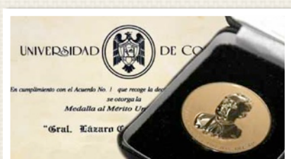
MEDALLA LÁZARO CÁRDENAS CONCEDIDA POR LA UNIVERSIDAD DE COLIMA