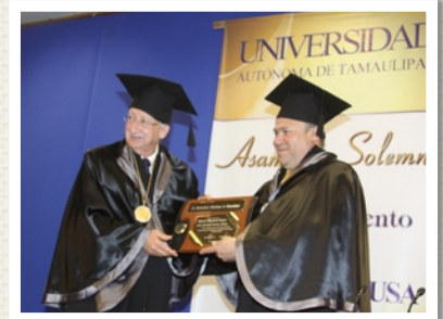
HONORIS CAUSA OTORGADO POR LA UNIVERSIDAD AUTÓNOMA DE TAMAULIPAS