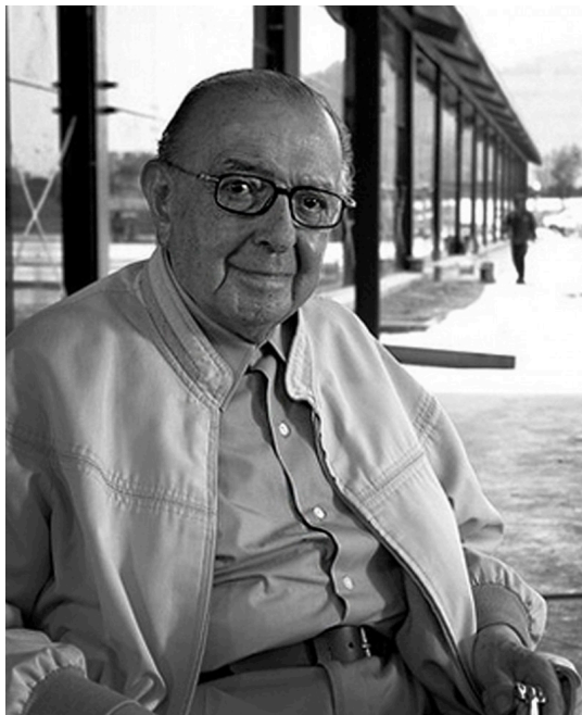
Arquitecto Pedro Ramírez Vázquez

Con su obra el arquitecto nos hace comprender la relevancia de la preservación de la cultura como base de la existencia del