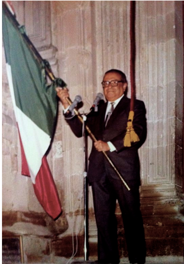
Pedro Ramírez Vázquez dando el Grto de independencia

El joven arquitecto y ejemplar egresado que poco a poco se desarrollaba profesionalmente pudo constatar que la arquitectura debía aplicarse para satisfacer las necesidades sociales, era imprescindible diseñar