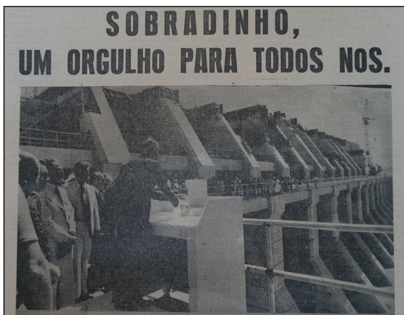
Figura 5: “Sobradinho, um orgulho para todos nós”. (RIVALE, 1976b. p. 1).

Mientras la composición de la foto valora y actualiza el mito moderno del concreto, en sus líneas que ocupan el espacio encuadrado más que los individuos, el texto del pie de foto ignora las otras personas, mostradas en tamaño reducido, para que el protagonismo sea atribuido a las autoridades, que así se insertaban en aquello que se comprendía como “historia”, que no