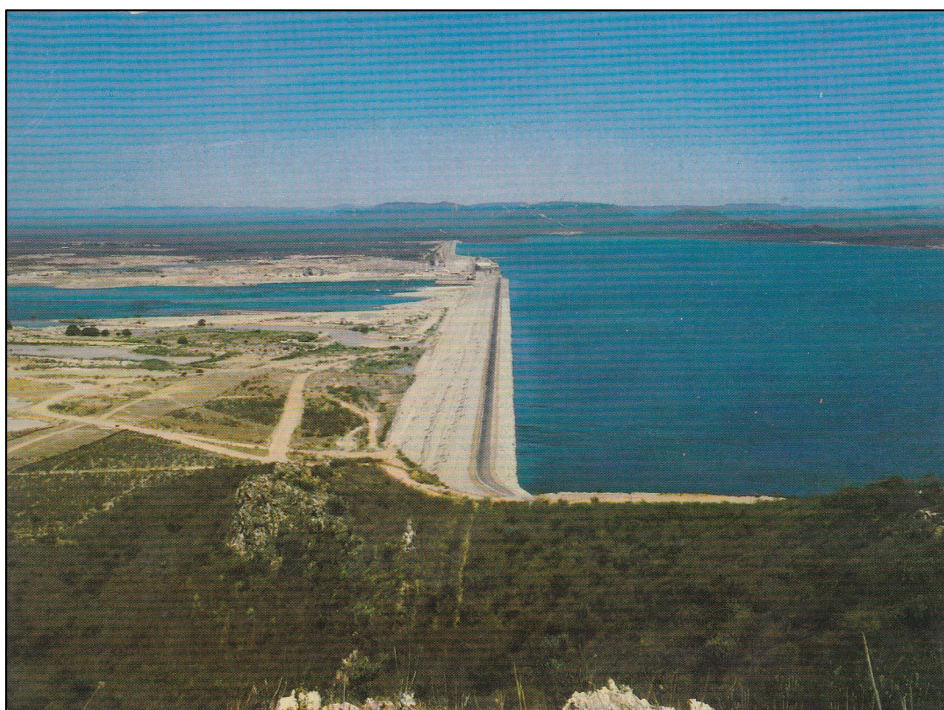
Figura 6: Presa de Sobradinho. Tarjeta Postal.