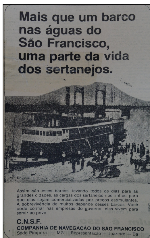
Figura 4: Publicidad de la “Companhia de Navegação do São Francisco” (CNSF).