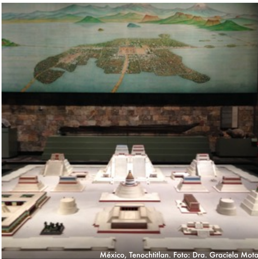
México, Tenochtitlan.

“...el potencial del patrimonio y herencia en general para contribuir al desarrollo sostenible solo se puede aprovechar mediante la integración de su conservación dentro de las políticas y procesos de la gobernanza local así como por el desarrollo de las capacidades relacionadas de todos los directamente involucrados...”