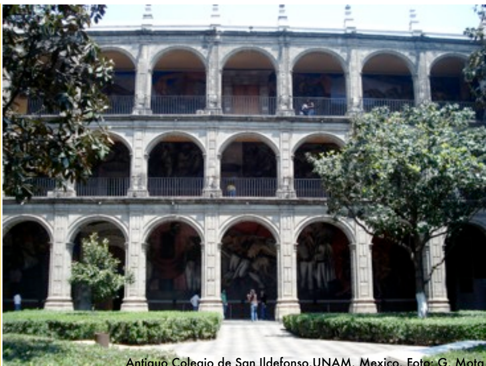
Antiguo Colegio de San Ildefonso.UNAM. Mexico.

“...implementar apropiadamente la multidisciplinaria y las capacidades multisectoriales que construyan herramientas y programas específicamente dirigidos a los actores locales del desarrollo...”