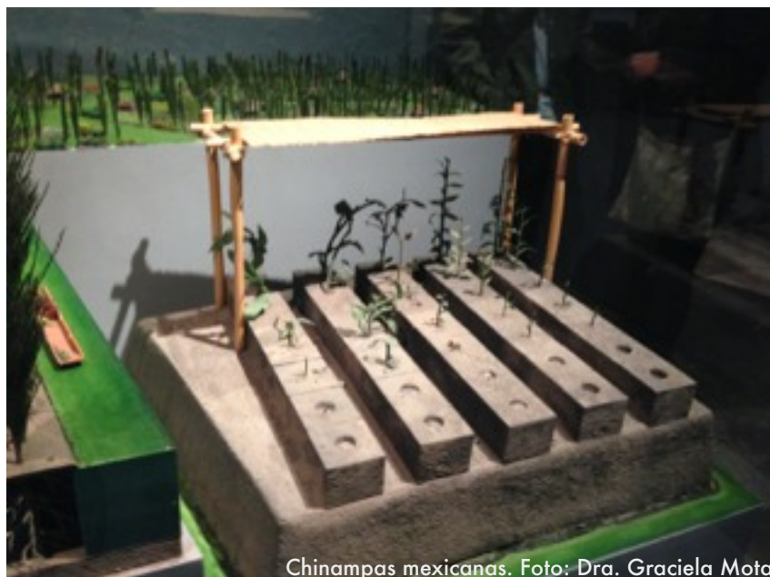
Chinampas mexicanas.

“establecimiento de la agenda post-2015” en desarrollo.