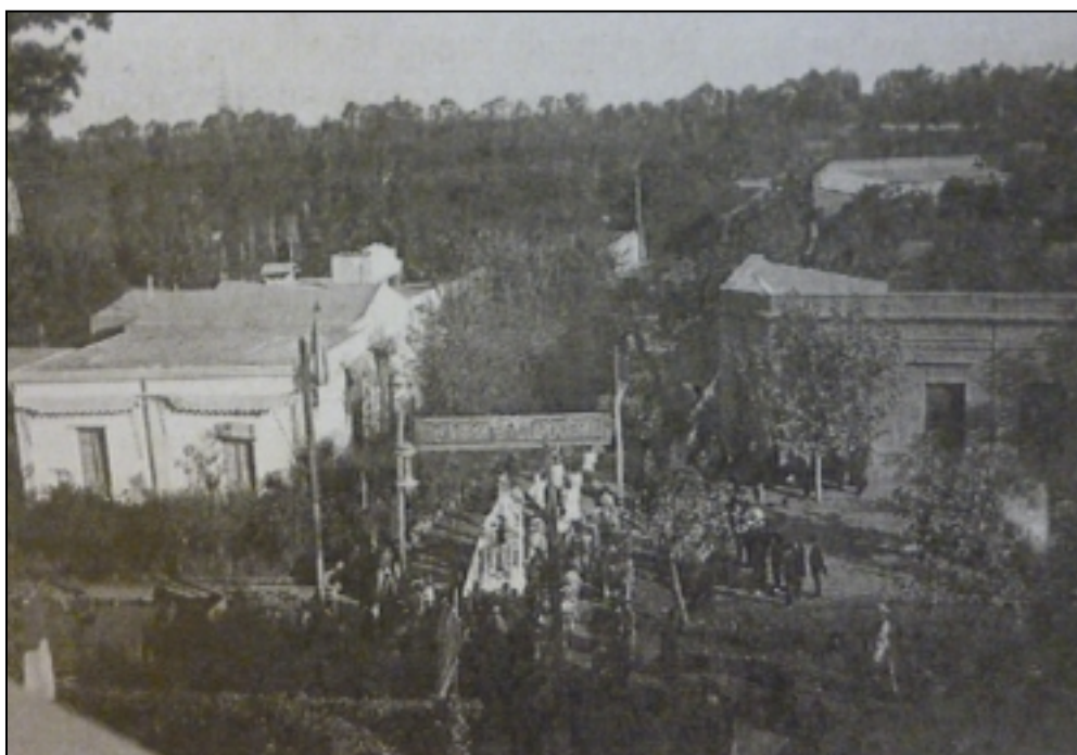
Imagen 6: Imagen tomada desde el Santuario María Auxiliadora durante una festividad religiosa. A la izquierda se observa la vivienda de la familia Ortega; hacia el fondo, el Parque Ortega

ciudades afectadas por el proceso de urbanización, para luego configurarse como escenario para el esparcimiento de las masas (Fresia, 2012: 88). El diseño de parques y jardines formó parte de las prácticas comunes de la aristocracia argentina y funcionó como ornato de su posición social, cultural y económica. Al mismo tiempo, encarnó la preocupación higiénica y los problemas de la salud pública y se configuró como un espacio de sociabilización y civilidad. El parque del General Rufino Ortega, en Rodeo del Medio, nació dentro de estas prácticas aristocráticas de las familias de la alta sociedad mendocina hacia fines del siglo XIX (Fresia, 2012: 88).