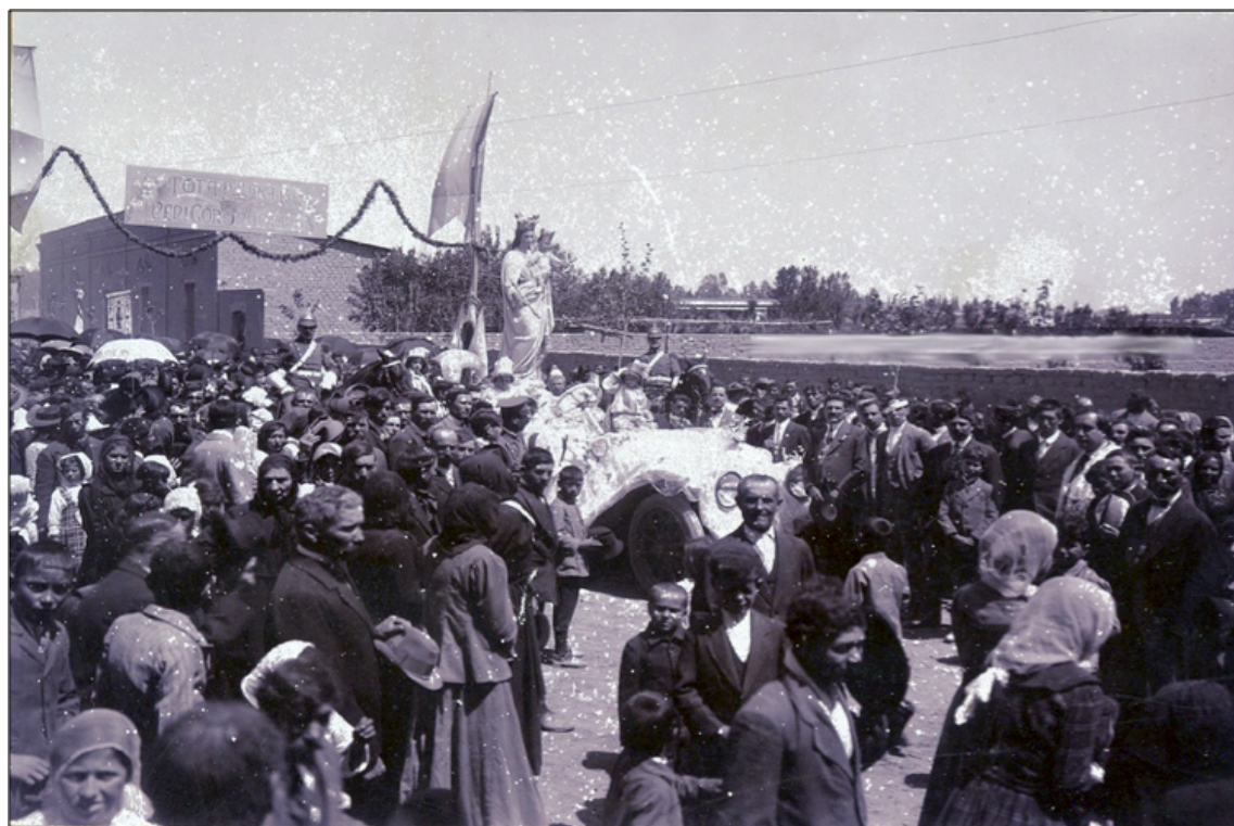
Imagen 13: Coronación de María Auxiliadora en Rodeo del Medio. 8 de octubre de 1916.

El parque del General Ortega se convirtió en un nuevo espacio de sociabilidad popular de la población rural, donde la dimensión religiosa ocupó un lugar primordial (Fresia: 2012, 92). El 8 de octubre de 1916 el Obispo de Cuyo Monseñor Orzali realizó la coronación de la imagen de María Auxiliadora en el Parque Ortega, a la cual asistieron aproximadamente 8.000 personas.