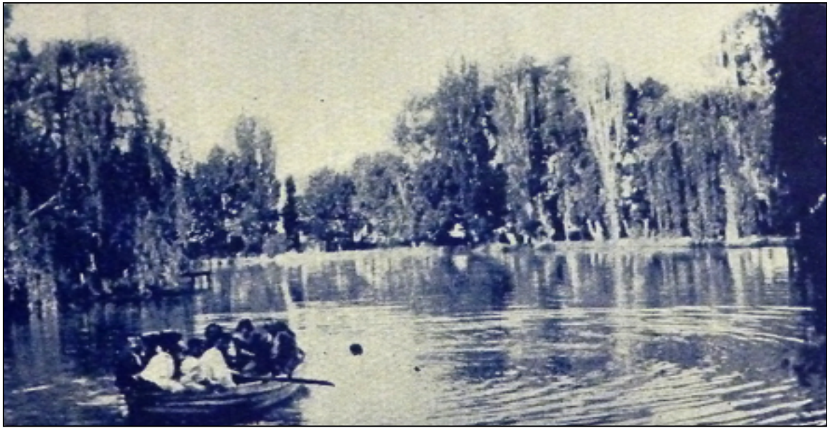
Imagen 9: Excursión por el lago en una lancha simpáticamente tripulada (Fuente: Quincena Social, 30 de octubre de 1928).