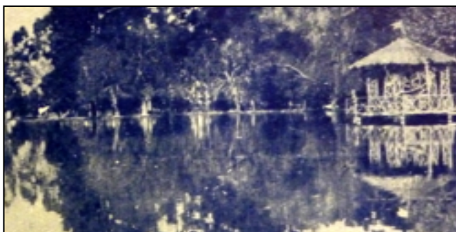
Imagen 8: Quiosco de la Isla Enchantée dentro del Parque Ortega.