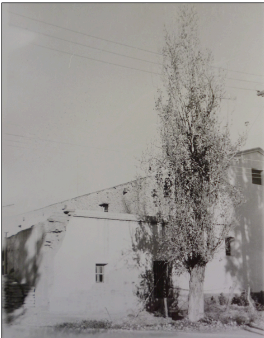
Imagen 4: Posta de Rodeo del Medio. Monumento Histórico Nacional (MHN).

El establecimiento de postas atrajo mayor cantidad de población y contribuyó a la posterior conformación del núcleo urbano de Rodeo del Medio (Fresia, 2012: 51-52).