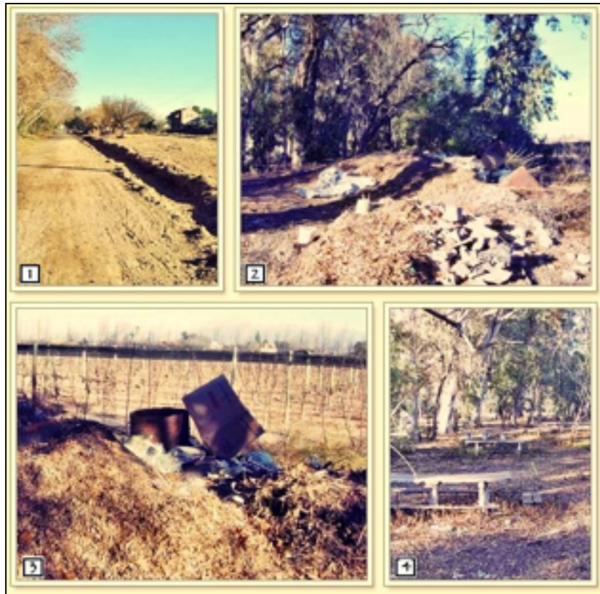
Imagen 15: Estado del Parque Ortega en el año 2011.