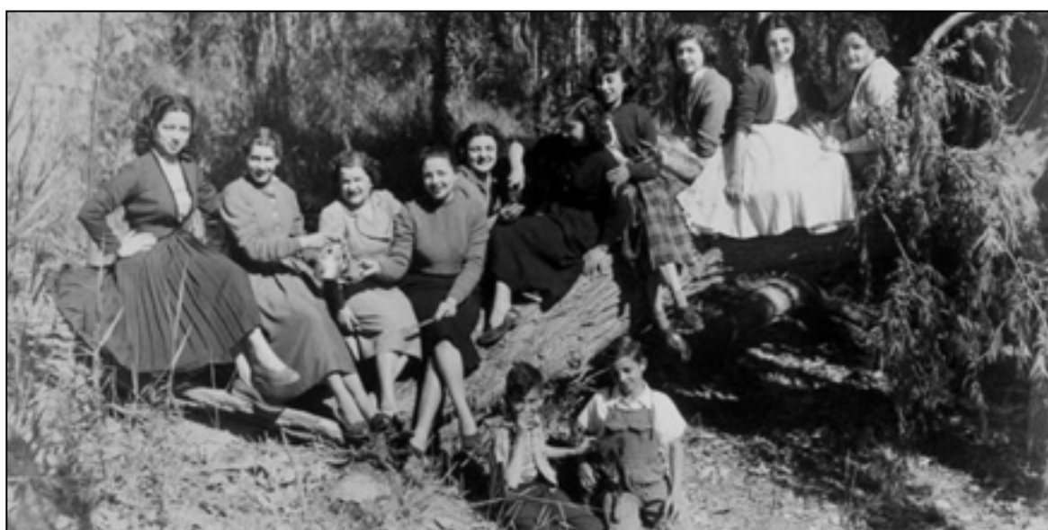
Imagen 19: Parque Ortega, Rodeo del Medio.

Se impone el desarrollo de otros aspectos sociales, de la convivencia, de la vida en relación para ser más exactos y esto se logra casi totalmente con instalaciones de este tipo.... No desconocemos la significación del deporte, pero tampoco de toda actividad que contribuya al acercamiento entre los hombres, de especial significación en estos momentos en que el desconcierto es el signo dominante en las relaciones humanas” (Diario Los Andes, 2 de enero de 1961: 1).