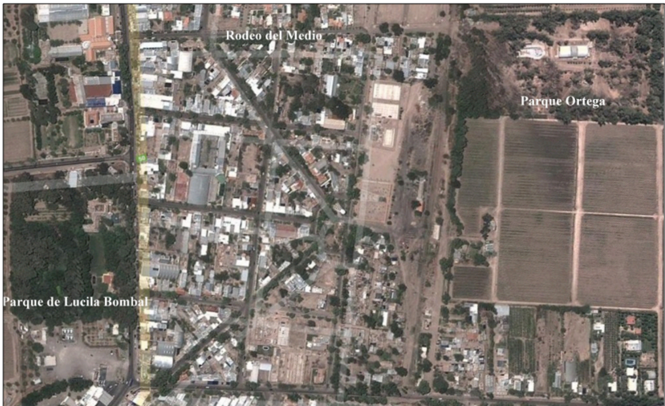
Imagen 2: Vista aérea de Rodeo del Medio 7.