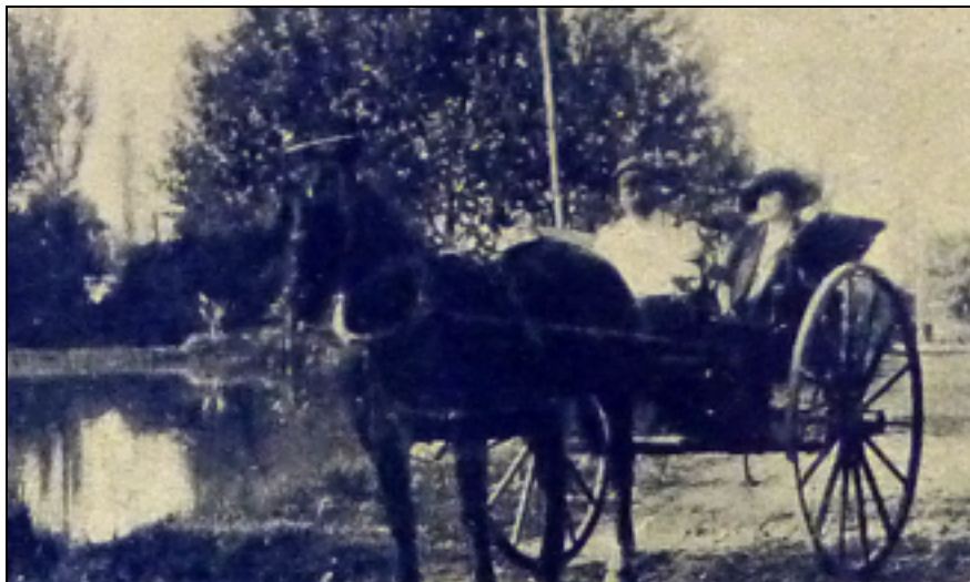
Imagen 11: El Teniente Gral. Ortega y su segunda esposa, Leonor Solanillas, en uno de sus recorridos diarios por el parque. Se observa a la izquierda el lago (Fuente: Quincena Social, 30 de enero de 1921).