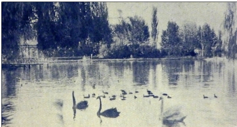
Imagen 10: Uno de los detalles más poéticos del parque (Quincena Social, 30 de octubre de 1928).