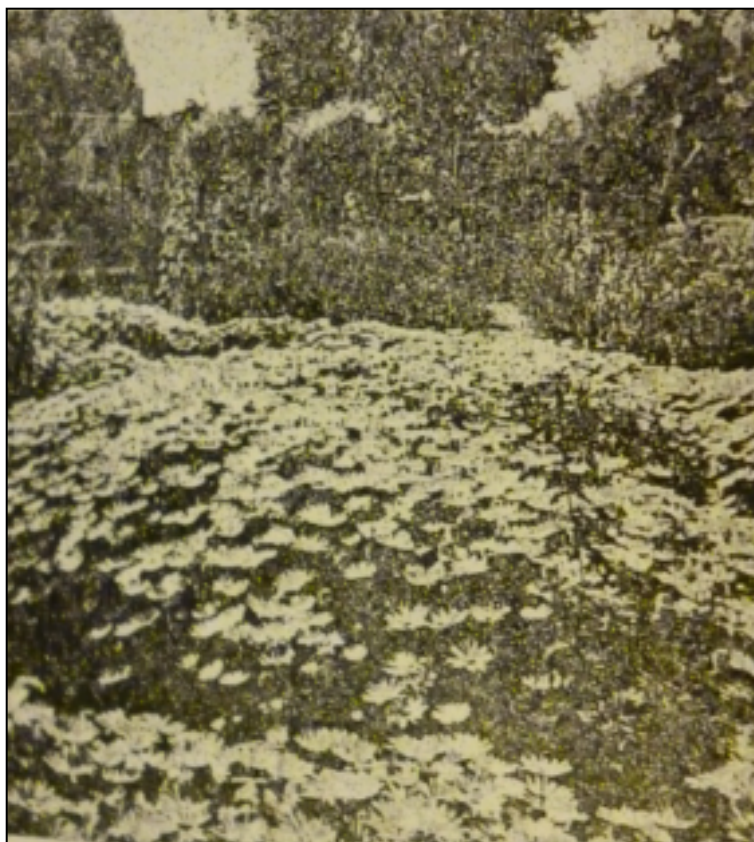
Imagen 14: Jardín de flores en el Parque Ortega.

Es durante la década del 90 cuando el Parque Ortega comienza su declive hasta cerrarse finalmente como balneario en el año 1996. Posteriormente, hasta el año 2010, siguió siendo utilizado como sitio para la realización de bailes y fiestas nocturnas. En ese año se colocó un cartel que prohibía el ingreso al espacio verde.