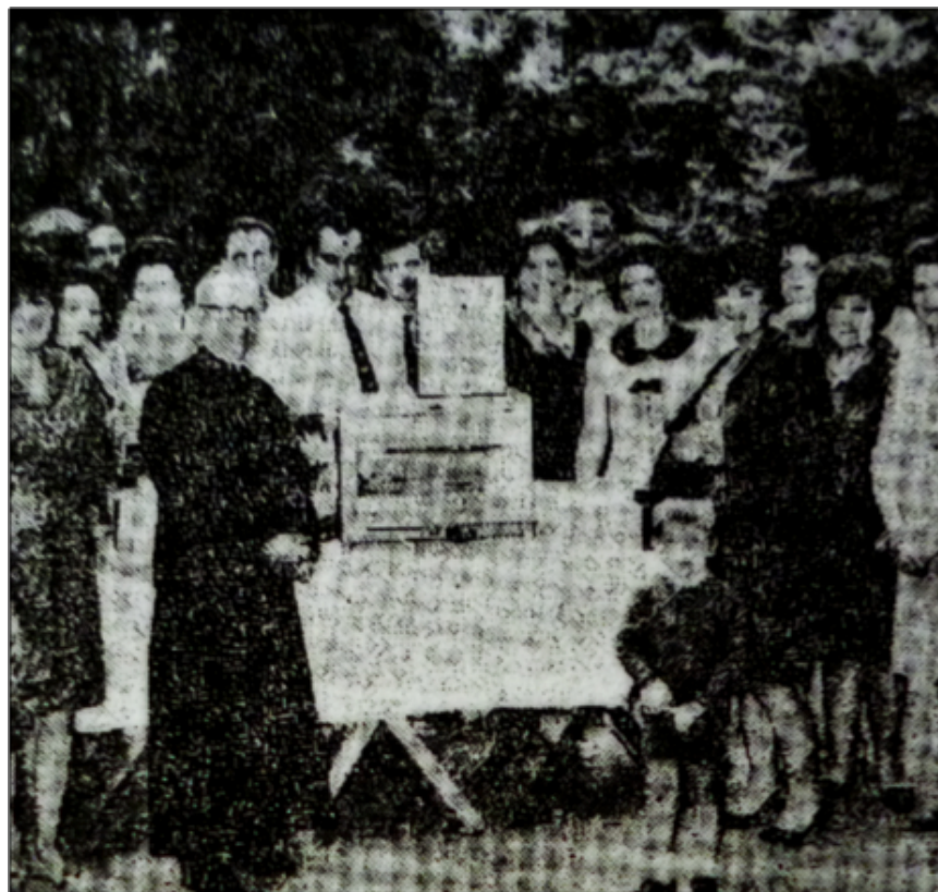
Imagen 18: Rotary Club en Parque Ortega. Almuerzo a beneficio de una sala de primeros auxilios.

Sociedad Mendocina de Nadadores , entre otros, fueron frecuentes en este espacio verde (Diario Los Andes, 23 de octubre de 1930: 13), (Diario Los Andes, 30 de abril de 1940:1).