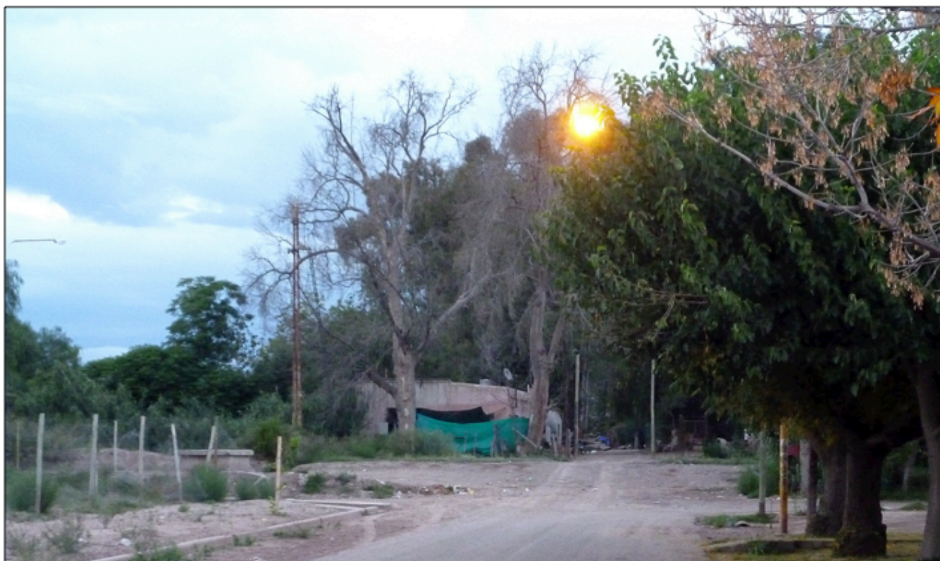
Imagen 17: Foto actual (año 2014) del ingreso al Parque Ortega.