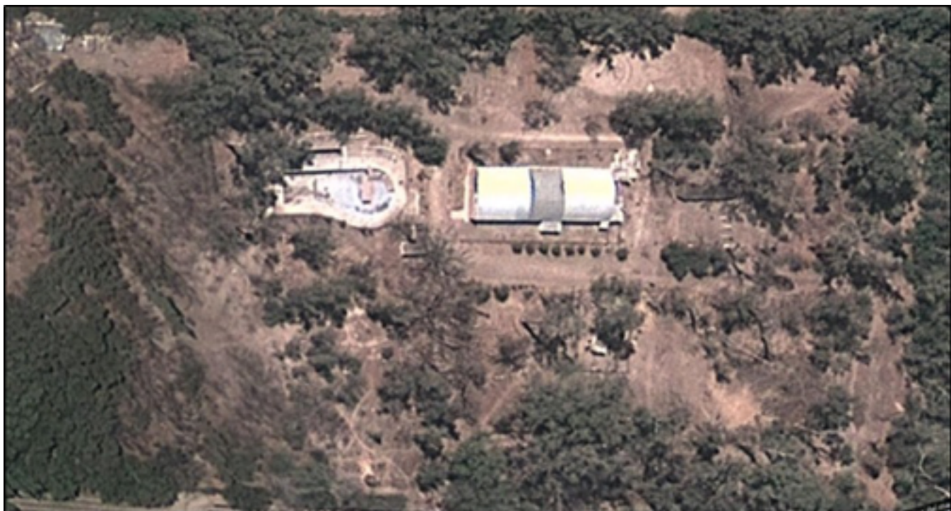
Imagen 3: Vista aérea del Parque Ortega, Rodeo del Medio (Fuente: Google Earth).