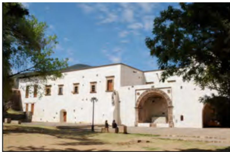
Ilustración 2. Atrio y capilla abierta del Convento Franciscano de Tzintzuntzan, Michoacán, México. 2013.

Este trabajo pretende analizar y exponer como se ha venido dando la gestión del territorio patrimonial de la ciudad de Pátzcuaro, en un análisis retrospectivo al paso de más de 22 años del Decreto de la Zona Federal de Monumentos Históricos.