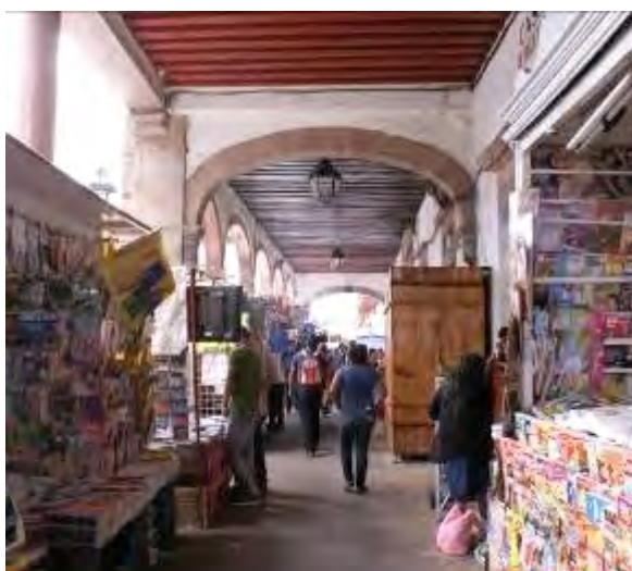
Ilustración 18. La invasión del comercio informal en los portales de la Plaza Gertrudis Bocanegra de Pátzcuaro.

Consideramos que esto es un doble discurso de los diferentes actores gubernamentales – municipales, estatales y federales- quienes no asumen responsabilidades en la toma de decisiones para generar una dinámica de planificación integral interdisciplinaria, en la cual el turismo se considere como una función más de las líneas de desarrollo local, y no se constituya en el elemento preponderante que justifique todas las actuaciones, muchas de las cuales afectan el patrimonio cultural y a la larga al desarrollo de la propia comunidad.