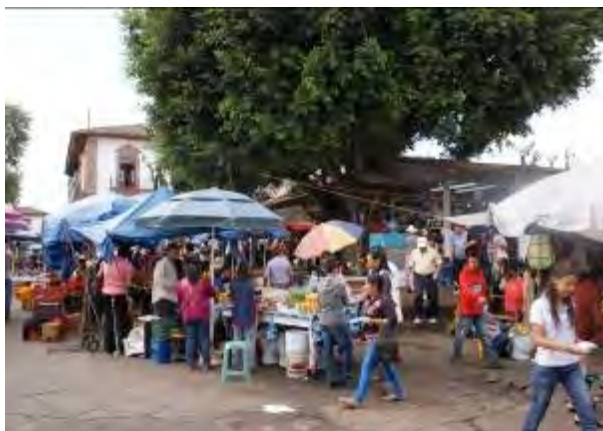
Ilustración 11. Sobrecarga del espacio patrimonial en la Plaza Gertrudis Bocanegra, Pátzcuaro. Fotografía de C. Hiriart, noviembre 3 del año 2013.

A partir de sus diversos valores culturales materiales e inmateriales, Pátzcuaro y los poblados de la zona lacustre desde hace más de ocho décadas ha sido objeto de salvaguarda mediante diversos instrumentos legales, encontrándose como referencias las iniciativas del Congreso de Michoacán como fueron la Ley de Protección y Conservación de Monumentos y Bellezas Naturales de 1931 , la Ley para la Conservación del Aspecto típico y colonial de la Ciudad de Pátzcuaro Michoacán decretada en 1943, y en el año de 1974 Ley que Cataloga y Preve (SIC) la Conservación, Uso de monumentos, Zonas Históricas, Turísticas y Arqueológicas del Estado de Michoacán (Periódico Oficial del Estado de Michoacán, 1974). En el año de 1989 el INAH desarrolló los trabajos para delimitar, justificar y posteriormente gestionar ante el Ejecutivo Federal el Decreto de la Zona de Monumentos Históricos de Pátzcuaro. El 19 de noviembre de 1990, conjuntamente con el Centro Histórico de Morelia, se concretaron las declaratorias de Zonas de Monumentos respectivas, habiéndose publicado en el Diario Oficial de la Federación (DOF, 1990).