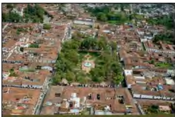
Ilustración 7. Paisaje urbano histórico de Pátzcuaro.