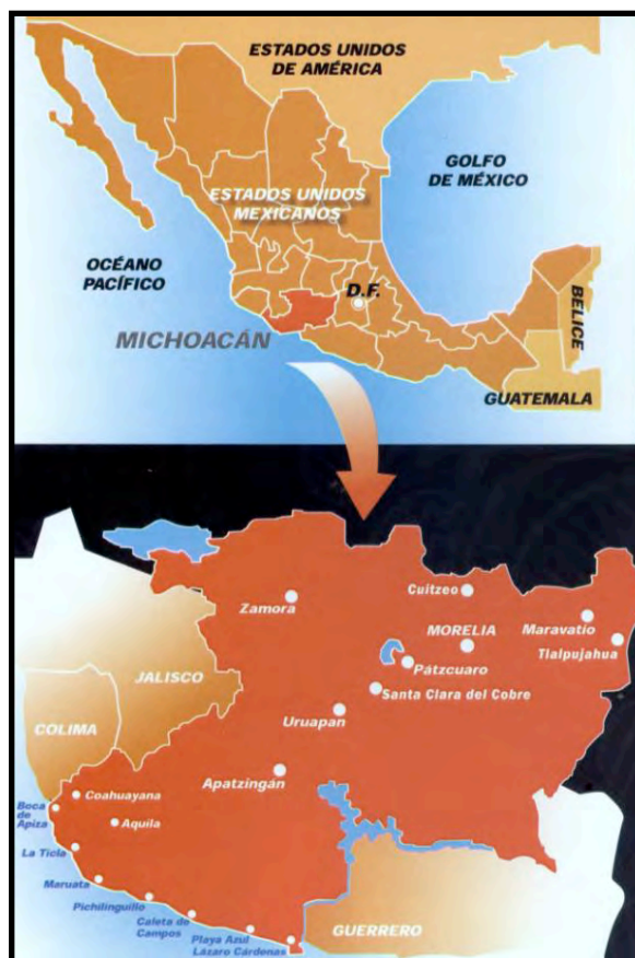
Ilustración 6. Ubicación geográfica del Estado de Michoacán y de la ciudad de Pátzcuaro.

La topografía de la zona lacustres y en particular de la ciudad de Pátzcuaro ha jugado un papel preponderante desde la fundación prehispánica y posteriormente en la conformación de los asentamientos humanos y de la ciudad colonial, como aparece en diferentes textos históricos.