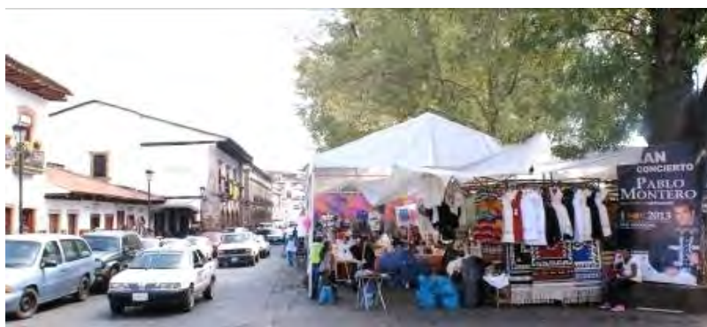
Ilustración 17. El comercio informal en la Plaza Gertrudis Bocanegra de Pátzcuaro.

Hasta mediados del año 2013 a pesar del interés patente del Gobierno de Michoacán expresado en el Programa Estatal de Turismo 2012-2015 (SECTUR Michoacán, 2012), de los esfuerzos realizados por la Dirección de Patrimonio Mundial del INAH y de organismos consultivos de la UNESCO como el ICOMOS Mexicano y su representación en Michoacán, más por una falta de atención a las recomendaciones para integrar los documentos formales - requeridos desde 1994 - de planificación territorial y urbana, el plan de manejo, y sobre todo para definir el marco legal competente de protección urbana y del patrimonio monumental y de gestión eficiente del turismo desde del ámbito municipal, Pátzcuaro no ha sido propuesto para integrarse a la Lista Indicativa, que para octubre del 2013 consideró 27 sitios culturales y naturales con amplias posibilidades en los próximos cinco años para ser reconocidos como sitios del PM por la UNESCO 16 .