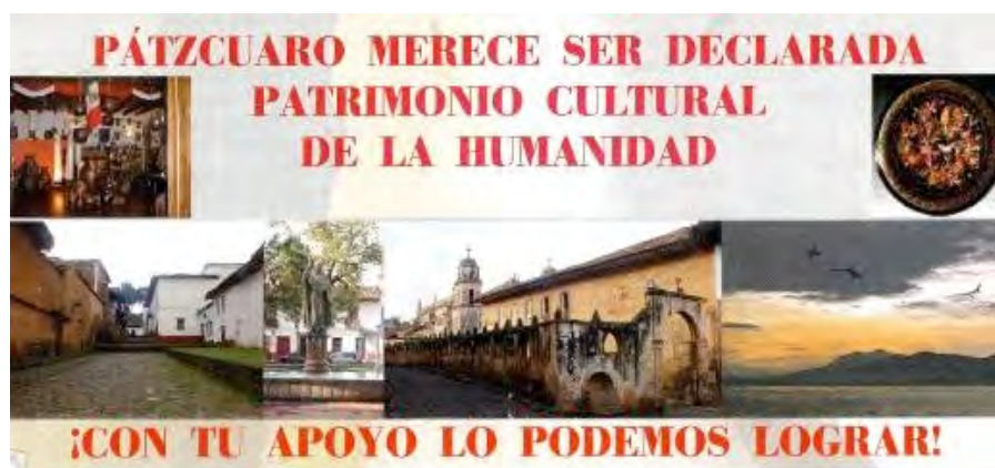
Ilustración 16: Folleto de promoción para la inclusión de Pátzcuaro en la Lista del Patrimonio Mundial Cultural de la UNESCO en 2003.

intangibles que tiene esta región cultural fueron evidentes; situación que propició que se recomendara, por parte del Seminario de Especialistas , trabajar en un expediente integral que pudiera cumplir con los diferentes requisitos solicitados por el Gobierno de la República y el Comité del Patrimonio Mundial de la UNESCO para su evaluación y nominación, particularmente en el fortalecimiento de aspectos de planificación y manejo del territorio patrimonial, normatividad urbana, los reglamentos de construcción y conservación del patrimonio edificado, y la elaboración del Programa parcial de Desarrollo Urbano del Centro Histórico de Pátzcuaro para controlar y normar los cambios de uso del suelo fundamentalmente.