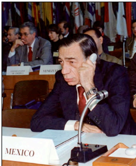
Ilustración 3. Salvador Díaz Berrio-Fernández. Una reunión del Comité del Patrimonio Mundial de la UNESCO.

Esta contribución nos permite también hacer un modesto reconocimiento póstumo al Dr. Salvador Díaz Berrio-Fernández, arquitecto, urbanista, catedrático y un gran defensor del patrimonio cultural, quien participó como asesor en diversos proyectos para la protección del patrimonio urbano arquitectónico del Estado de Michoacán, particularmente en Morelia y Pátzcuaro y que en el año de 1992 con su esfuerzo y trabajo se concretó la posibilidad de que los sitios Culturales de la Cuenca del Lago de Pátzcuaro se situaran en la primera posición de la Lista Indicativa de México para ser propuestos como Patrimonio Cultural de la Humanidad ante la UNESCO.