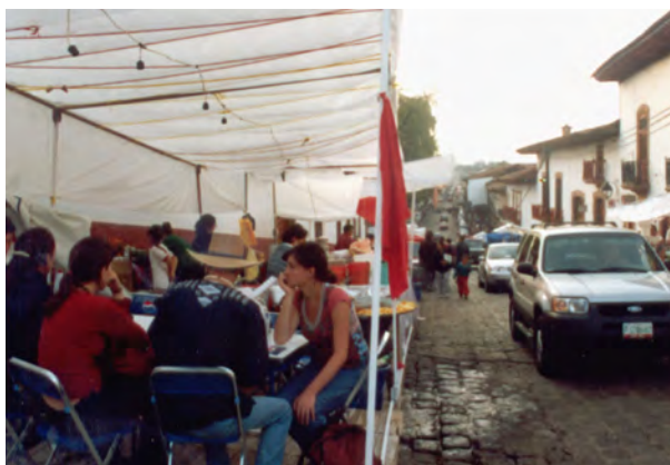
Ilustración 10. Sobrecarga de visitantes y comercio informal en las calles de Pátzcuaro, noviembre 2 del año 2003.

En la actualidad conserva una riqueza arquitectónica que ha surgido a través de su historia centenaria y que incluye edificios religiosos que van desde la Basílica de Nuestra Señora de la Salud hasta las humildes capillas de barrio, pasando por las iglesias y conventos de diversas órdenes religiosas; la arquitectura civil no desmerece en modo alguno, destacando varios ejemplares de lujosas mansiones de dos niveles dispuestas alrededor de la Plaza Mayor (Silva, 2005, p. 11)