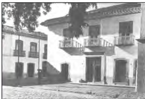
Ilustración 8. La arquitectura civil de Pátzcuaro.