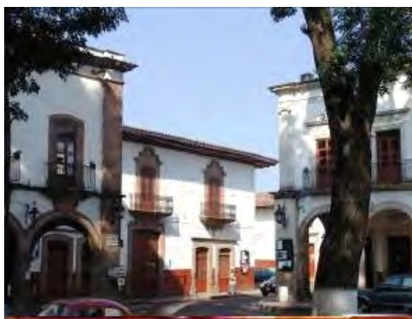
Ilustración 13. Arquitectura civil de Pátzcuaro. Fuente: Fotografía de Eduardo Quintana Méndez. 2013.