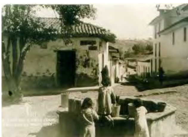
Ilustración 12. Calle Álvaro Obregón y la Fuente de la Cruz Verde, Pátzcuaro, Michoacán.

Cabe destacar que en el análisis de archivos, encontramos que a diferencia del Decreto de la Zona de Monumentos Históricos de Morelia, en el caso de Pátzcuaro no existe ningún antecedente o expediente en el Centro INAH Michoacán que evidencie la participación de actores locales o consulta para la integración del expediente respectivo, consideramos que lo anterior sea una de las causas de que el Decreto de la Zona de Monumentos de Pátzcuaro haya sido elaborado de manera menos acuciosa y detallada, habiéndose identificado también que se dejaron fuera de la delimitación y salvaguarda federal, diversos elementos patrimoniales como pilas y fuentes, además de algunas zonas de valor contextual y de arquitectura vernácula que hubieran merecido incluirse y estar sujetas a la protección planteada en este instrumento legal.