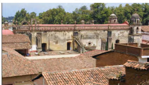
Ilustración 9. Perfil urbano de Pátzcuaro, México.

A partir del análisis de diversos trabajos de investigación, se ha identificado que como las actuales dinámicas funcionales de la ciudad de Pátzcuaro reflejan desde hace varios años (Calderón, 2000) un desarrollo territorial y urbano anárquico, que ha sido propiciado por la falta de instrumentos normativos de planificación del espacio urbano y de conservación patrimonial, y falta de atención a la normatividad establecida en la Ley General de Asentamientos Humanos en lo referente a la obligación de los municipios para elaborar y aprobar formalmente por sus cabildos los programas de Desarrollo