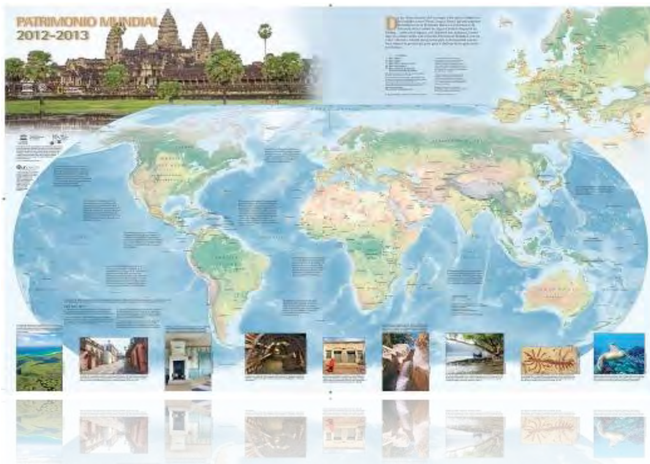
Ilustración 4. Carta geográfica del Patrimonio Mundial de la UNESCO 2012-2013.