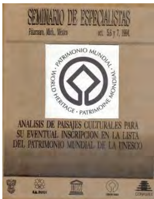
Ilustración 14. Portada del manual de trabajo del Seminario de Especialistas: Análisis de Paisajes Culturales para su eventual inscripción en la Lista el Patrimonio Mundial de la UNESCO.