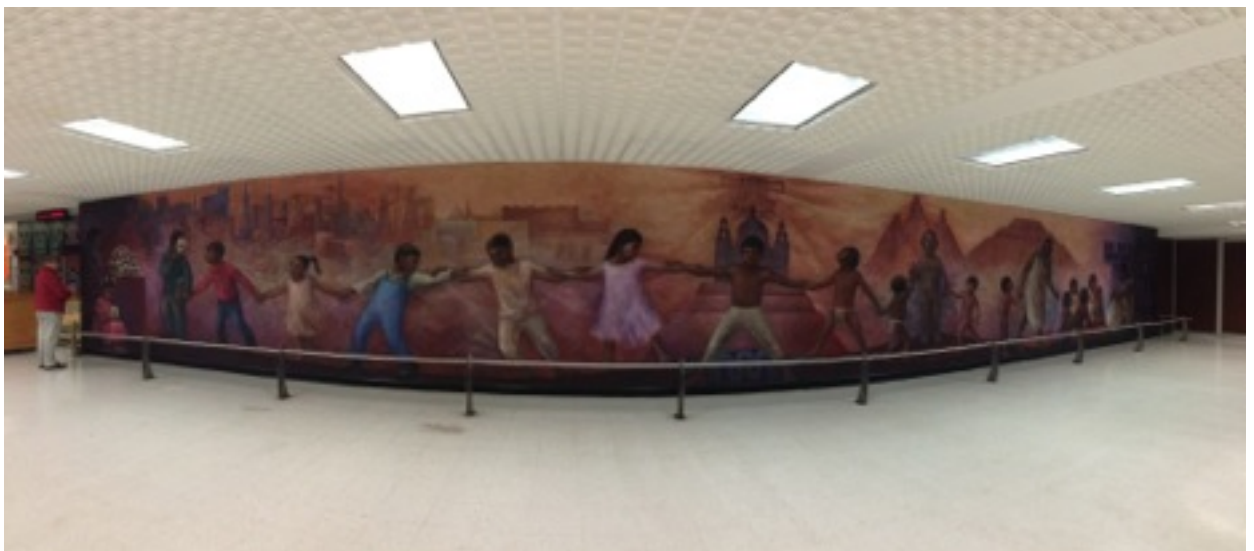
Mural Fany Rabel. Museo Antropología e Historia. Ciudad de México.

vincular la educación con la producción económica, basándose en las propuestas del positivismo, que evolucionaría hasta desembocar en la "sociedad del conocimiento" en la que se enarbola el nuevo paradigma de "mente factura"; que sustituye los factores productivos tradicionales de las empresas por conceptos modernos que sustentan un nuevo estilo de gestión, llamado "gestión científica" que ahora ha transitado a la "gestión participativa" de la empresa moderna, basada en diversos enfoques de la "calidad total", por ejemplo, el agrupamiento óptimo de tareas, aptitudes múltiples