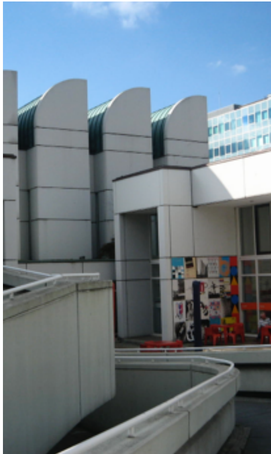
Torres Bauhaus. Berlín. Alemania.

A partir de la década de los años ochenta, las tendencias internacionales y las exigencias de los grandes patrocinadores de la educación, impusieron condiciones acotadas por la