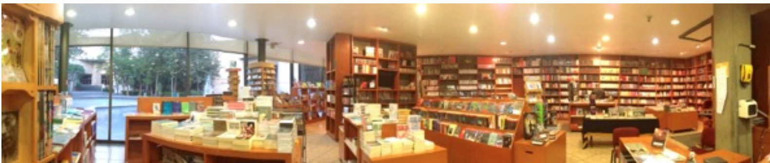
Librería, Ciudad Universitaria.

¿Qué queda entonces del gozo de aprender, de la lectura reposada que descubre en la literatura la grandeza y la miseria de los hombres? ¿qué queda del asombro ante nuestros riesgos? ¿del acercamiento a lo heroico, de la aceptación de lo inexplicable? ¿Qué queda de la conciencia de nuestra inconmensurable ignorancia, principio de toda sabiduría?