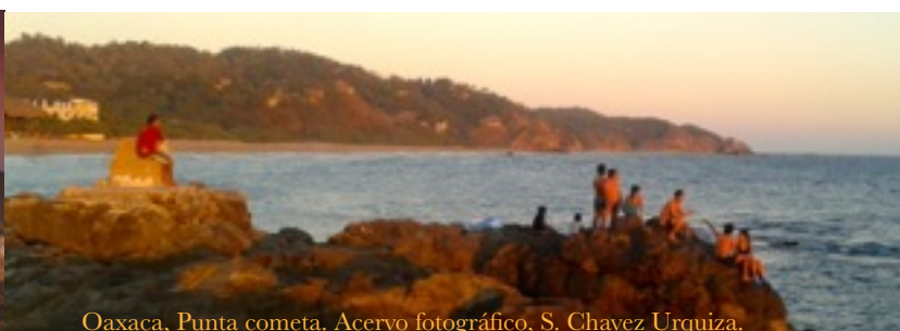
Oaxaca, Punta cometa.