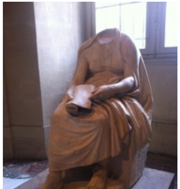
Busto de Senador Romano. Museo del Louvre. Francia.