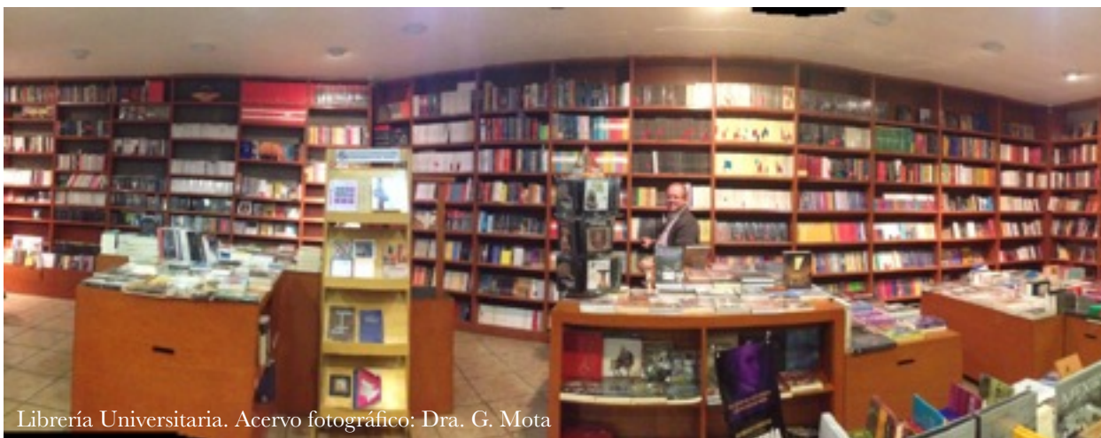
Librería Universitaria.

Acerca del "fordismo", señala Andere (2013) "... la forma de pensar en la educación era, y aún es, lineal: "los niños