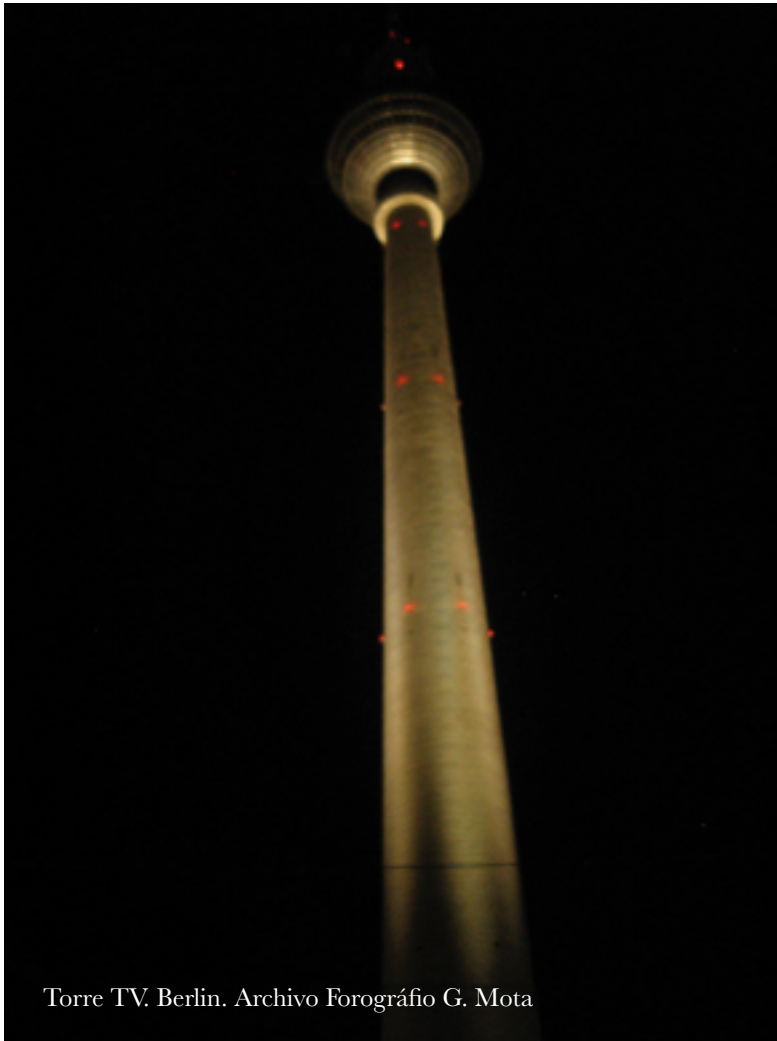
Torre TV. Berlín.