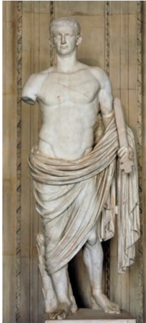
Tiberio Claudio César Augusto Germánico (emperador romano)