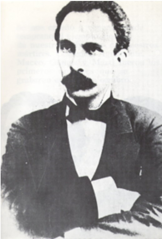
Litografías José Martí