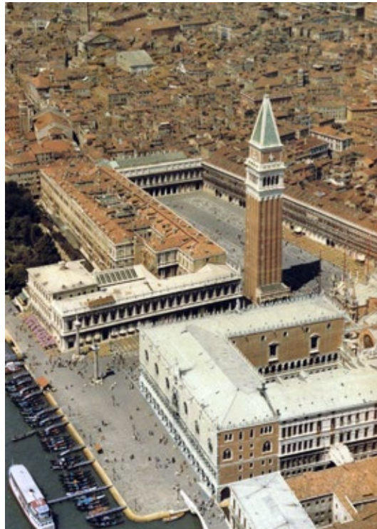
Piazza San Marco today with the Campanile rebuilt 1903–12 following the motto “com’era, dov’era”

Al igual que esta problemática existen otras que acusan a la Carta de Venecia de exclusión. “Abriendo el abanico es claro que la conservación tiene nuevos paradigmas que no aborda la Carta de Venecia, enfocada sólo a la conservación de monumentos y sitios. La conservación del patrimonio cultural es un tema muy vasto. Va desde los valores intangibles como son mitos, tradiciones y leyendas hasta rutas culturales y aspectos de la planeación regional y su relación con el medio ambiente y el equilibrio ecológico.” (p. 92)