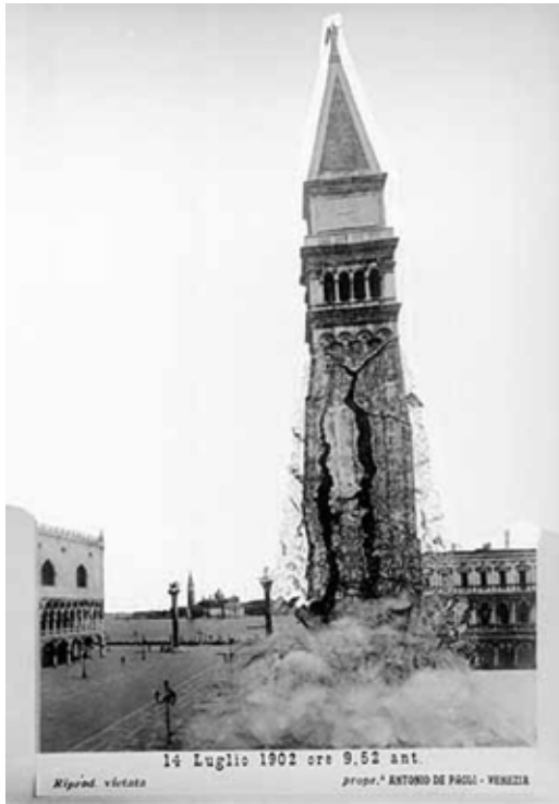
Collapse of the Campanile on 14 July 1902, manipulated photo