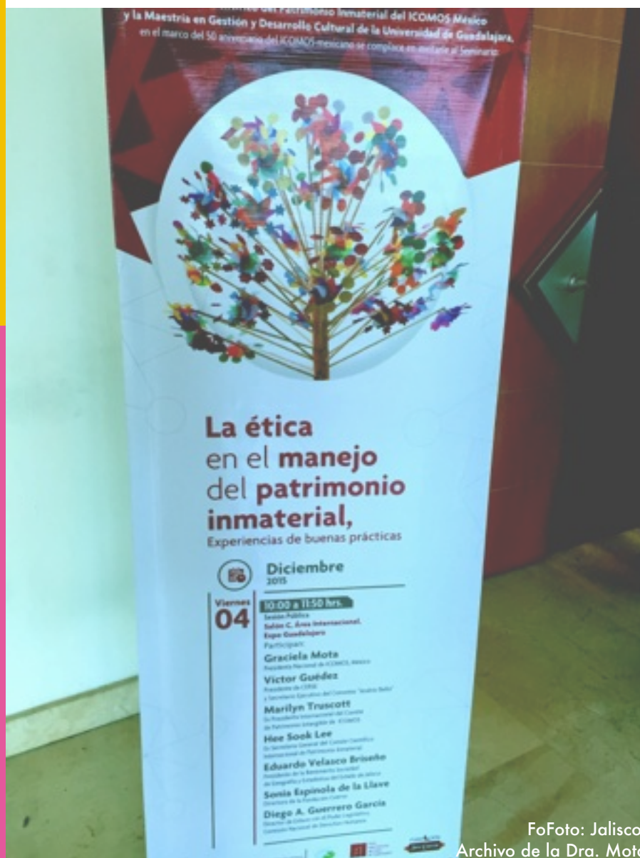
FoFoto: Jalisco, Archivo de la Dra. Mota

2.6. Promoviendo ejemplos de gestión turística responsable y sostenible en los Sitios del Patrimonio Mundial y velando por que la comunidad local o receptora perciba los beneficios del turismo;