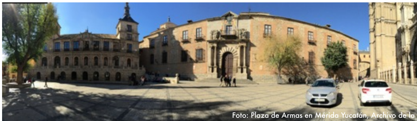
Foto: Plaza de Armas en Mérida Yucatán

5.5. Promoviendo programas culturales e iniciativas de las industrias de la creación con el objeto de regenerar zonas urbanas con la participación de los turistas, así como de la población local.