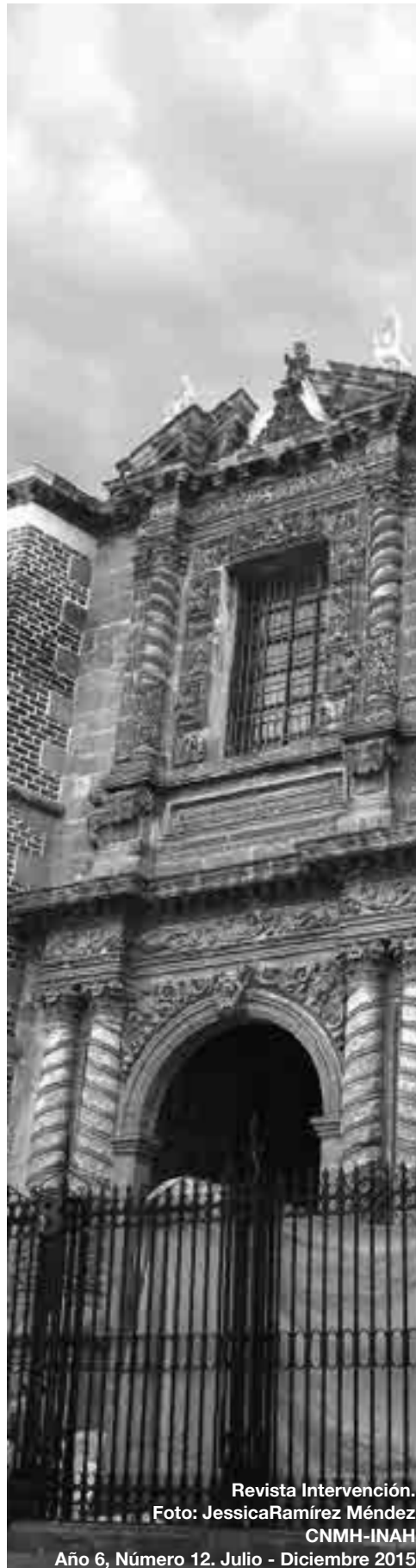
Revista Intervención. Año 6, Número 12. Julio - Diciembre 2015

Cerré el libro. Aunque en principio no entendí por qué, poco a poco mi mente comenzaba a aclararse. Intervención, su contenido, está llena de gente y no me refiero sólo a la editora, a los colaboradores, al comité editorial