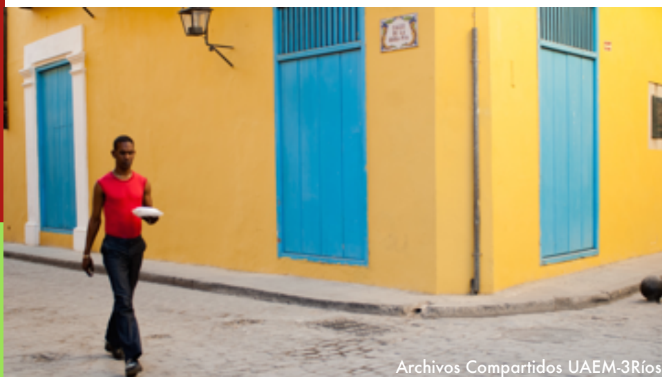
Archivos Compartidos UAEM-3Ríos

Internacional para promover medidas a todos los niveles, en particular mediante la cooperación internacional, y a que apoyen el turismo sostenible como forma de promover y acelerar el desarrollo sostenible, especialmente la erradicación de la pobreza.