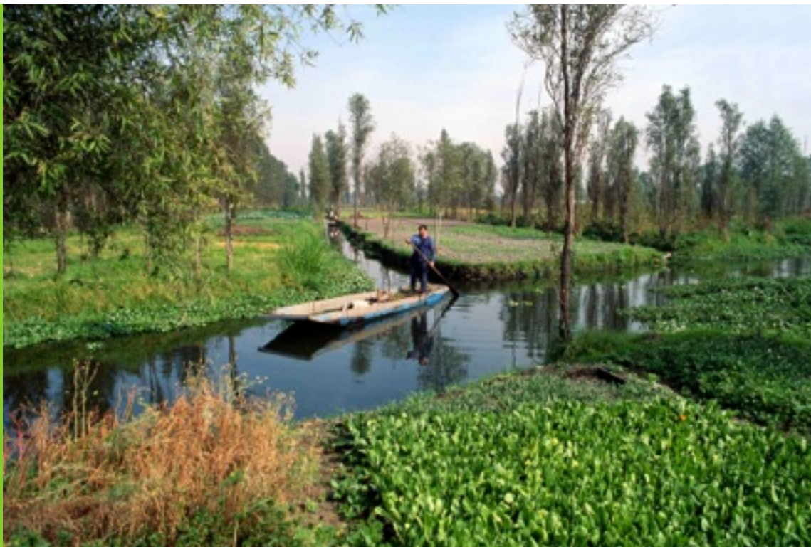
Archivos Compartidos UAEM-3Ríos