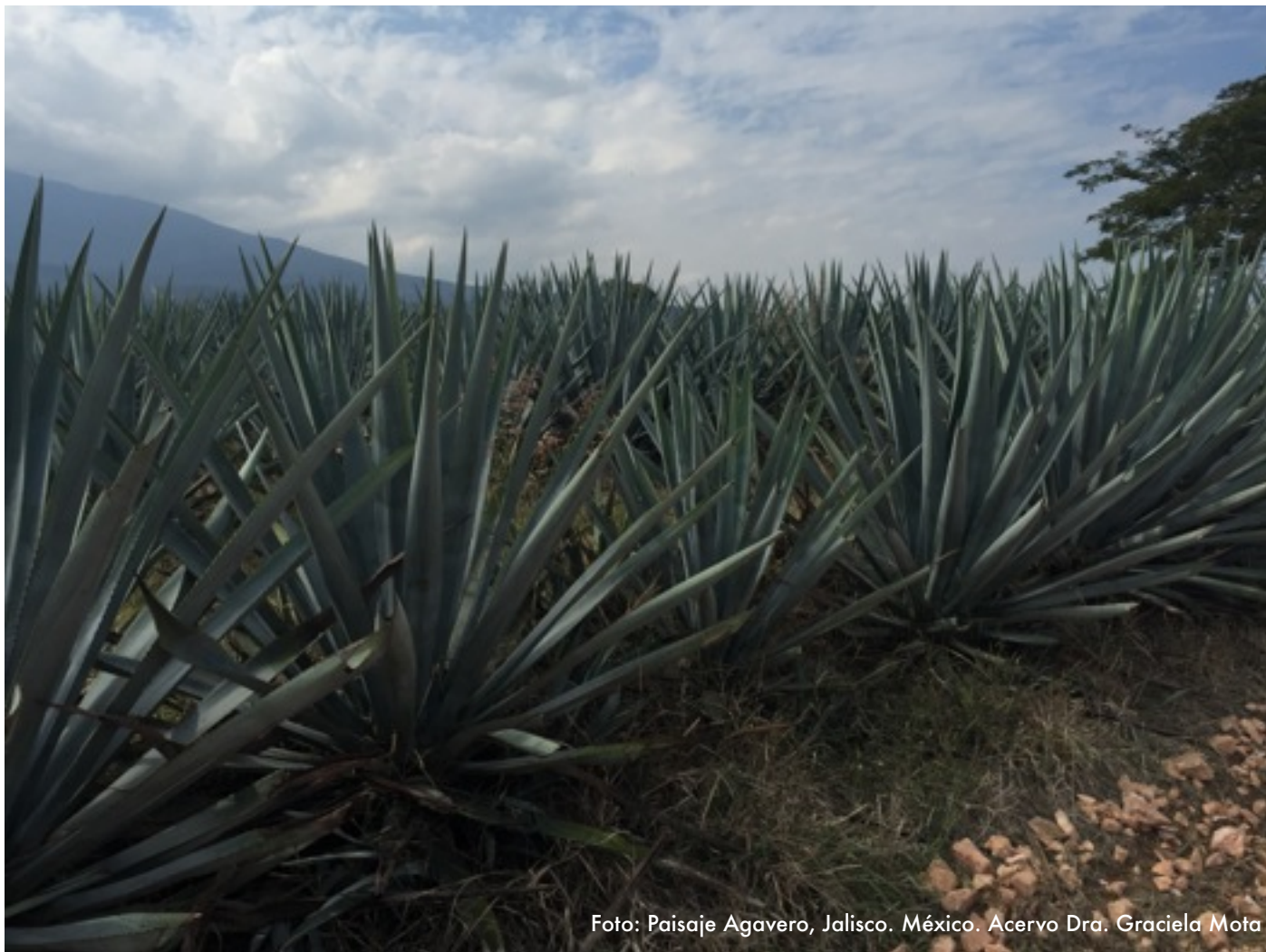
Foto: Paisaje Agavero, Jalisco. México.