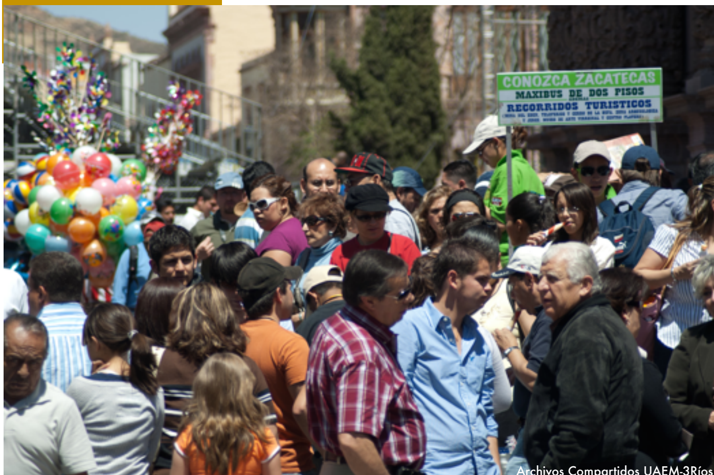
Archivos Compartidos UAEM-3Ríos