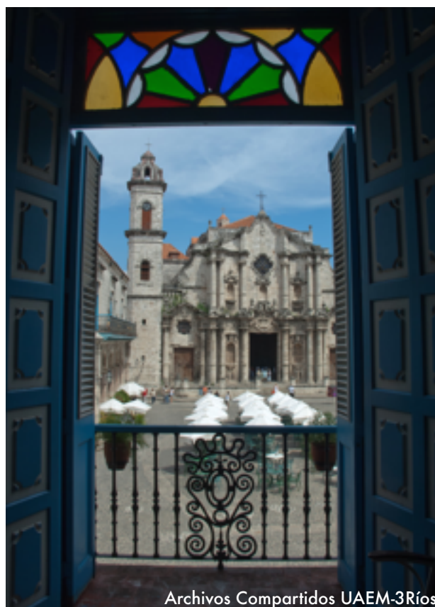
Archivos Compartidos UAEM-3Ríos

Pero hoy en día esta tendencia puede alterarse radicalmente.