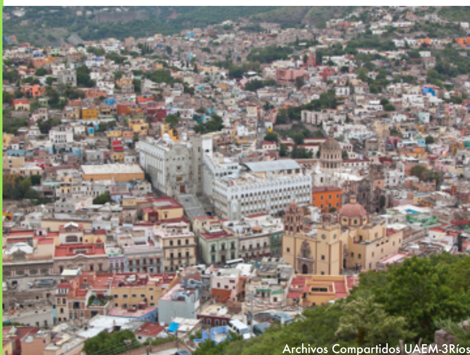
Archivos Compartidos UAEM-3Ríos

“El turismo es uno de los motores más prometedores de crecimiento para la economía mundial, especialmente en los países en desarrollo, y la clave para apoyar a los modelos emergentes en la transición hacia economías verdes;”