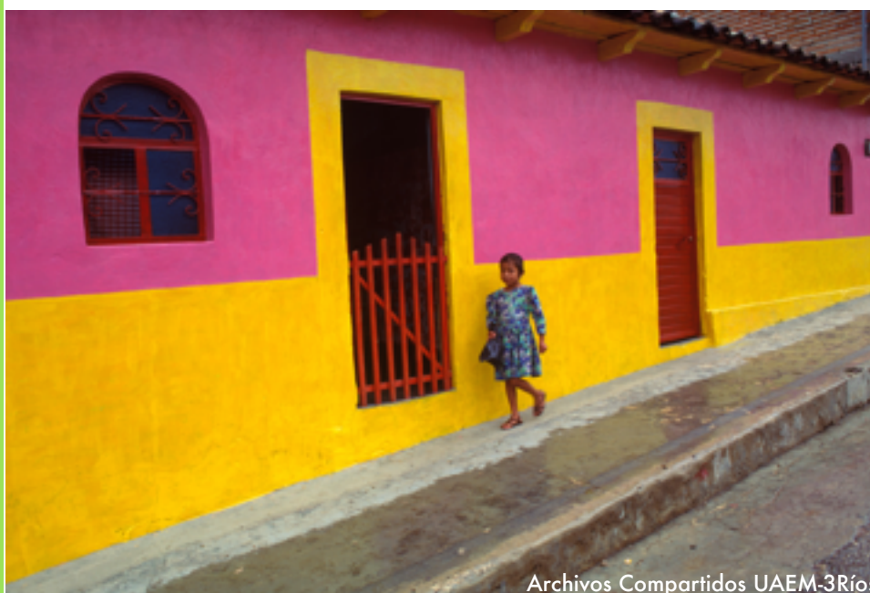
Archivos Compartidos UAEM-3Ríos

"Considerar la capacidad de carga de los destinos, no sólo en el caso de los sitios naturales, sino también en las zonas urbanas,"