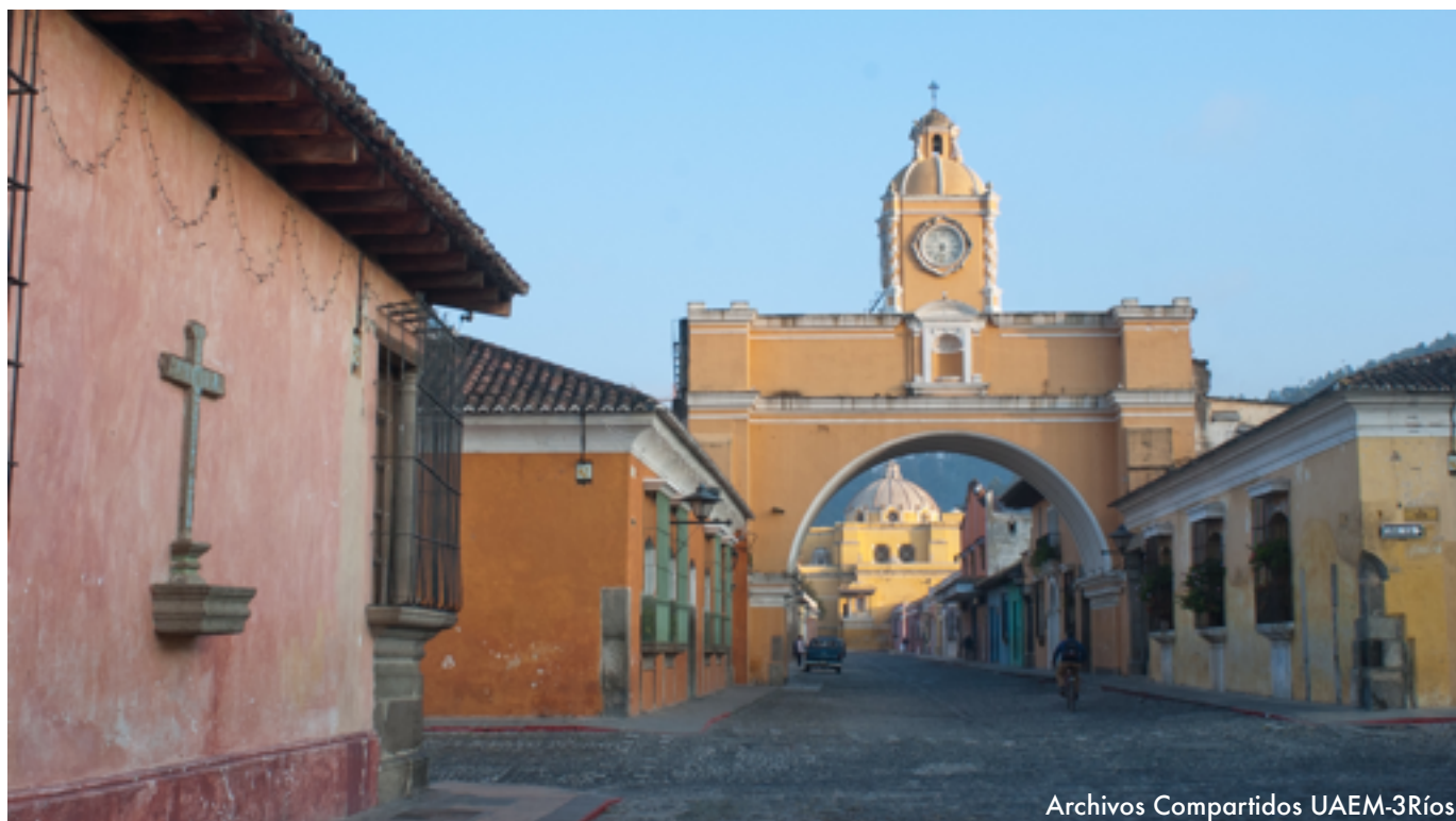
Archivos Compartidos UAEM-3Ríos

“...el turismo debe ser un motor mundial que contribuya eficazmente a reducir la desigualdad dentro y entre los países, a promover sociedades pacíficas e inclusivas, a lograr la igualdad de género y a crear oportunidades de aprendizaje permanente para todos;”