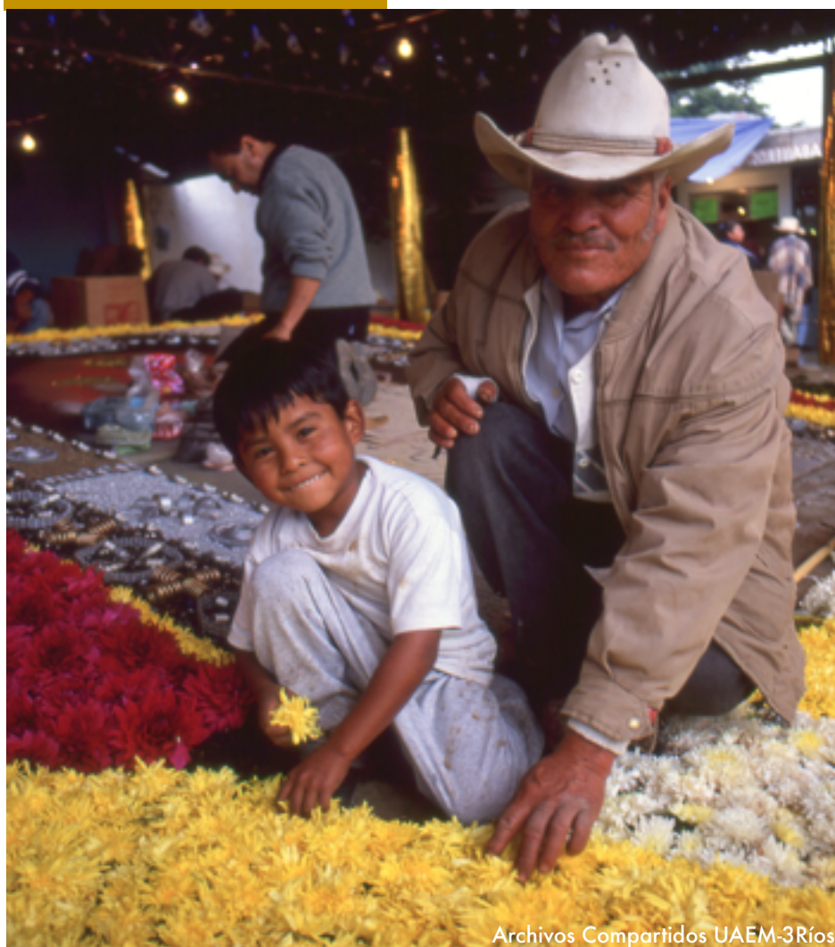
Archivos Compartidos UAEM-3Ríos

Las operaciones turísticas pueden contribuir directa o indirectamente a la conservación la diversidad biológica, lo que obliga a todas las partes implicadas a conocer los verdaderos costes, impactos y beneficios de las actividades turísticas en relación a la biodiversidad.