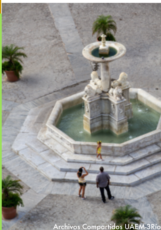
Archivos Compartidos UAEM-3Ríos

Para que “el turismo pueda ser una actividad sostenible, es fundamental que se adopten y pongan en práctica códigos éticos y directrices de sostenibilidad para la industria, los turistas, los gobiernos y las autoridades locales,”