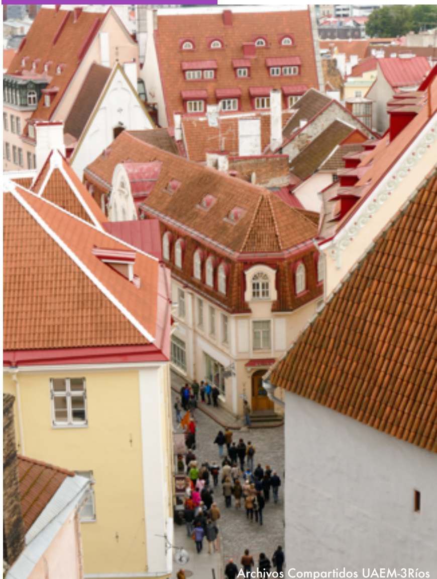
Archivos Compartidos UAEM-3Ríos