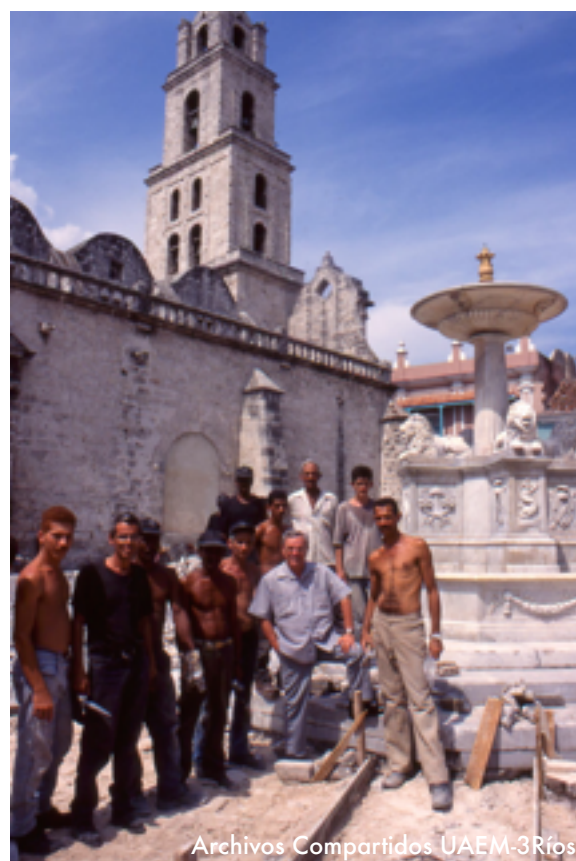
Archivos Compartidos UAEM-3Rfós