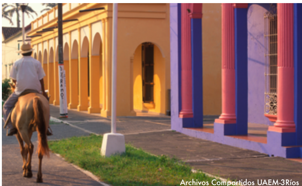
Archivos Compartidos UAEM-3Ríos

“Para 2030, reducir el impacto ambiental negativo per capita de las ciudades, incluso prestando especial atención a la calidad del aire y la gestión de los desechos municipales y de otro tipo.”