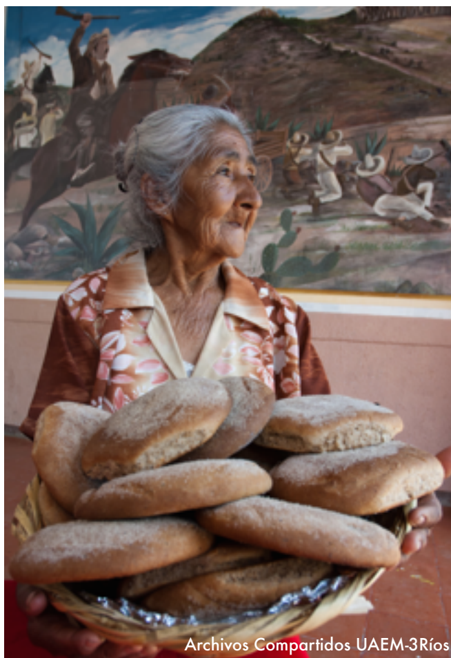
Archivos Compartidos UAEM-3Ríos

• Para 2020, mantener la diversidad genética de las semillas, las plantas cultivadas y los animales de granja y domesticados y sus especies silvestres conexas, entre otras cosas mediante una buena gestión y diversificación de los bancos de semillas y plantas a nivel nacional, regional e internacional, y promover el acceso a los beneficios que se deriven de la utilización de los recursos genéticos y los conocimientos tradicionales y su distribución justa y equitativa, como se ha convenido internacionalmente.