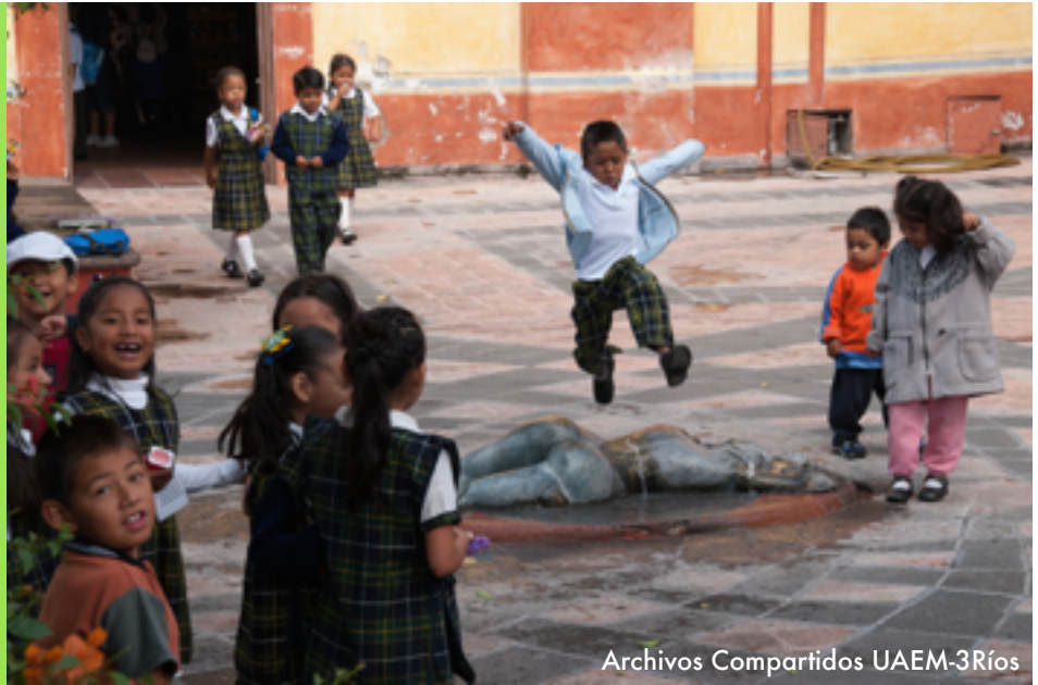
Archivos Compartidos UAEM-3Ríos

“Objetivo 5: Lograr la igualdad entre los géneros y empoderar a todas las mujeres y las niñas