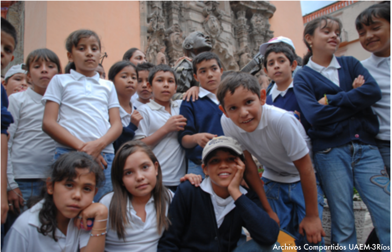
Archivos Compartidos UAEM-3Ríos