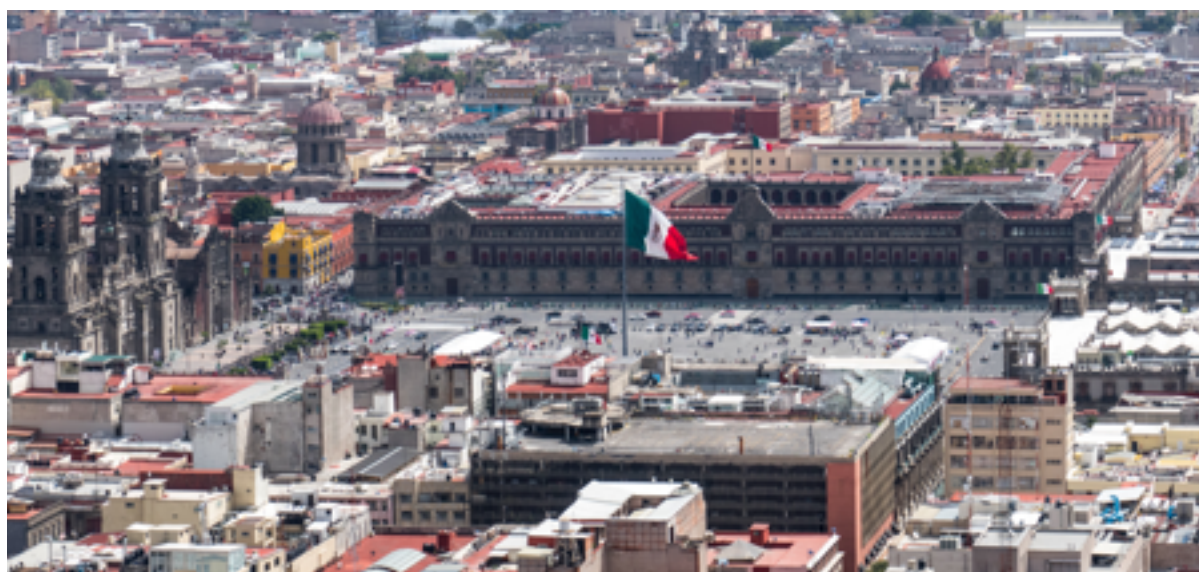
Archivos Compartidos UAEM-3Ríos

“Alentar a las empresas, en especial las grandes empresas y las empresas transnacionales, a que adopten prácticas sostenibles e incorporen información sobre la sostenibilidad en su ciclo de presentación de informes.”