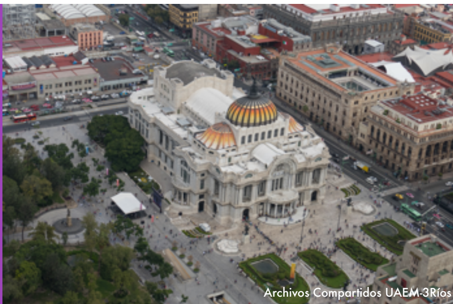
Archivos Compartidos UAEM-3Ríos

“Movilizar un volumen apreciable de recursos procedentes de todas las fuentes y a todos los niveles para financiar la gestión forestal sostenible y proporcionar incentivos adecuados a los países en desarrollo para que promuevan dicha gestión, en particular con miras a la conservación y la reforestación.”