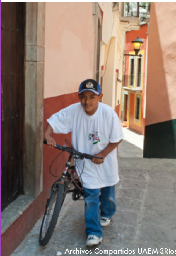
Archivos Compartidos UAEM-3Ríos

Objetivo 4: Garantizar una educación inclusiva, equitativa y de calidad y promover oportunidades de aprendizaje durante toda la vida para todos”