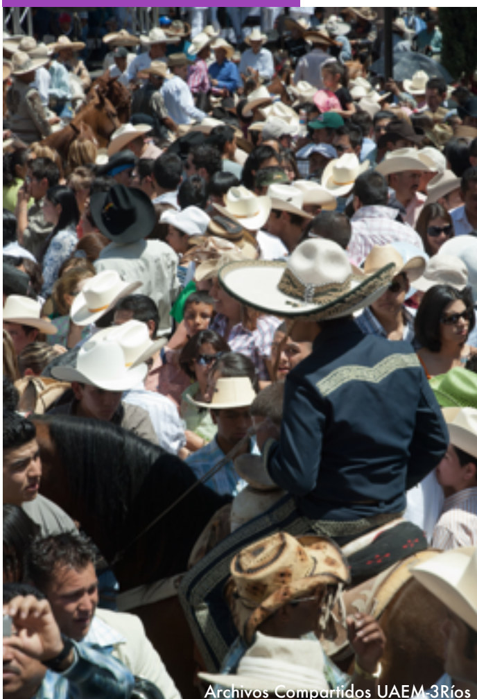
Archivos Compartidos UAEM-3Ríos