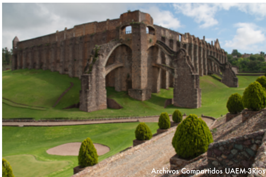
Archivos Compartidos UAEM-3Ríos

“Aumentar de manera significativa las exportaciones de los países en desarrollo, en particular con miras a duplicar la participación de los países menos adelantados en las exportaciones mundiales para 2020.”