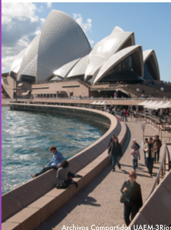
Archivos Compartidos UAEM-3Ríos