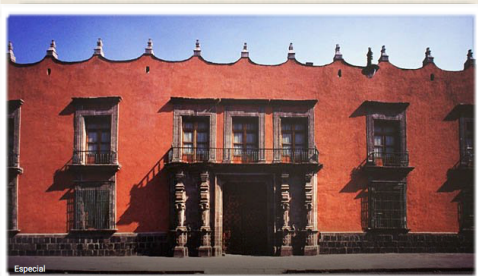
ANTIGUO PALACIO DEL ARZOBISPADO

Proyecto de Restauración del Teatro Principal; Calle 8 Oriente esq. 6 Norte No. 21, Col. Centro, Puebla, Pue., para la Fundación Mary Street Jenkins.