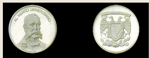
PREMIO GABINO BARREDA UNAM (1991)