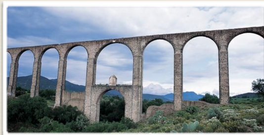
ARCOS DE TPEYAHUALCO