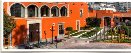
EX HACIENDA DE LOS MORALES WWW.HACIENDADELOSMORALES.COM