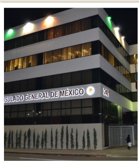
CONSULADO DE MÉXICO EN LOS ÁNGELES

Centro, Ciudad de México, para la S.H.C.P., 2006.