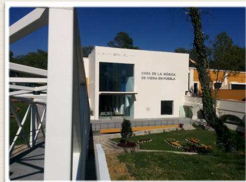
PROYECTO SALA “PUEBLA DE LOS ÁNGELES” HTTP://LADOBE.COM.MX/2015/01/CON-DEFICIENCIAS-ABRESUS-PUERTAS-LA-CASA-DE-LA-MUSICA-DE-VIENA/