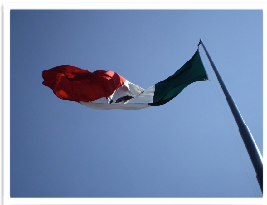
Bandera de México

«sufrimos hoy es un resultado de lo que se hizo – o se dejó de hacer ayer – del mismo modo en que el futuro dependerá de lo que decidamos hacer – o ignorar– en el presente» (Montiel, 2017, p. 1) más allá de todo, un presente en el que la paz se crea y se construye con acciones de todos los días.