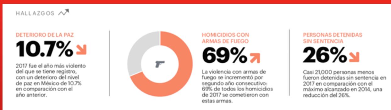
Figura 1: Hallazgos. Institute for Economics and Peace. (2018). Índice de Paz México. 2018, de Institute for Economics and Peace. Sitio Web: https://bit.ly/2qmLo0R

México es considerado alrededor del mundo como un país de riqueza cultural, ecológica y económica, no obstante, una vez que se aborda el tema social, aquel de la situación de paz y violencia, parece que todo va en retroceso. ¿Por qué? Basta con ver la situación de inseguridad que se vive alrededor de la república, desde los pueblos hasta las ciudades. Diversos estudios realizados, como aquel del Instituto para la Economía y la Paz (IEP) y el Índice de Paz México (IPM), afirman que el «2017 fue el año más violento del que se tiene registro, con un deterioro del nivel de paz en México de 10.7% en comparación con el año anterior» (2018, p. 5).