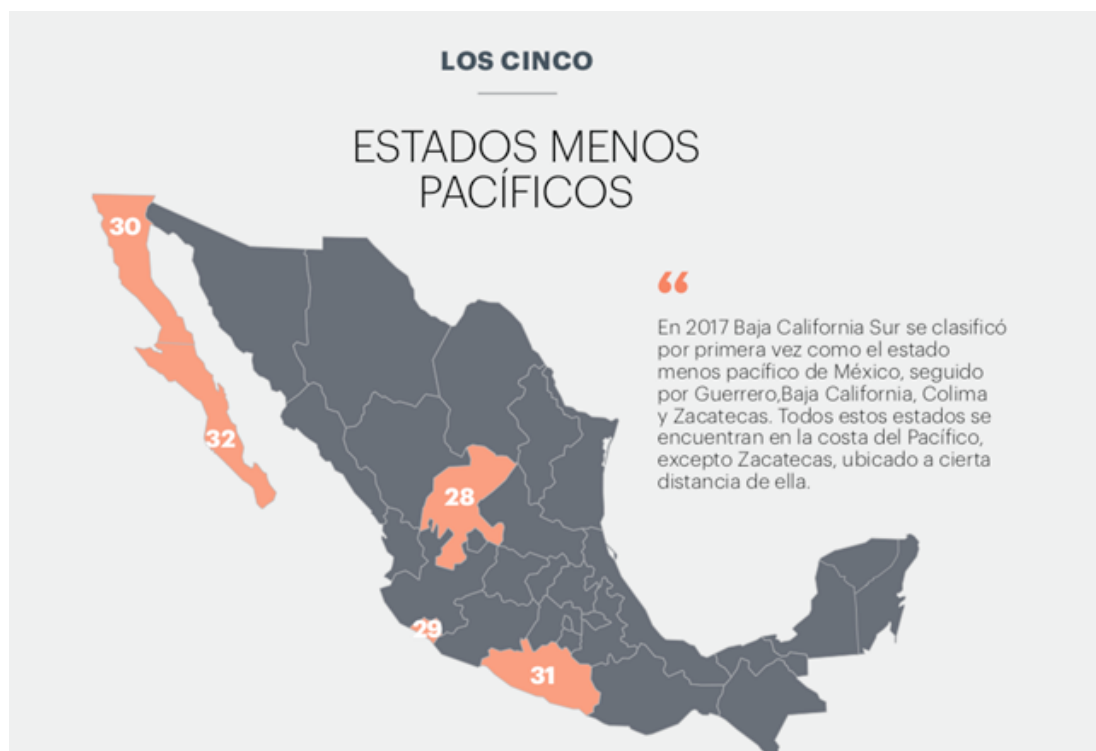
Figura 2: Los cinco estados menos pacíficos. Institute for Economics and Peace. (2018). Índice de Paz México. 2018, de Institute for Economics and Peace.