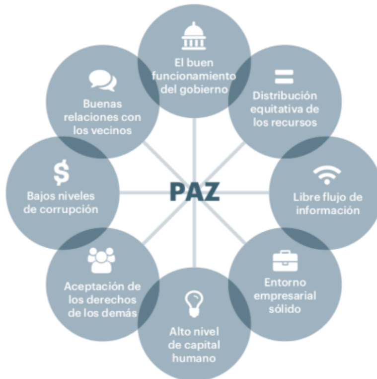
Figura 3: Ocho pilares del IEP. Institute for Economics and Peace. (2018).

Tal respuesta fructífera tiene su base en los ocho pilares para la paz del IEP, que se muestran a continuación: