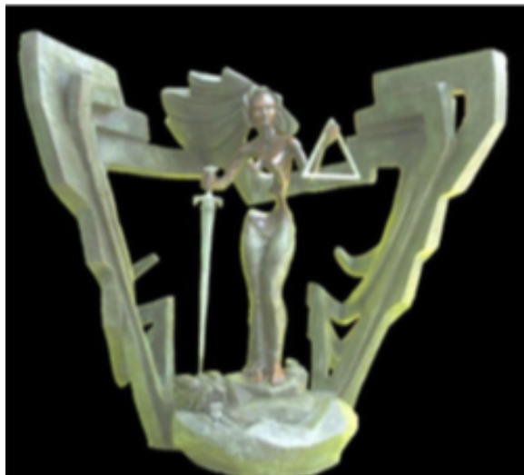
"Justicia mexicana", Glenda Hecksher, s/f., Escultura de bronce, Col. FEMU.

Realizando una comparación entre los dos estudios, el segundo refleja el estado de paz y violencia introducido en el primero, al respecto de la percepción de las personas.