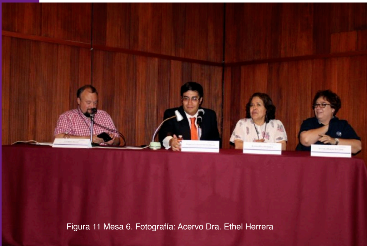
Figura 11 Mesa 6.

La mesa 6 denominada: ESCULTURA FUNERARIA Y EPITAFIOS moderada por el antropólogo y doctor en ciencias naturales, Luis Noel Dulout , tuvo tres pláticas.