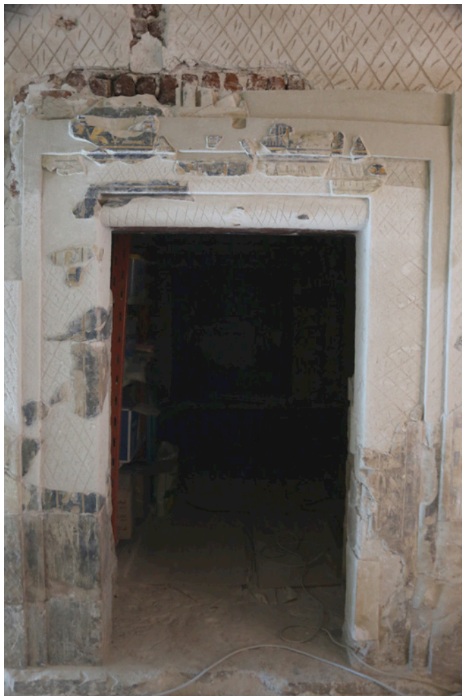
ACERVO: Colección Egipto. Tumba Tiebana 39, Puimra Luxor.