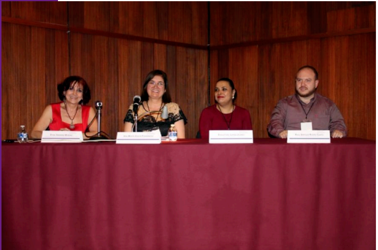
Figura 7 Mesa 3.

En la mesa 3: MÉXICO FUNERARIO VIRREINAL , moderada por la doctora en arquitectura Ethel Herrera Moreno , se trataron tres exposiciones.