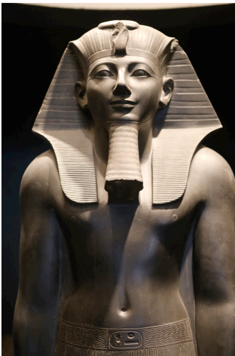
ACERVO: Colección Egipto. Tumba Tiebana 39, Puimra Luxor. Fotografía Manuel Villaroel

Restauración de la tumba tebana 39, Puimra, en Lúxor, Egipto, en la que explicó que desde 2005 se inició el proyecto cultural para el rescate de la TT39 en la Necrópolis de Lúxor, emprendida por la Sociedad Mexicana de Egiptología y la Universidad del Valle de México y apoyada por el INAH y la Secretaría de Relaciones Exteriores, en la que han intervenido especialistas de México y Egipto. El conjunto funerario data de la Dinastía XVIII va , (1539-1069 a.C.) y perteneció a Piumra, segundo sacerdote de Amón y gran tesorero del rey, quien desempeñó más de 15 cargos dentro de la corte real, con los faraones: Hatshepsut, y Tutmosis III.