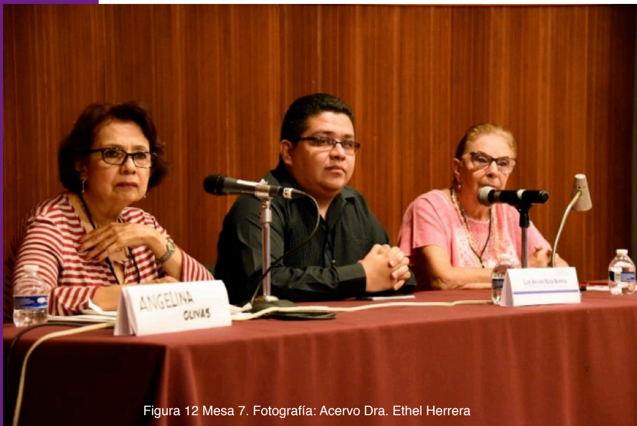
Figura 12 Mesa 7.

En el primero de ellos, denominado Entre familias. Costumbres Funerarias en México , la profesora Ingeborg Montero Alarcón , expresó que su trabajo está basado en la recopilación de información a través de