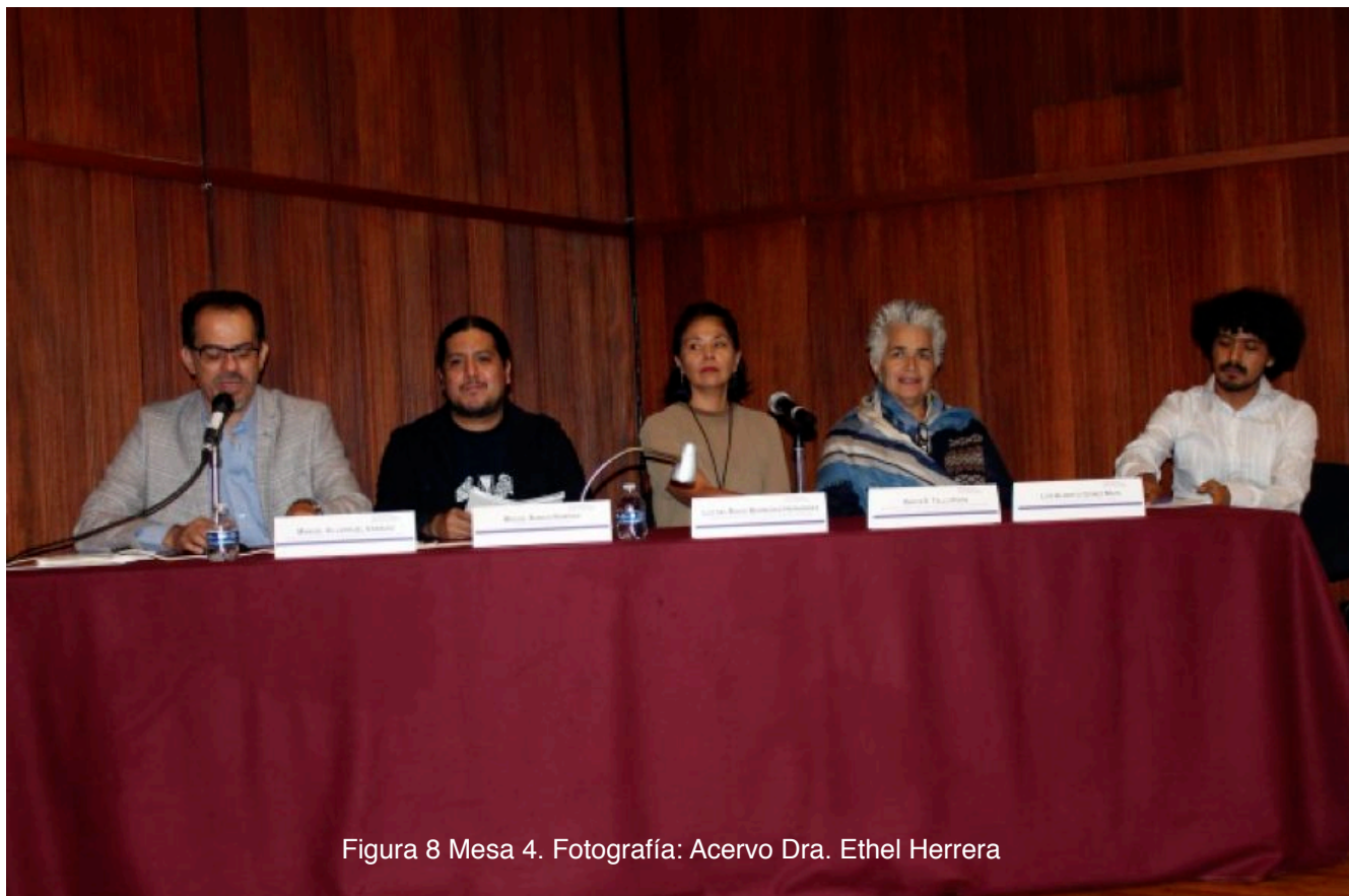
Figura 8 Mesa 4.

La gentes los llama “monumentos”; manifestación patriótica del culto a los héroes, patrimonio y memoria expresados con la intención de legitimación histórica y una acción civilizatoria urbana por parte de grupos influyentes de aquellas épocas. Terminó señalando que el breve estudio se refiere principalmente a un espacio urbano, social y de culto por excelencia, como lo es la Catedral de Valparaíso, en la Plaza de la Victoria.