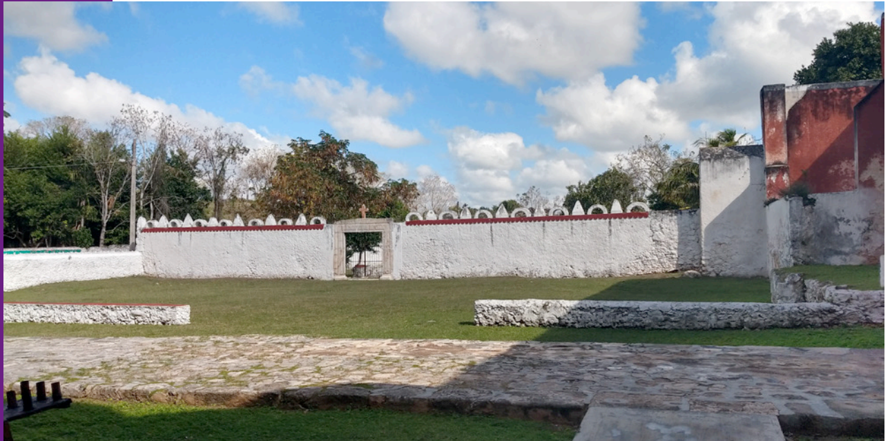
Cementerio Colonial de Teabo.