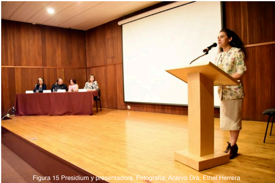
Figura 15 Presidium y presentadora.