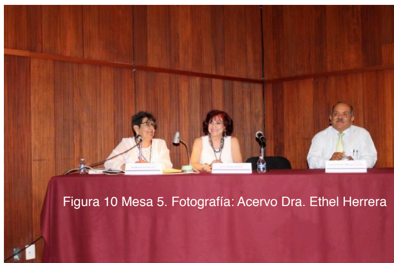
Figura 10 Mesa 5.

Explicó que partiendo de la relación porosa que se vivió entre iglesia y estado en la independencia, en búsqueda de una identidad, dio como resultado la creación del panteón nacional, en el cual se dispusieron los principales héroes.