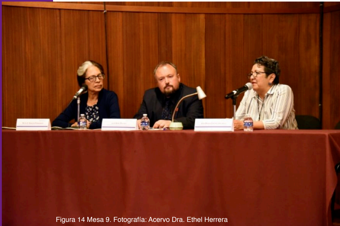
Figura 14 Mesa 9.