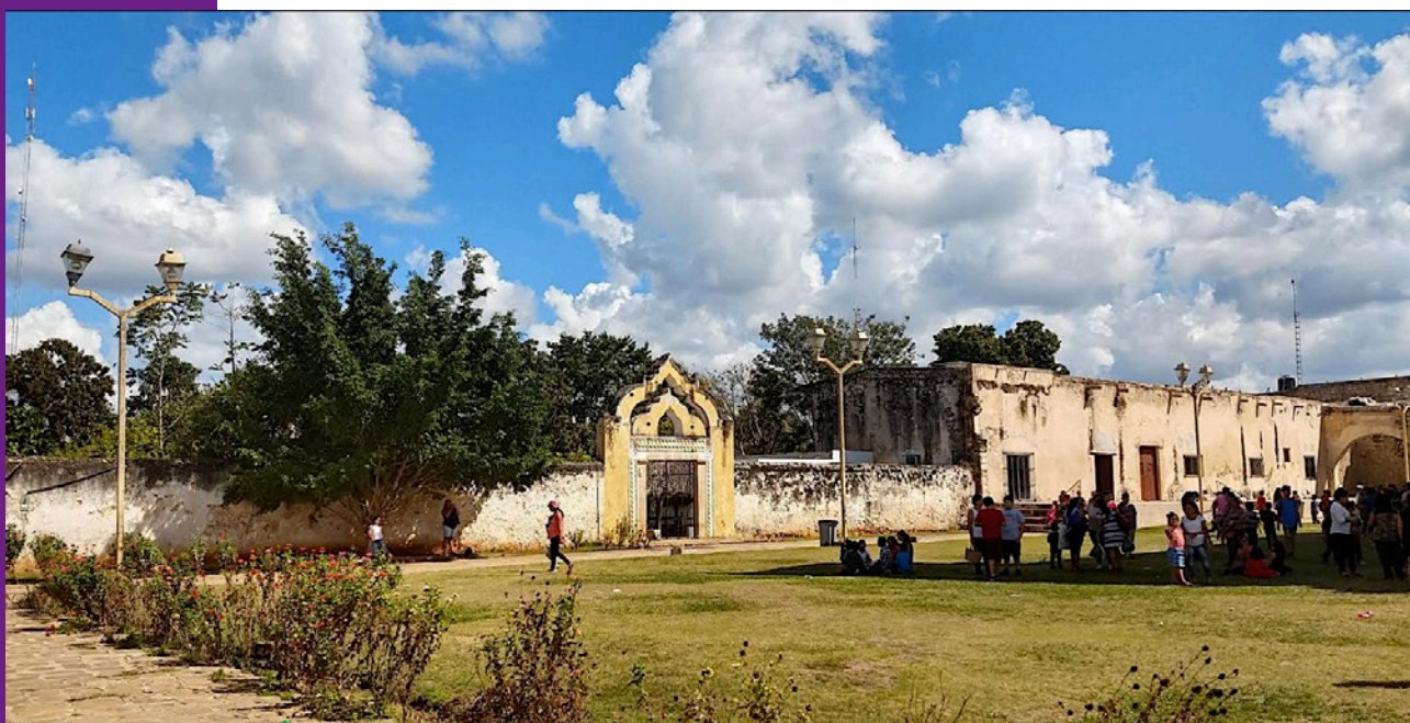
Cementerio Colonial de Oxkutzcab.

Propuso acciones inmediatas a realizar para su conservación o para, como mínimo, evitar un mayor deterioro. En los casos pertinentes planteó su vinculación con la actividad turística, mientras que en otros, apuntó que lo ideal sería que continuaran siendo espacios para la vida comunitaria dentro de los complejos religiosos.