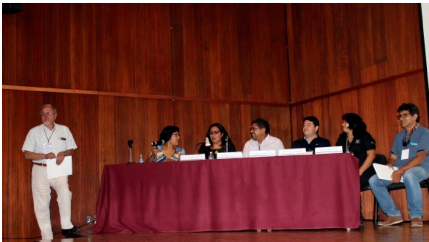
Figura 6 Mesa 1.

MÉXICO FUNERARIO PREHISPÁNICO , moderada por la maestra en historia Araceli Peralta Flores , se discutieron cinco temas.