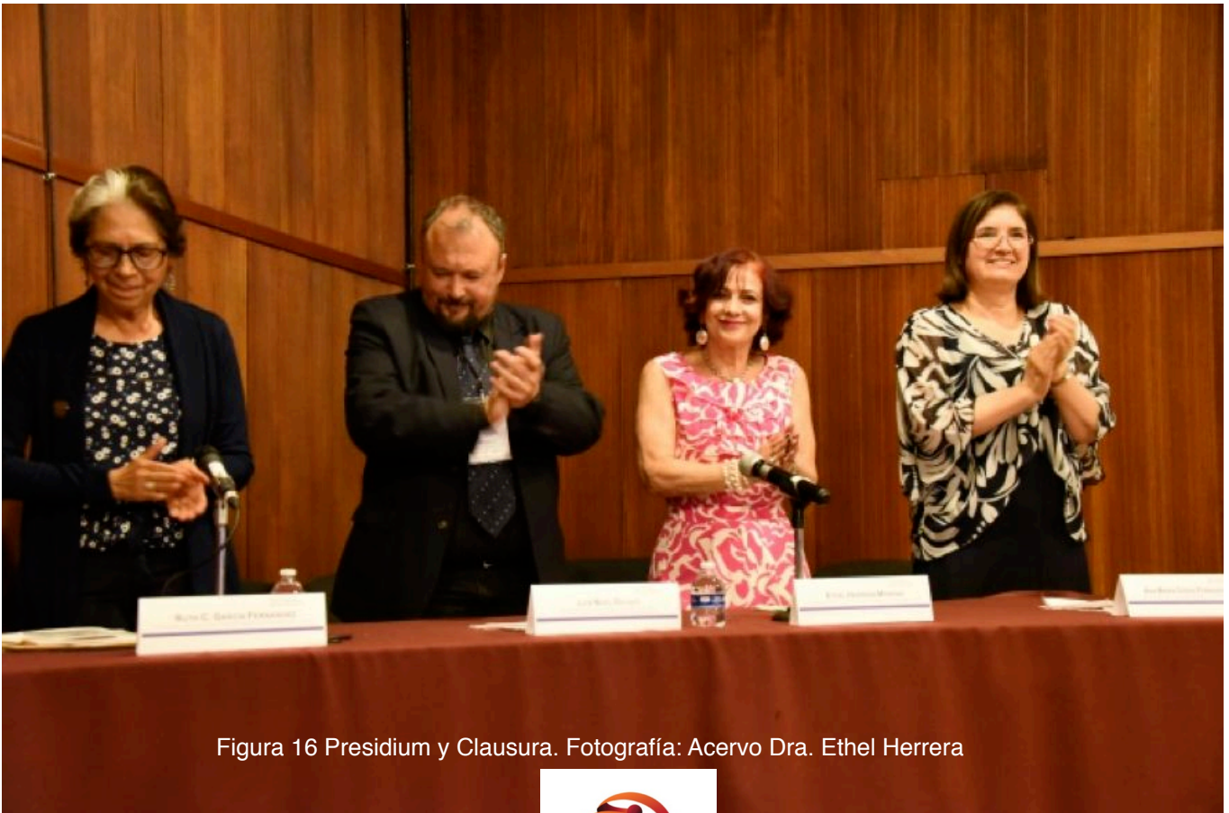
Figura 16 Presidium y Clausura.