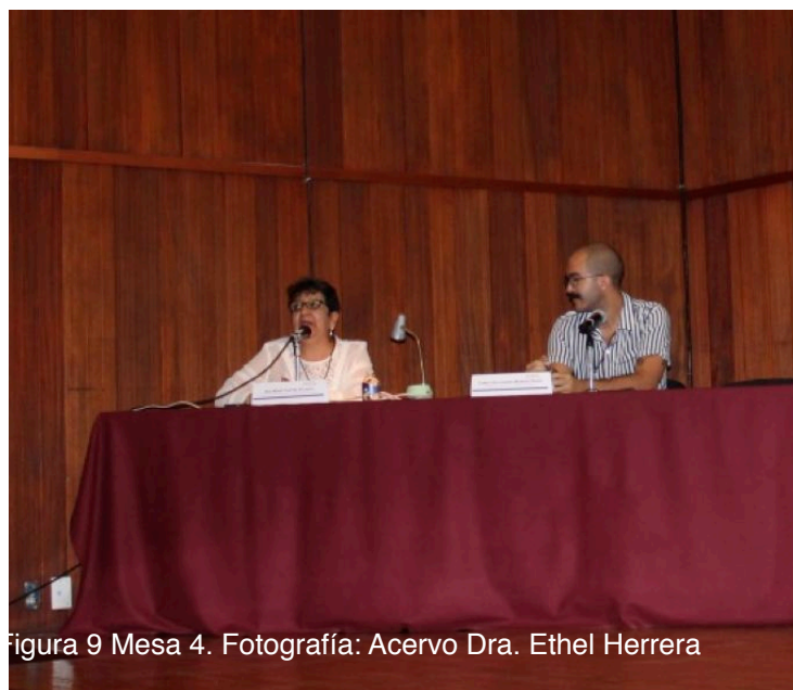
Figura 9 Mesa 4.

El Cementerio Central de Bogotá , nos introdujo a la historia del cementerio que dividió en tres grandes etapas, las cuales, dijo, son perfectamente consonantes con la historia del país y de la ciudad.