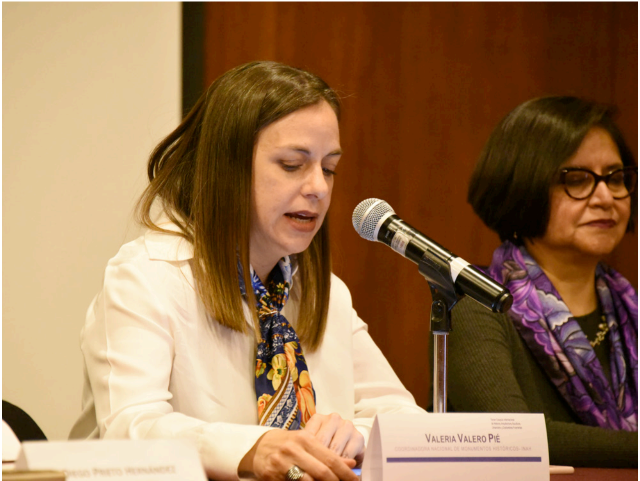
Figura 4 Ceremonia de Inauguración. Mtra, Valeria Valero.