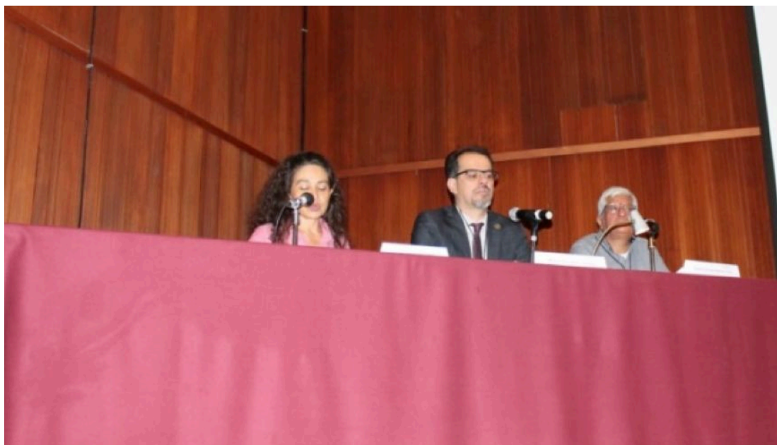
Figura 5 Mesa 1.

Se aceptaron 27 ponencias con variada temática que fueron divididas en 9 mesas.