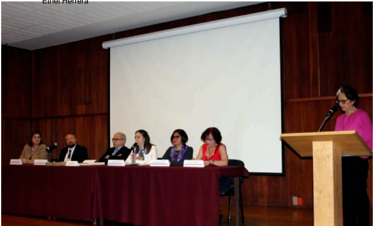
Figura 4 Ceremonia de Inauguración.