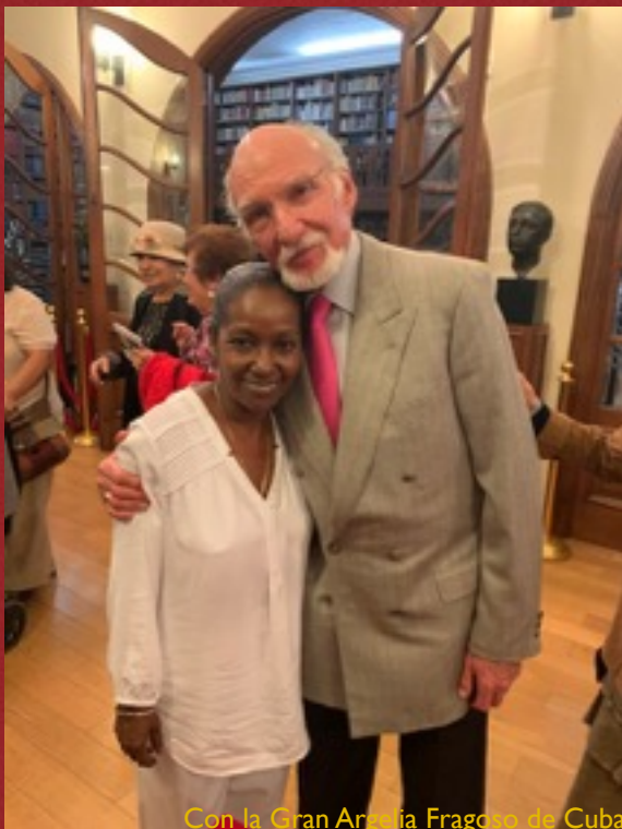
Con la Gran Arzobispo Frago de Cuba.