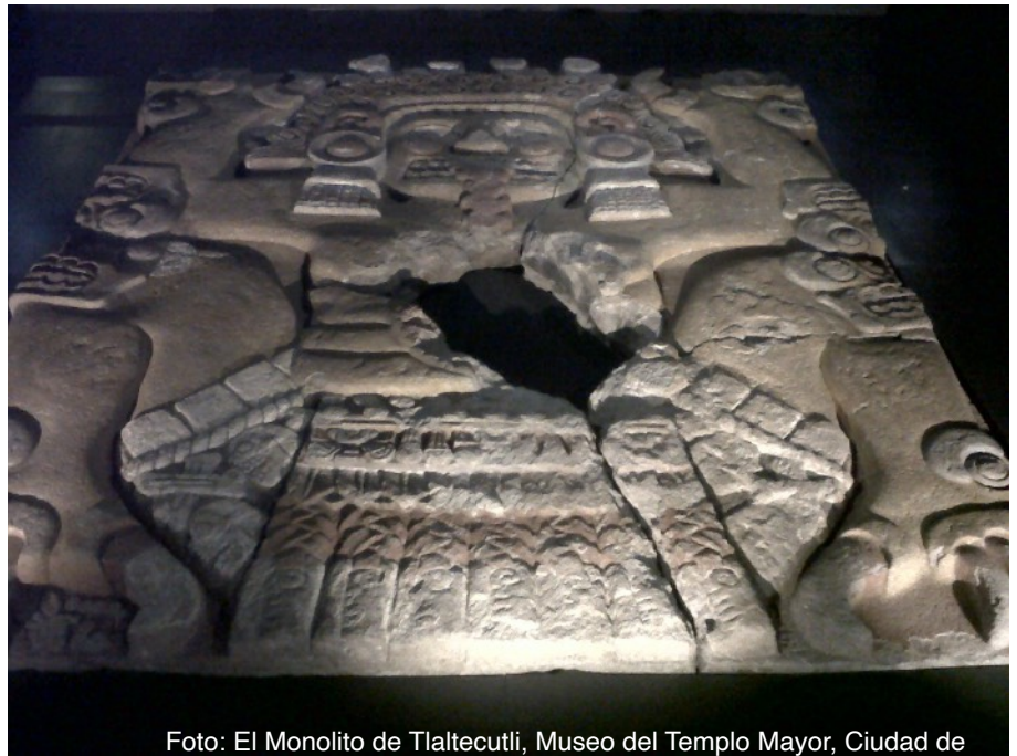
Foto: El Monolito de Tlaltecuctli, Museo del Templo Mayor, Ciudad de México.

Sin embargo, ellos pueden tener necesidades específicas durante la crisis actual, y por lo tanto es preferible no imponer soluciones generalizadas -que pueden ser o no apropiadas para todos-, ya que puede colocar a su personal en una posición incómoda. Recuerde que si ellos no tienen porqué revelar su información personal, es deber de todos considerar que las personas que nos rodean, pueden tener necesidades específicas.