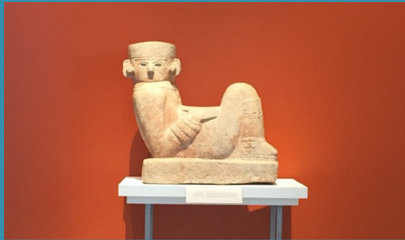
Foto: Chac Mool, Museo Regional de Antropología: Palacio Cantón de Mérida, Yucatán, México.

https://icom.museum/en/news/statement-on-the-necessity-for-relief-funds-for-museums-during-the-covid-19-crisis/