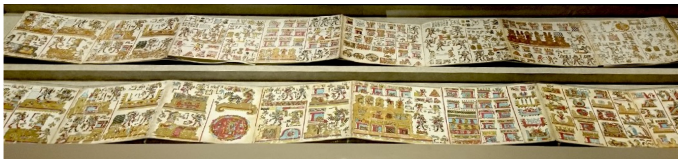
Foto: Códices Mixtecos Naandeye o Tonindeye, Museo Nacional de Antropología e Historia, Ciudad de México. Acervo Dra. Graciela A. Mota

Los tiempos de cambio, ya sean buenos o malos, conducen a tener nuevas experiencias y a experimentar cosas nuevas. En los medios se han visto muchos artículos que alientan a las personas a quedarse en casa a intentar aprender nuevas cosas, mejorar sus rutinas habituales o crear nuevos hábitos saludables (como cocinar más, o hacer ejercicio en interiores). Esto también podría aplicarse a sus actividades profesionales. Dado que sus planes y hábitos han sido interrumpido en el museo, ¿por qué no buscar nuevas formas de trabajar?