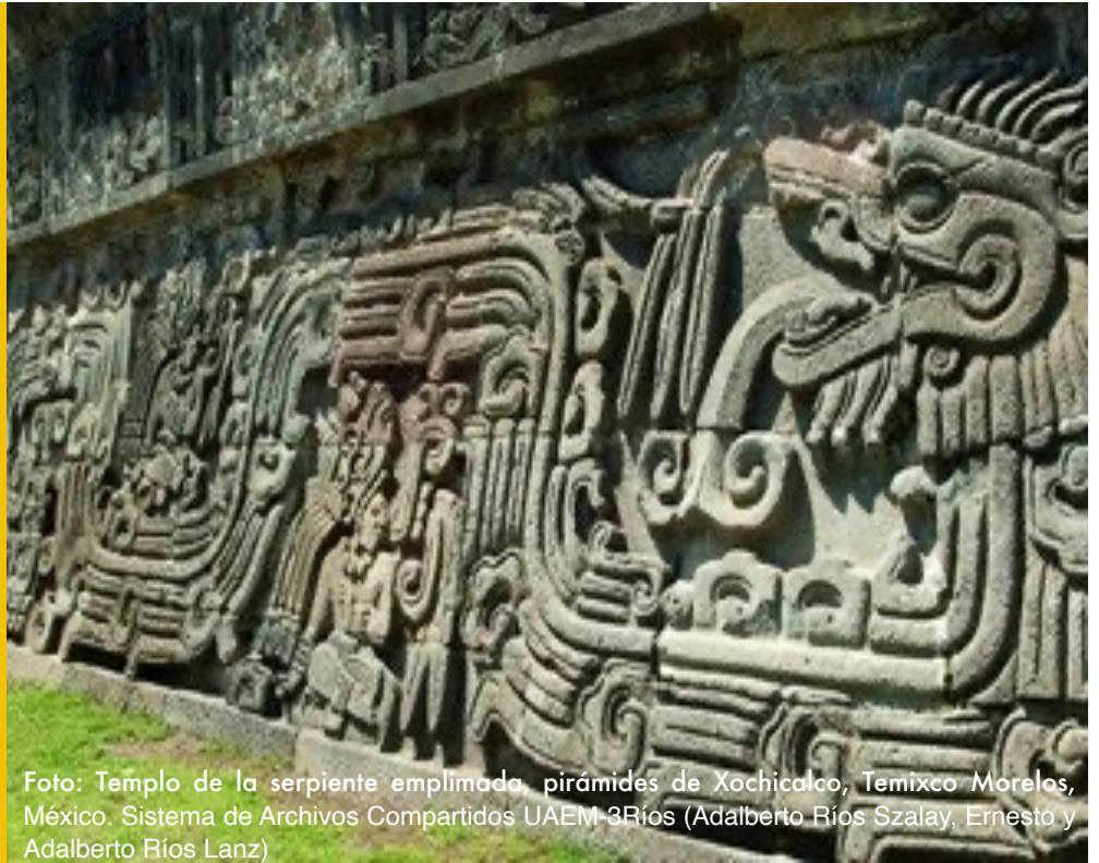
Foto: Templo de la serpiente emplumada, pirámides de Xochicalco, Temixco Morelos, México.

"Puede encontrar muchos ejemplos en línea cómo los museos están adaptando sus actividades para mantenerse en contacto con sus comunidades."