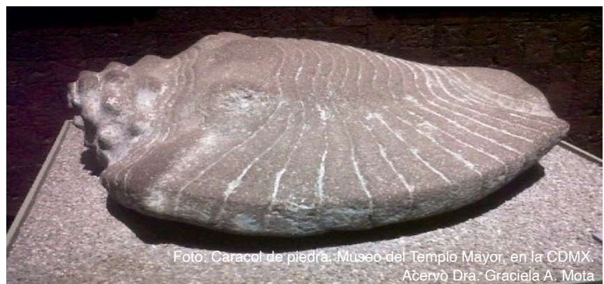
Foto: Caracol de piedra, Museo del Templo Mayor, en la CDMX.

Puede ser innovador y probar cosas nuevas, pero a veces las soluciones suelen ser muy simples, como por ejemplo, usar sus cuentas de redes sociales existentes para crear conciencia sobre las medidas de prevención de salud o los peligros que se incrementan por difundir noticias falsas (fake news).