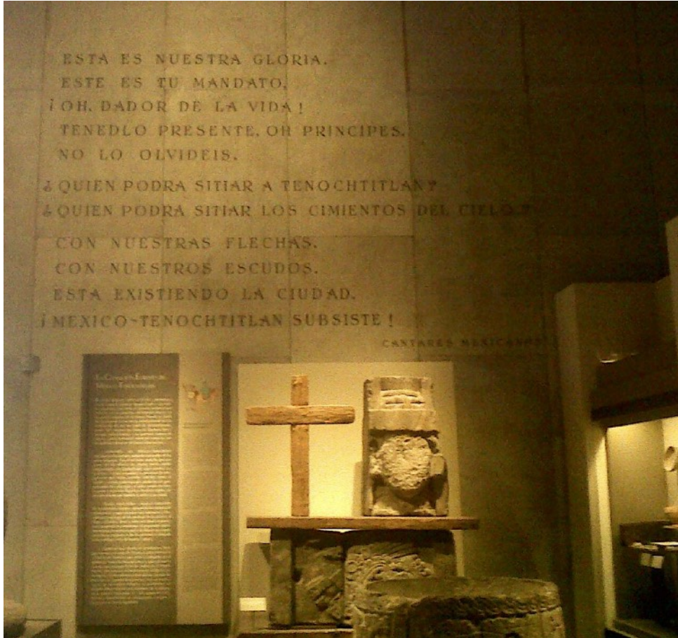
Foto: Cantares Mexicanos, Museo Nacional de Antropología, CDMX. Acervo Dra. Graciela A. Mota

NEMO publicó los resultados de su encuesta y una colección de ejemplos de iniciativas de museos en Europa.