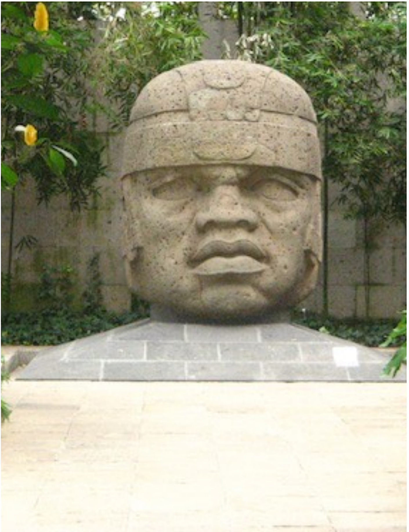
Foto: Gran cabeza Olmeca, Museo de Antropología de Xalapa, Xalapa Veracruz, México. Acervo Dra. Graciela A. Mota.