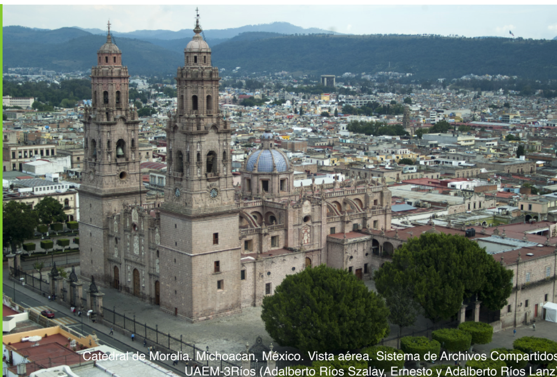
Catedral de Morelia. Michoacán, México. Vista aérea.