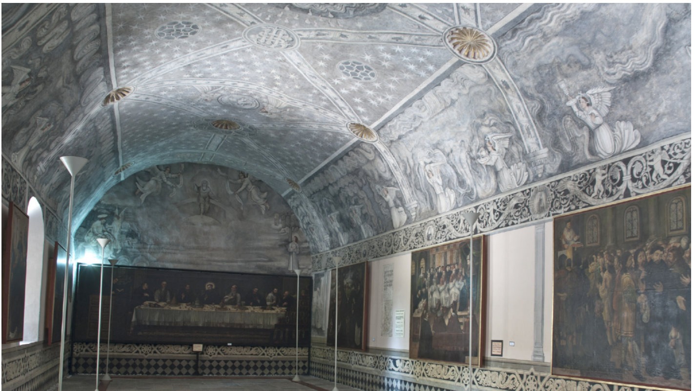
Pinacoteca convento San Agustín.

disposición de los restos humanos, lo que constituye un patrimonio cultural inmaterial de igual importancia y una de las manifestaciones de la diversidad cultural que han acompañado al género humano desde tiempos muy remotos y seguirán acompañándolo hasta su extinción.