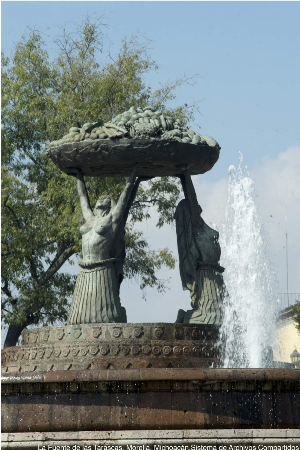
La Fuente de las Tarascas, Morelia, Michoacán.

Los sitios, monumentos, conjuntos, elementos, usos y costumbres funerarios integran una gama amplia de tipos y manifestaciones de patrimonio material e inmaterial: