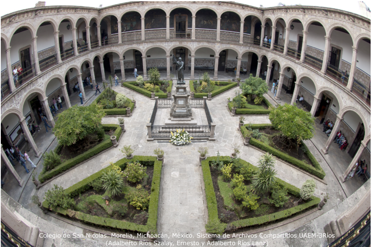
Colegio de San Nicolás. Morelia, Michoacán, México. Sistema de Archivos Compartidos UAEM-3Ríos (Adalberto Ríos Szalay, Ernesto y Adalberto Ríos Lanz)

A las tumbas se les ha revestido de varias formas artísticas como pueden ser los epitafios con diferentes pasajes literarios, esculturas acordes a la religión que en vida se profesó, y formas un tanto “paganas” como obeliscos y diferentes columnas.