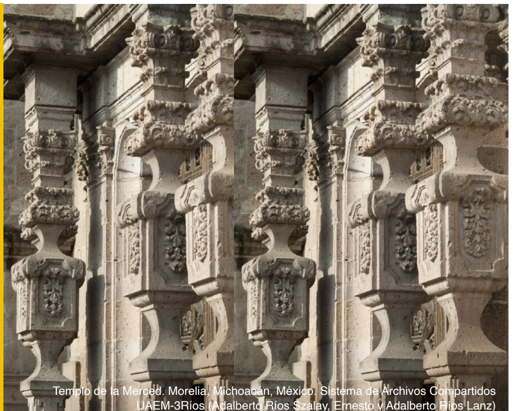
Templo de la Merced. Morelia, Michoacán, México.

Los sitios, monumentos, conjuntos, elementos, usos y costumbres funerarios integran una gama amplia de tipos y manifestaciones de patrimonio material e inmaterial