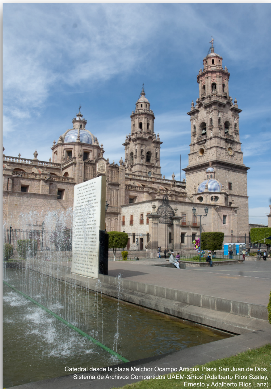
Catedral desde la plaza Melchor Ocampo Antigua Plaza San Juan de Dios.

Las bellas tumbas y mausoleos, son un homenaje a la vida del fallecido y representan también el status social y económico