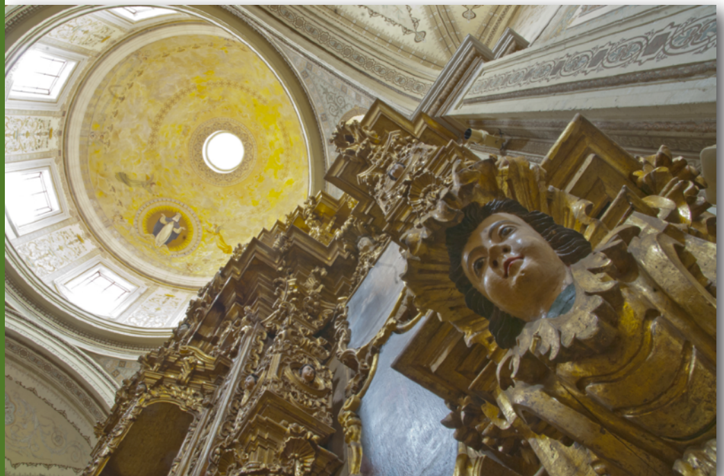
Templo de Santa Rosa de Lima. Morelia, Michoacán, México.

El listado de los diferentes problemas con usos y manifestaciones.