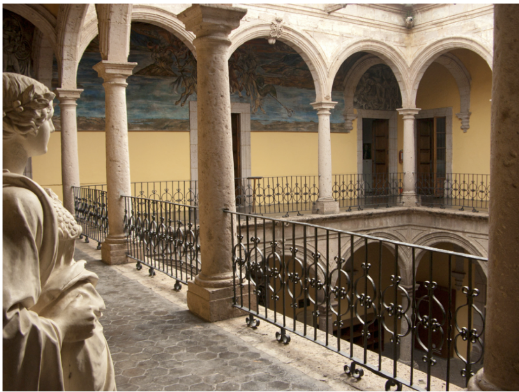
Foto: Arcada del Museo Regional Michoacano. Morelia, Michoacán, México.

Existen diferentes obstáculos para la adecuada preservación y uso social del patrimonio cultural funerario.