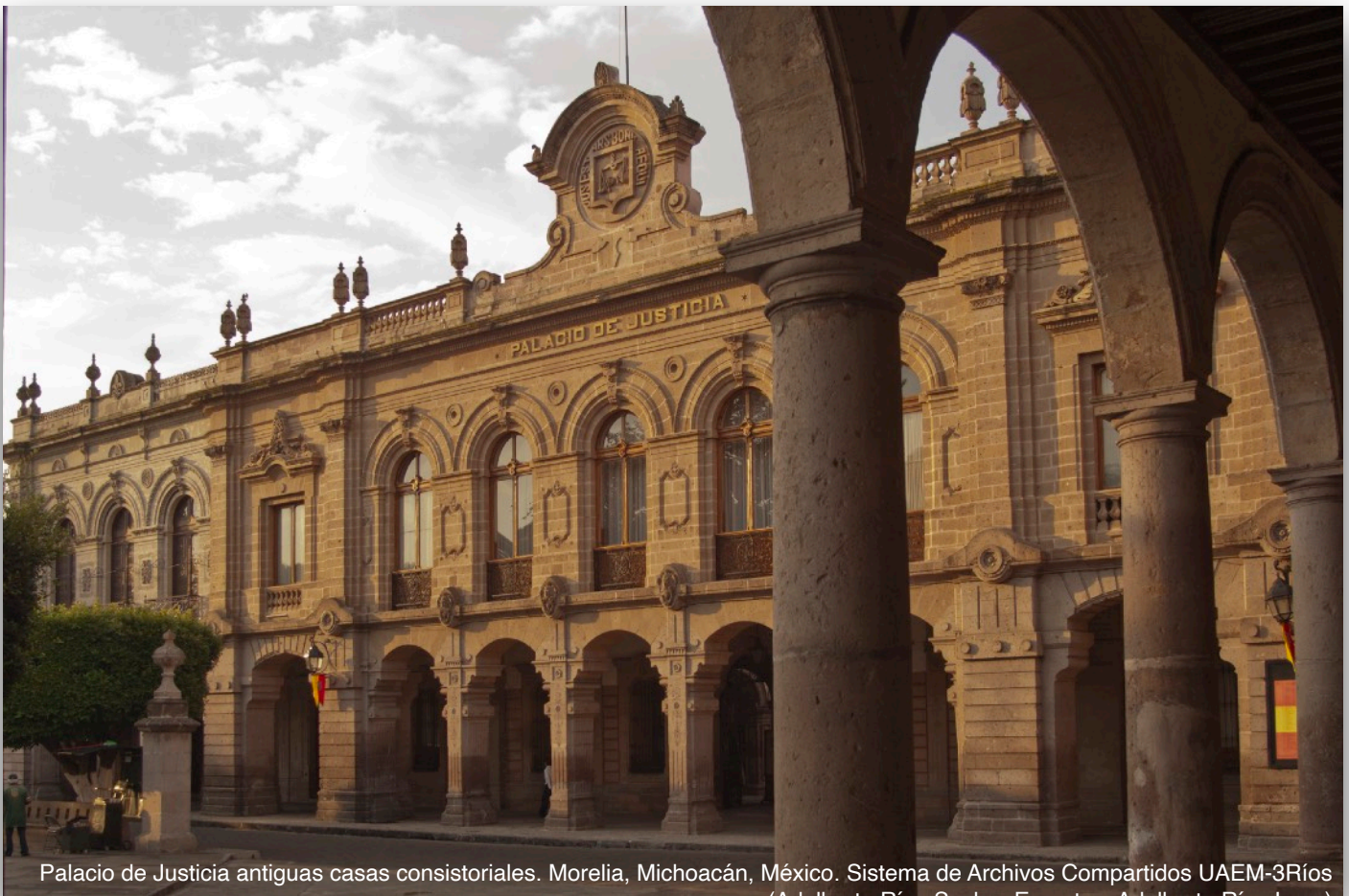
Palacio de Justicia antiguas casas consistoriales. Morelia, Michoacán, México.