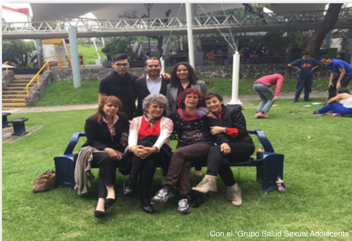
Con el "Grupo Salud Sexual Adolescente"

Como se puede apreciar los temas requieren un énfasis metodológico importante y trabajo más allá de las disciplinas, en el que me especializo desde hace 20 años.