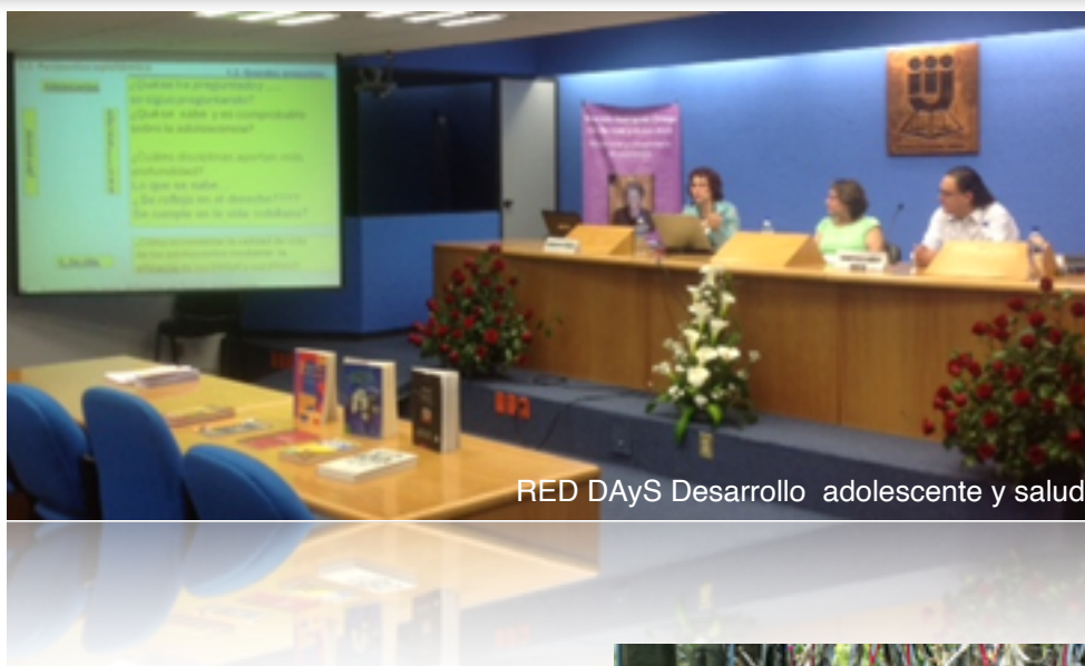
RED DAYs Desarrollo adolescente y salud