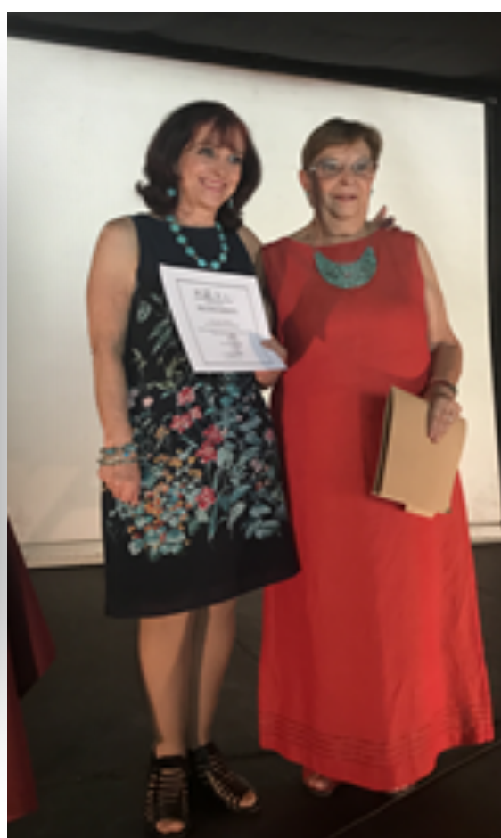
Ponencia 2018 Seminario de la Muerte