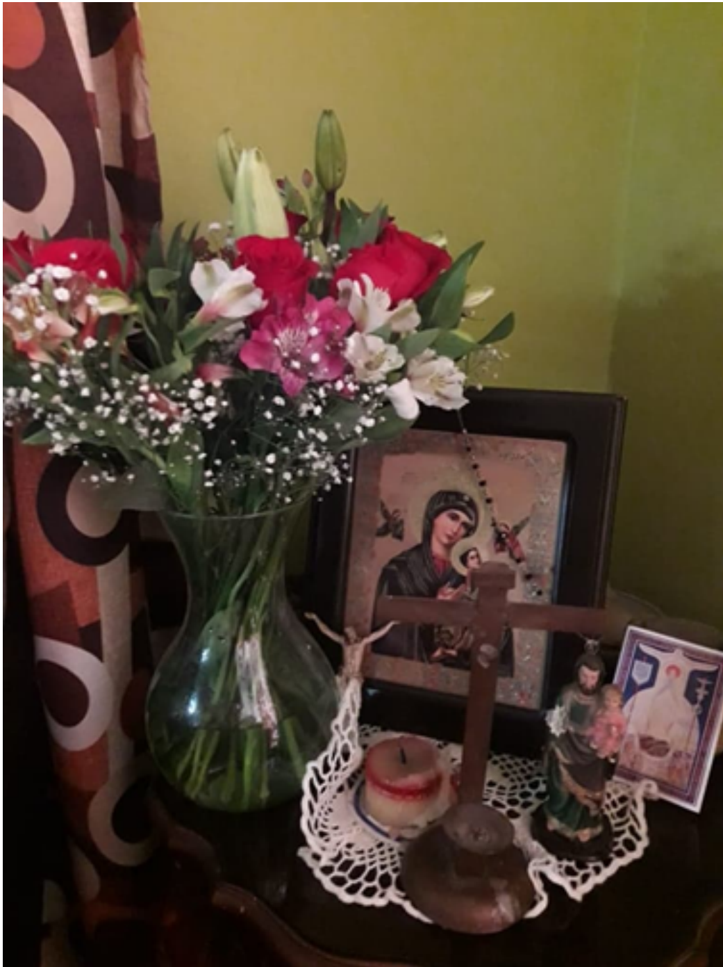
Fotografía tomada por Héctor Javier Sánchez Juárez, 2020.

El 32,3% de los entrevistados respondió que dice al menos un Ave María al despertar o antes de irse a dormir, mientras que el 38,7% respondió que lo dice en cualquier otro momento del día. También es de destacar que el 29% de los entrevistados suspenden su trabajo al mediodía (12:00) para rezar, ya sea solos o con sus compañeros, las oraciones del Ángelus o Regina Coeli .