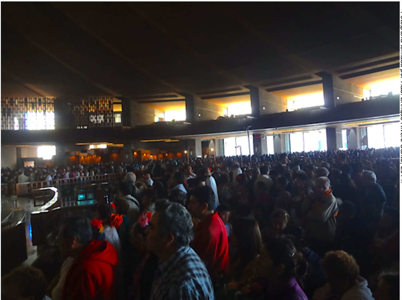
Fotografía tomada por Raúl Enrique Rivero Canto, 2014.