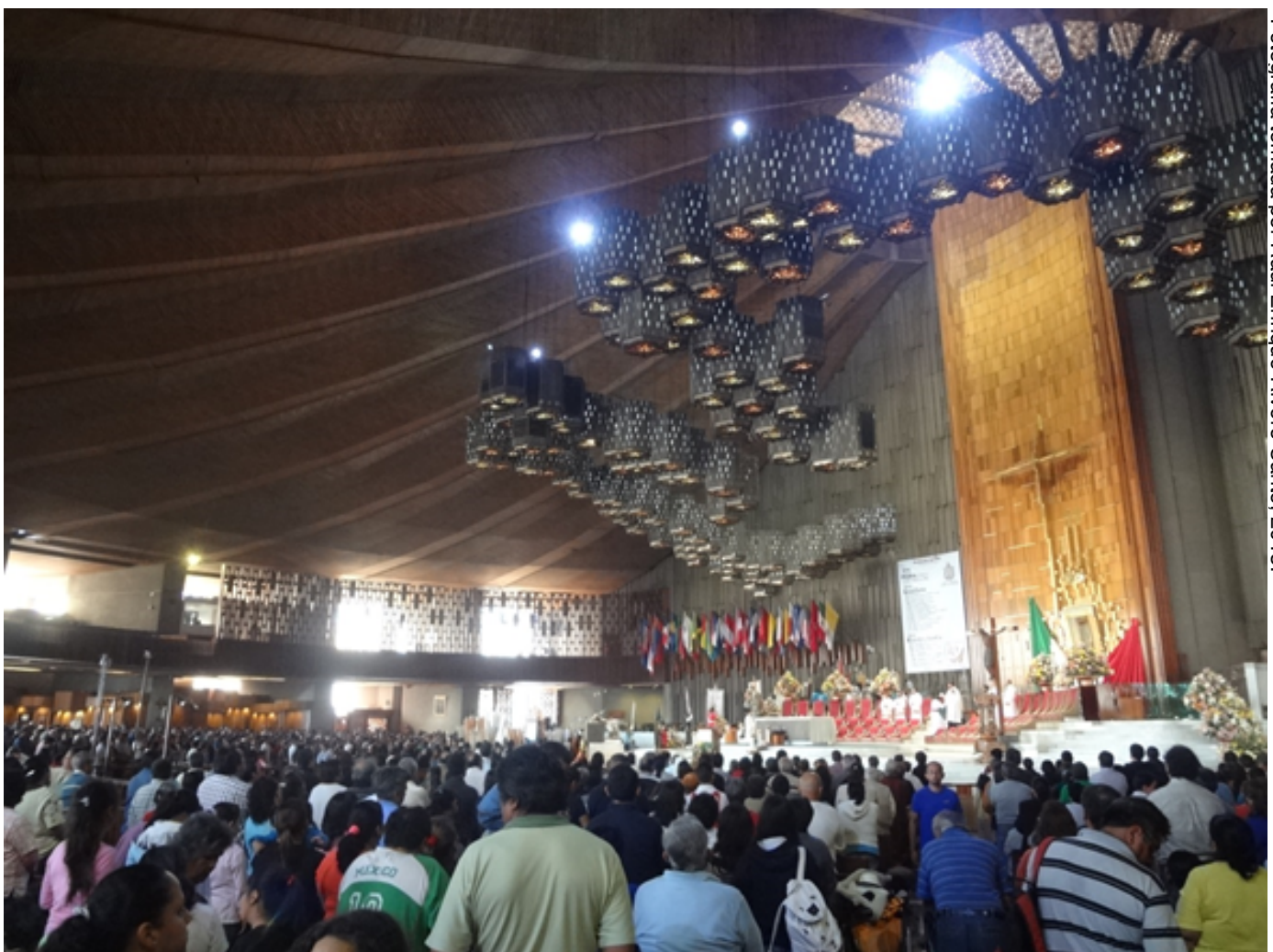
Fotografía tomada por Raúl Enrique Rivero Canto, 2013.

De esta manera vemos que la celebración del 12 de diciembre, día de Nuestra Señora de Guadalupe, no fue solo el deseo del pueblo, sino que fue un evento oficial.