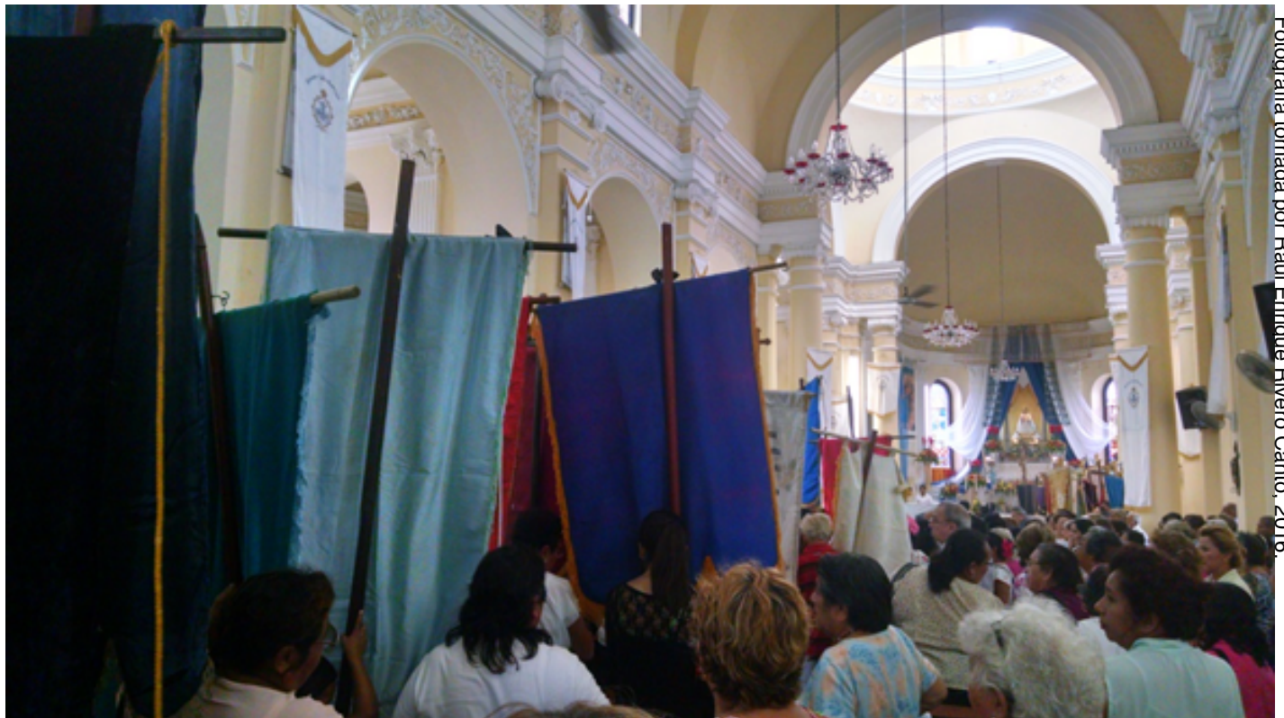
Fotografía tomada por Raúl Enrique Rivero Canto, 2016.