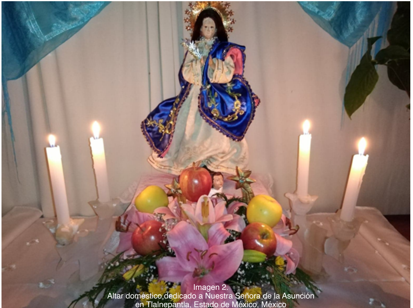
Fotografía tomada por Humberto Raí Ramírez Jiménez, 2020.