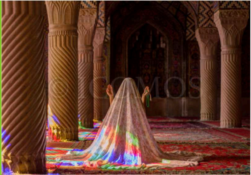
Photo: Patrimoine religieux, mosquée Nasir Ol Molk à Shiraz. Vue intérieure de la mosquée, Shiraz, Iran, Ramin Rahmani Nejad Asil.