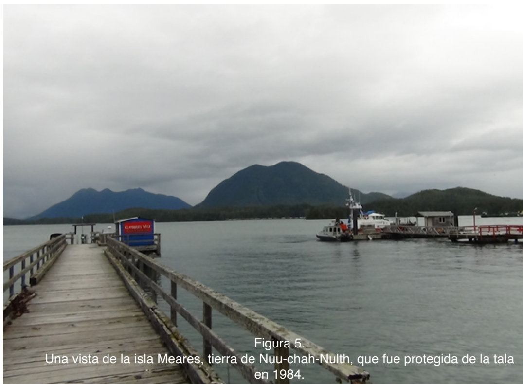
Figura 5. Una vista de la isla Meares, tierra de Nuu-chah-Nulth, que fue protegida de la tala en 1984.

El concepto de Parques Tribales es significativo porque casi la totalidad de esta provincia nunca fue entregada por pueblos indígenas y gran parte de ella está actualmente bajo reclamos de tierras. Los reclamos de tierras en Canadá se caracterizan como la búsqueda legal de territorios ancestrales o en disputa por parte de pueblos indígenas. Decididos a proteger los territorios tradicionales y al mismo tiempo mantener la afirmación continua de la soberanía y la ley indígenas, los Parques Tribales permiten que los aborígenes asuman un papel de liderazgo en la administración de las áreas protegidas en sus propias tierras.