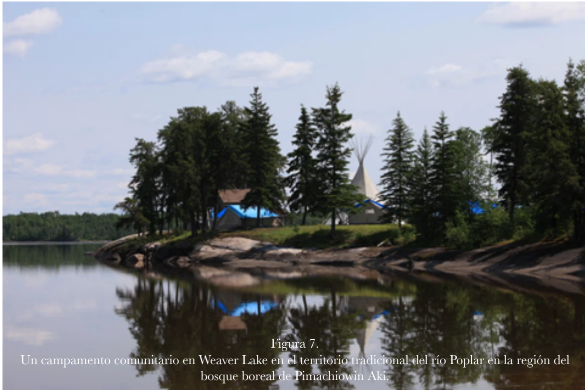
Figura 7. Un campamento comunitario en Weaver Lake en el territorio tradicional del río Poplar en la región del bosque boreal de Pimachiowin Aki.