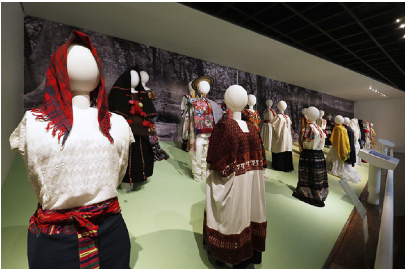
Exposición Rebozo. Museo de Arte Popular. Ciudad de México. https://www.cultura.cdmx.gob.mx/storage/app/uploads/public/5f8/8c4/0ae/5f88c40ae0681707714556.jpg

No hay señalética para los temblores, inundaciones, manifestaciones violentas en vía pública para las PcD (Población con Discapacidad), no hablemos de contenidos y personal especializado, ni hablar de talleres, ni servicios educativos, es una población en abandono TOTAL.