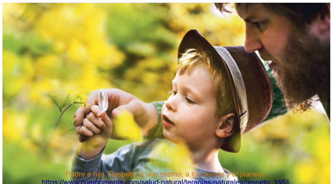
Padre e hijo. Respeto a uno mismo, a los demás y al planeta. https://www.cuerpomenta.com/salud-natural/terapias-naturales/respeto_1551

La modificación tendrá que ser radical, tendremos que cambiar el "nosotros" por los "otros".