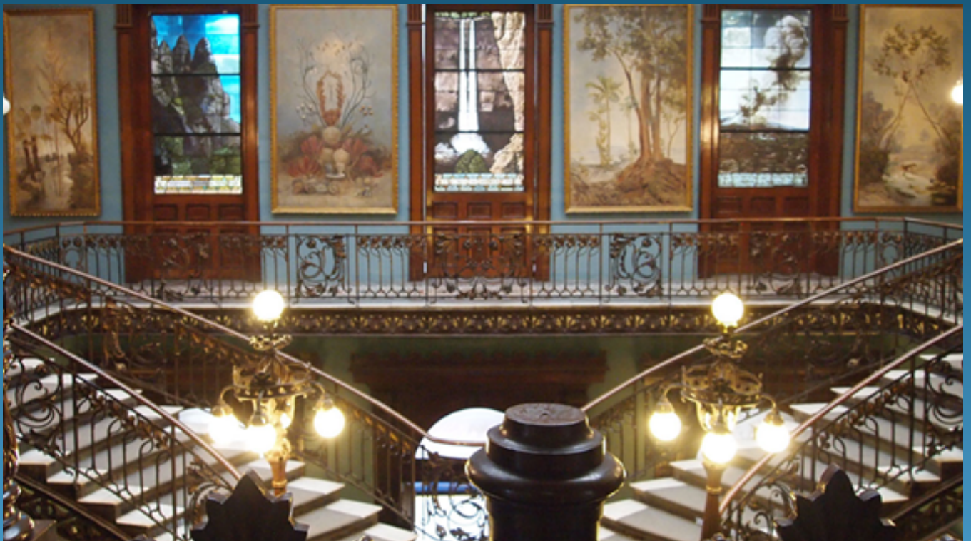
Interior del Museo Universitario de Geología.