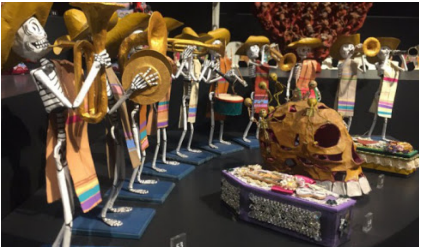
Exposición de Talleres con tema de Día de Muertos. Museo de Arte Popular. Ciudad de México, México. http://cdmxtravel.com/es/lugares/talleres-del-museo-de-arte-popular.html

Los objetivos y retos a resolver, el cómo se enfrentarían y resolverían esos retos fueron funciones tan importantes como el mirar al pasado.