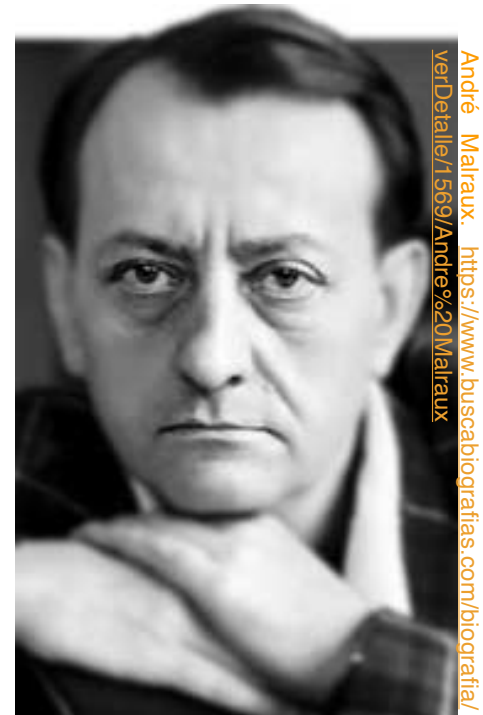
André Malraux. https://www.buscabiografias.com/biografia/verDetalle/1569/Andre%20Malraux

Estamos ante la disyuntiva de proponer espacios no acotados, cumplir y mantener sus espacios y sumar propuestas incluyentes, de herramientas que no solo cuenten o interpreten la historia, de espacios que no se divorcien del público al abandonar los muros museísticos, el gran reto es poder generar utensilios que convivan y cuestionen constantemente al usuario, dentro o fuera del museo, de métodos que se encuentren