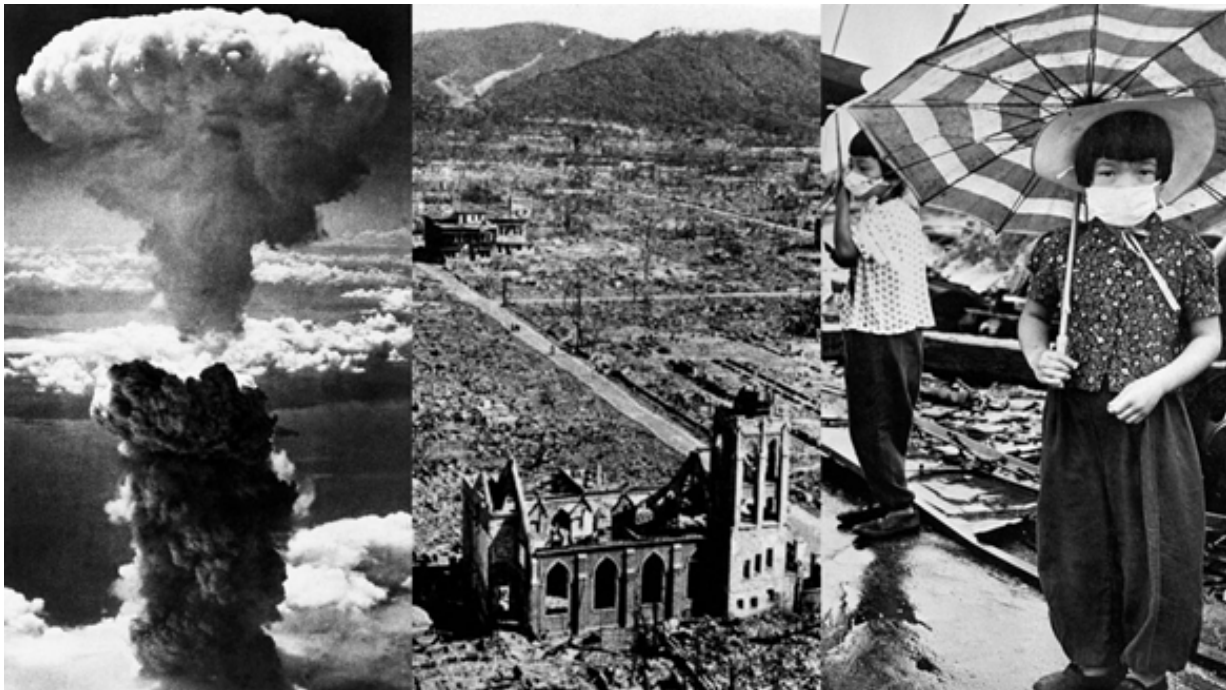
Imágenes de Hiroshima y Nagasaki después de la bombas nucleares.

El 26 de Abril de 1986 a las 1:24 a.m., hace 33 años, sufrimos el mayor desastre nuclear de la historia, una explosión equivalente a 500 bombas atómicas como la de Hiroshima, generando una estela de muerte y contaminación radioactiva que no desaparecerá en mucho tiempo, dejando una secuela de deformaciones en las generaciones que nacieron posterior a ese desastre, a la mutación de animales y plantas, a un daño a terceros incalculable... seres vivos que a pesar de encontrarse a miles de kilómetros de distancia, se han visto afectados con enfermedades y deformaciones, afectando a seres humanos, fauna y flora... sin embargo, ni siquiera eso nos hizo reaccionar.