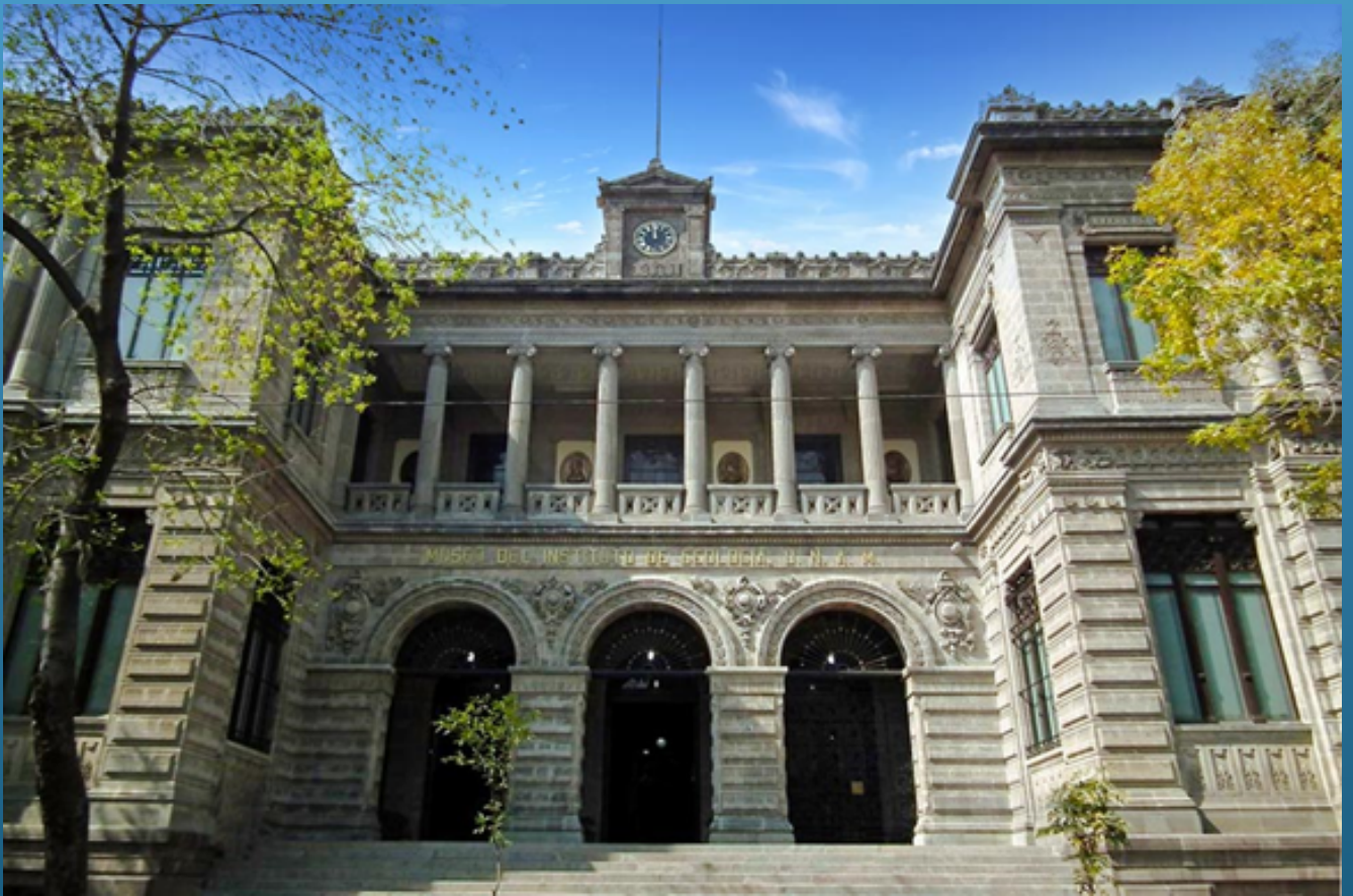
Exterior del Museo Universitario de Geología.