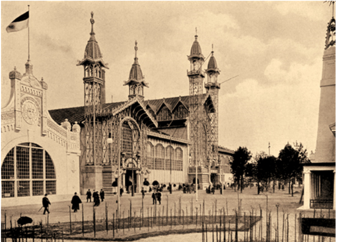
Museo Universitario del Chopo, 1975. Ciudad de México, México. https://www.gaceta.unam.mx/museo-universitario-del-chopo-45-difundiendo-cultura/

¡La urgencia para concientizar a la población del daño generado al planeta! ¡la necesidad imperiosa de proteger a la única casa de todos! Nuestra querida...tierra... ¡nunca tan amenazada y con tantos frentes abiertos como en los actuales días!