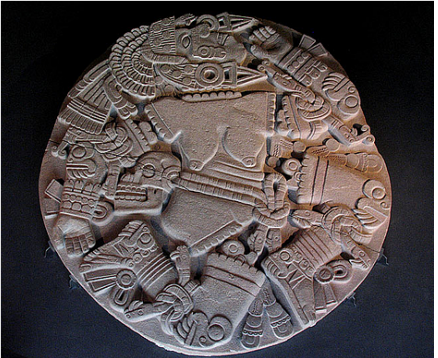
La Diosa de la Luna Coyolxauhqui. Museo del Templo Mayor. Ciudad de México, México.

Todos nos hemos visto afectados por la situación generalizada de la pandemia...obligando a estos espacios a adaptarse a las circunstancias y condiciones de esta epidemia, que ha condicionado la salud pública, la convivencia social y obviamente la economía glocal.