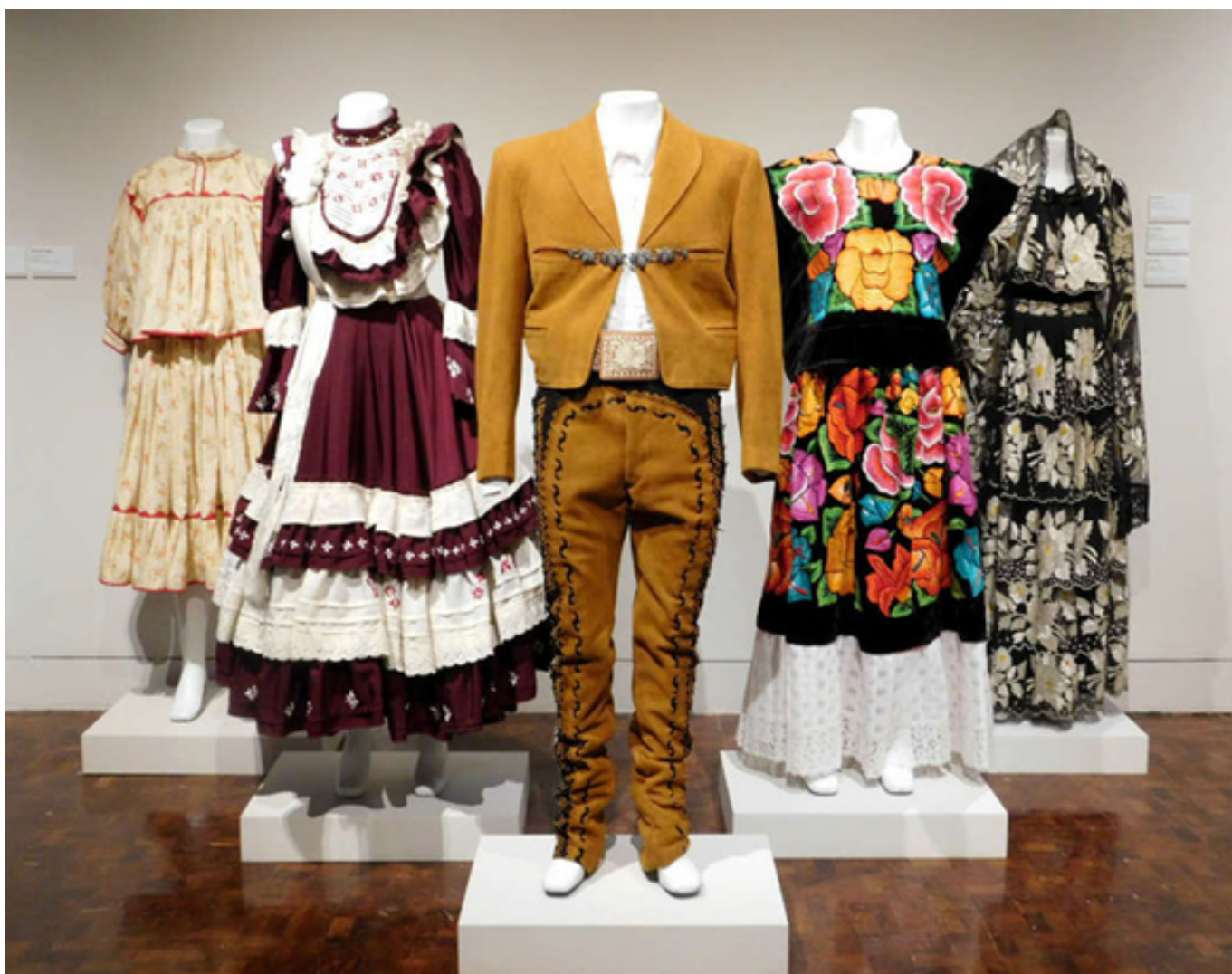
Exposición México Téxtil. Museo de Arte Popular. Ciudad de México, México. https://caminandoplaciudad.jimdofree.com/2018/04/30/m%C3%A9xico-textil-exposici%C3%B3n-del-museo-arte-popular/