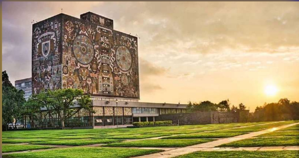
Ciudad Universitaria, Ciudad de México, México.