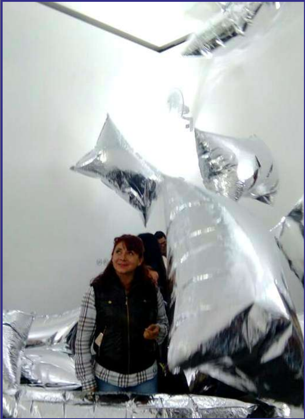
Museo Soumaya en la Ciudad de México, México