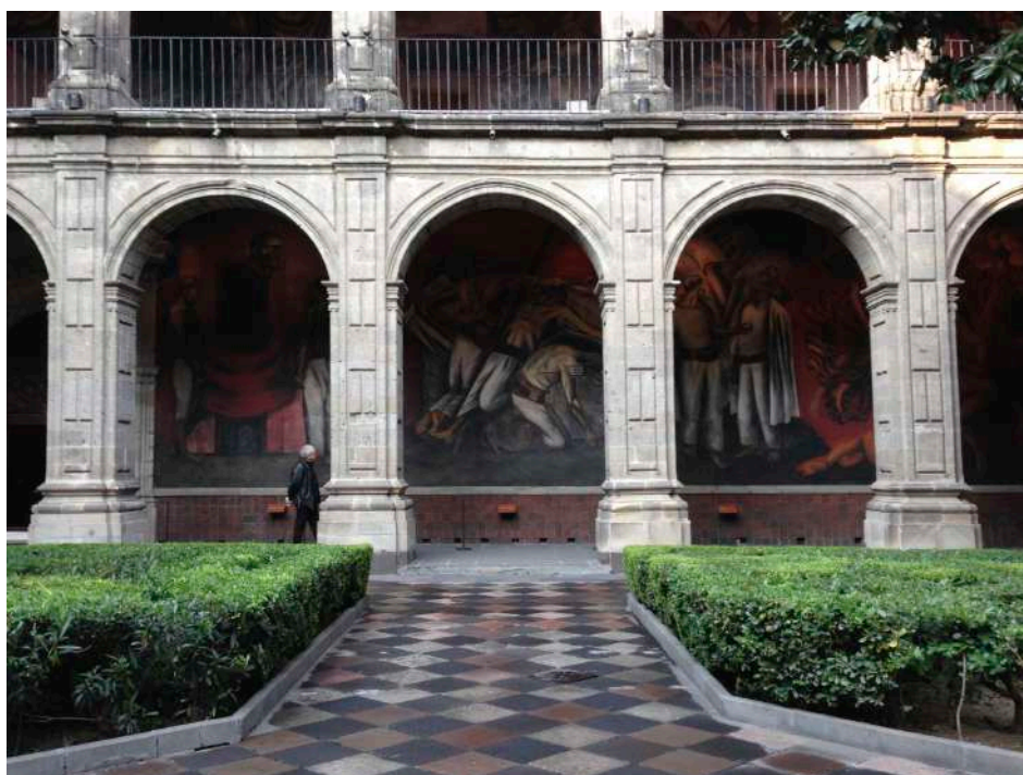
Patio Edificio del Antiguo Colegio de San Ildefonso, Ciudad de México.

"Nos comprometemos a promover, según corresponda, el empleo pleno y productivo, el trabajo decente para todos y las oportunidades de subsistencia ... "