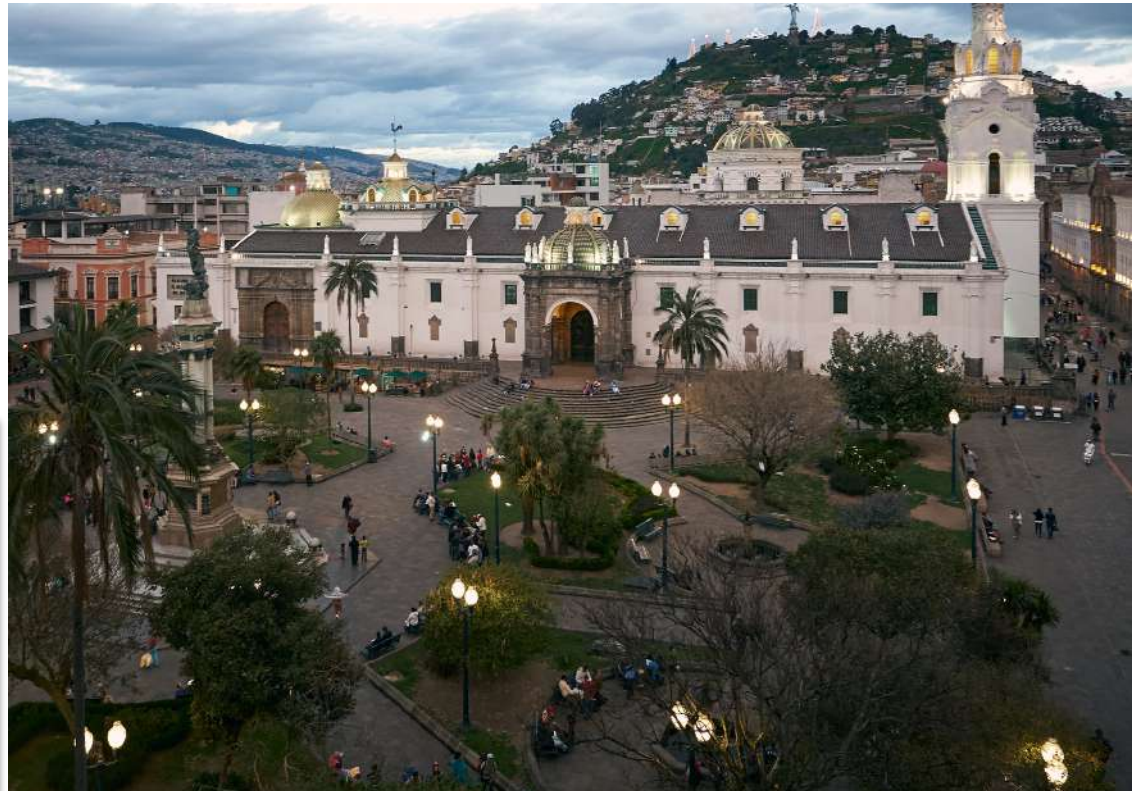
Foto 20: Plaza de la Independencia, Quito. Foto de Pedro Szekely, 2018

Será necesario el compromiso activo de todos los ciudadanos, Gobiernos y grupos para garantizar la implementación de la Nueva Agenda Urbana y la realización de sus principios.