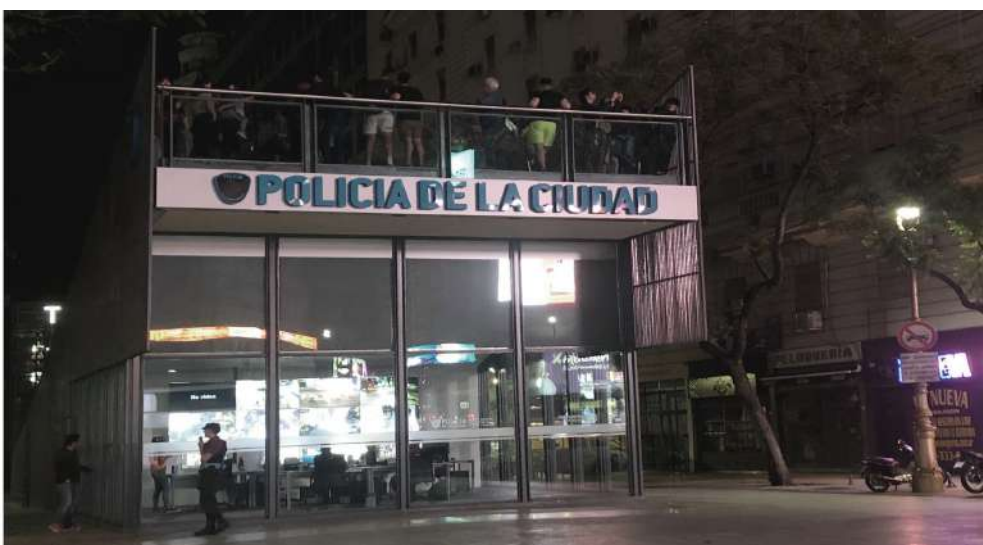
Foto 18: Módulo de vigilancia policial en el centro de Buenos Aires, Argentina. Se aprecia cómo el módulo policial funge como mirador urbano.

"...Fomentaremos la creación, promoción y mejora de plataformas de datos abiertas, ..."