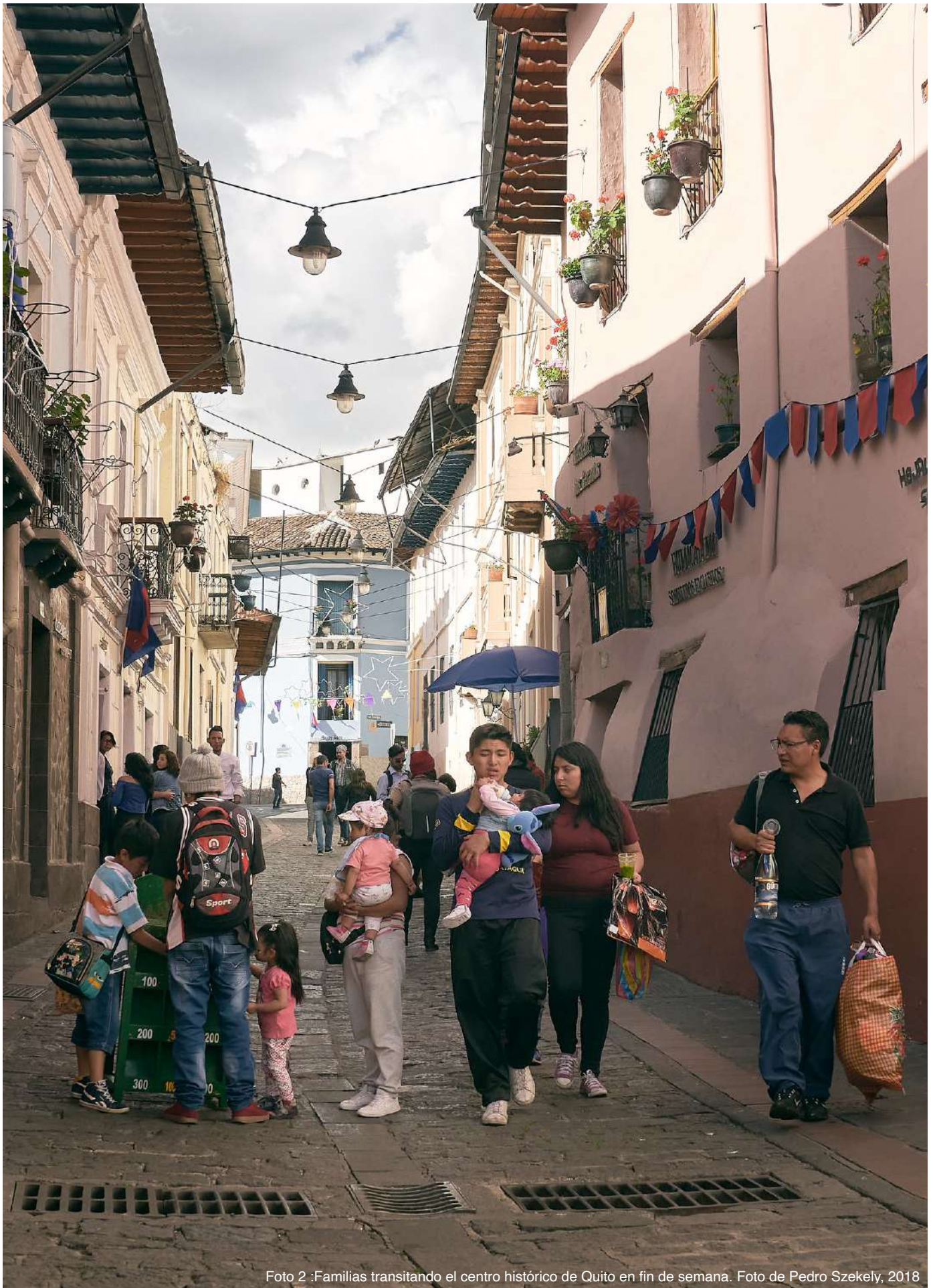
Foto 2 :Familias transitando el centro histórico de Quito en fin de semana.