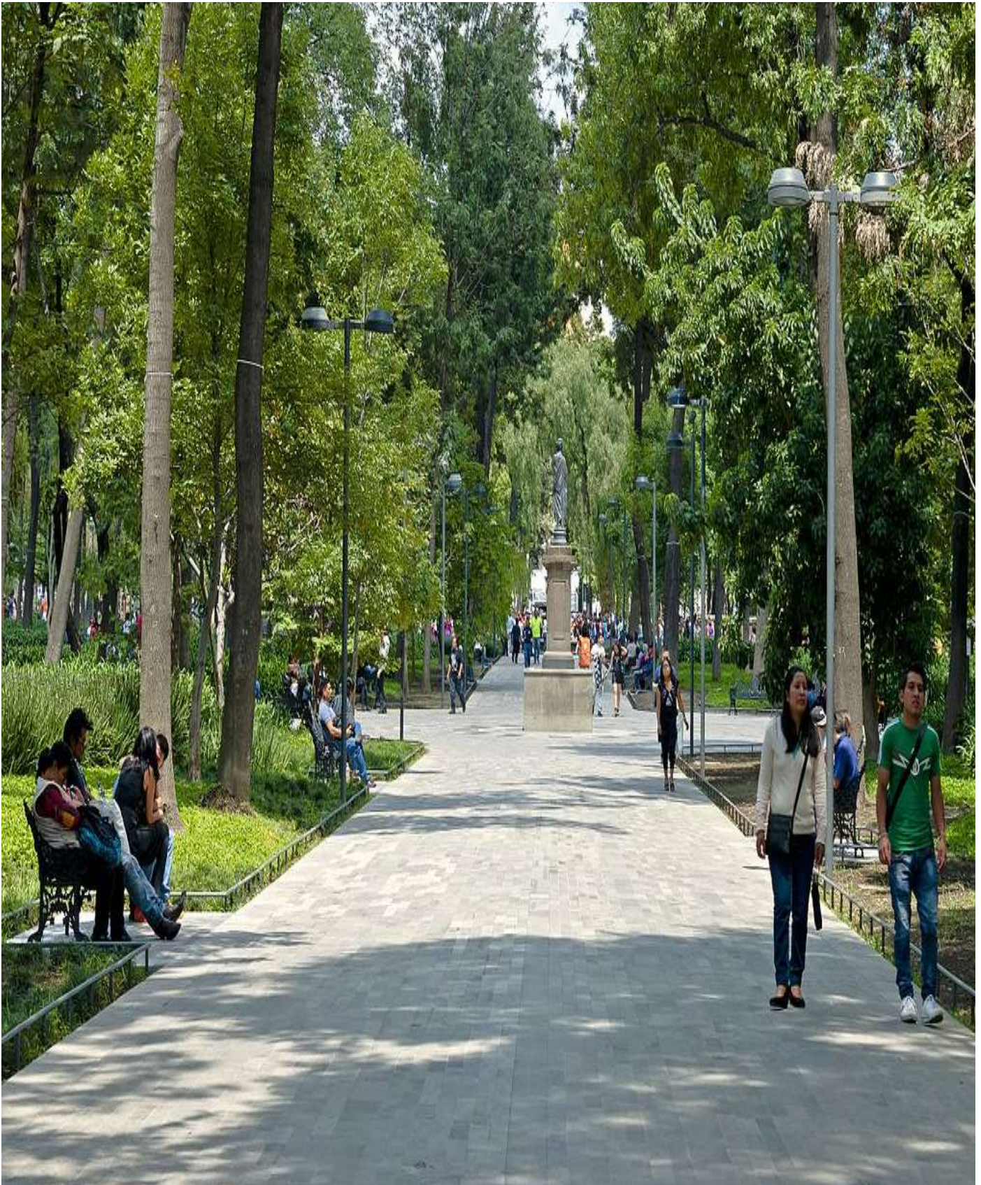
Foto 5: Alameda Central, Ciudad de México, México.