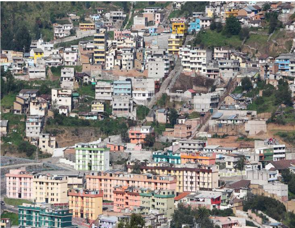
Foto 3: Asentamiento urbano en la periferia de Quito, Ecuador. El modelo de crecimiento urbano tradicional promueve la desigualdad en contextos Latinoamericanos.

"... es necesario aprovechar las oportunidades que presenta la urbanización como motor impulsor de un crecimiento económico ..."