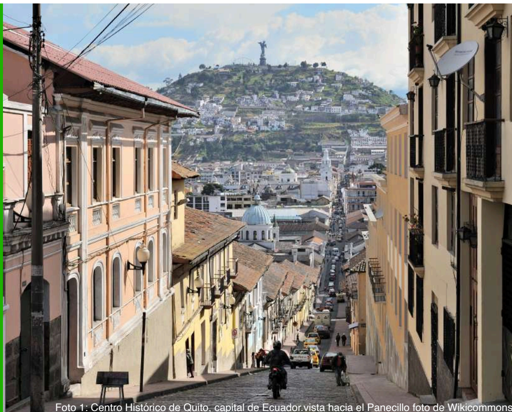
Foto 1: Centro Histórico de Quito, capital de Ecuador.vista hacia el Panecillo