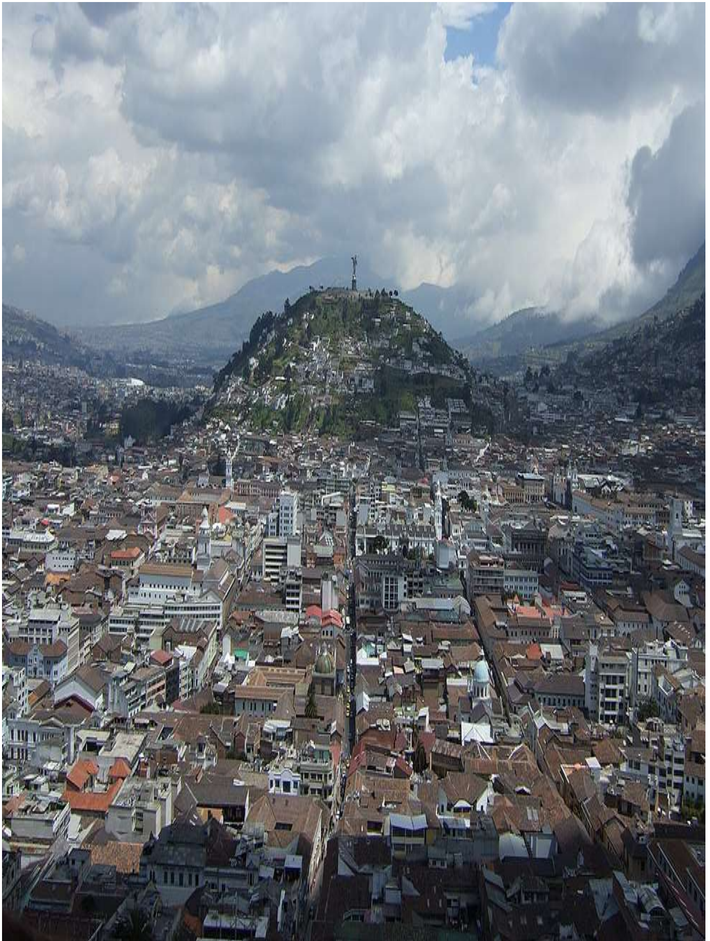
Foto 4: Vista aérea de Quito, Ecuador. Resalta la manera en que se extiende la mancha urbana.