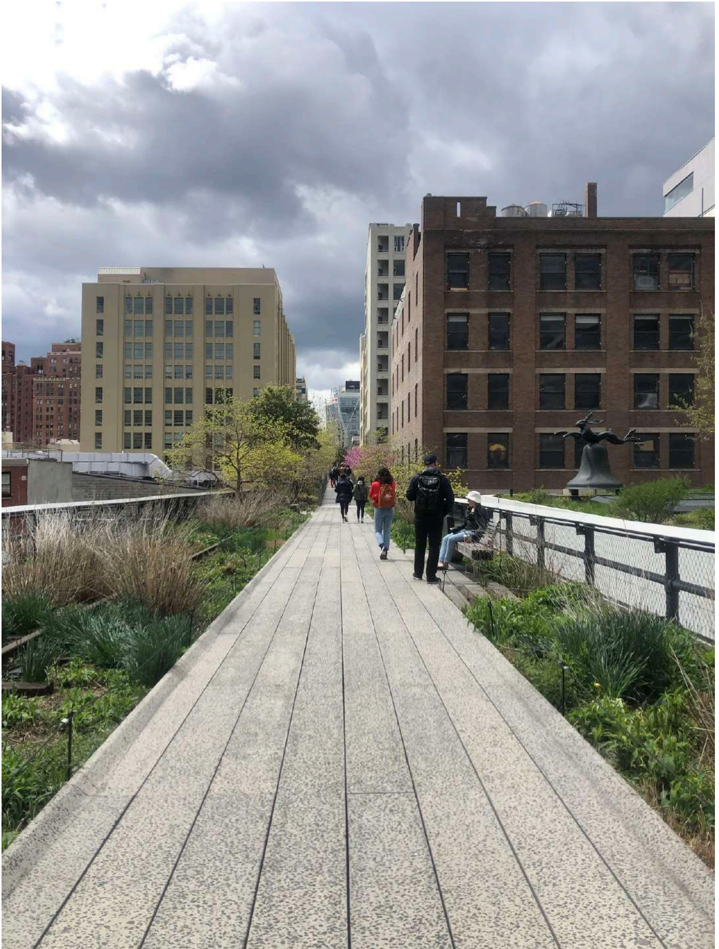
Foto 15: Highline Nueva York, Estados Unidos. Aprovechamiento de infraestructura en desuso.