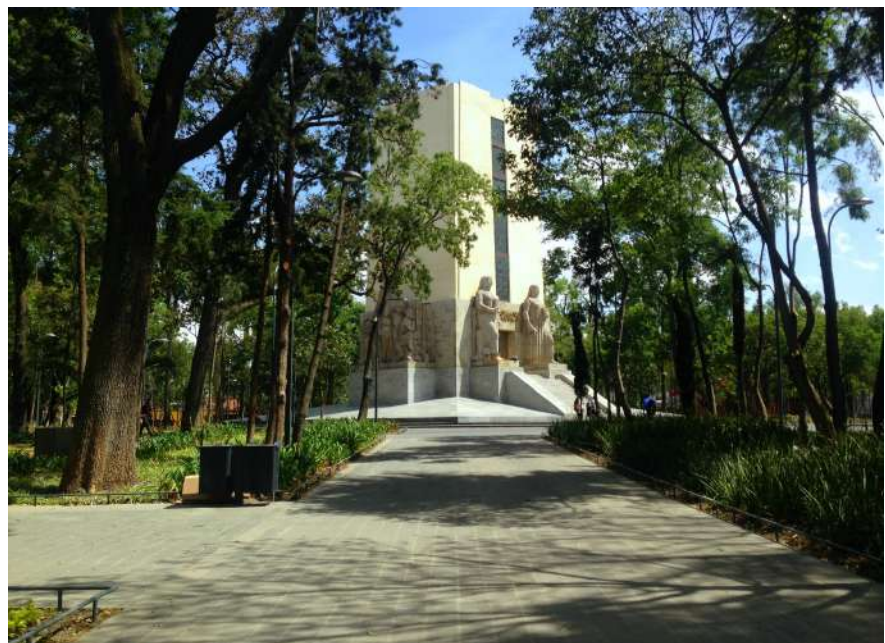
Foto 8: Parque de la Bombilla, Ciudad de México.

"Nos comprometemos a promover medidas adecuadas en las ciudades y los asentamientos humanos que faciliten el acceso de las personas con discapacidad, ... "