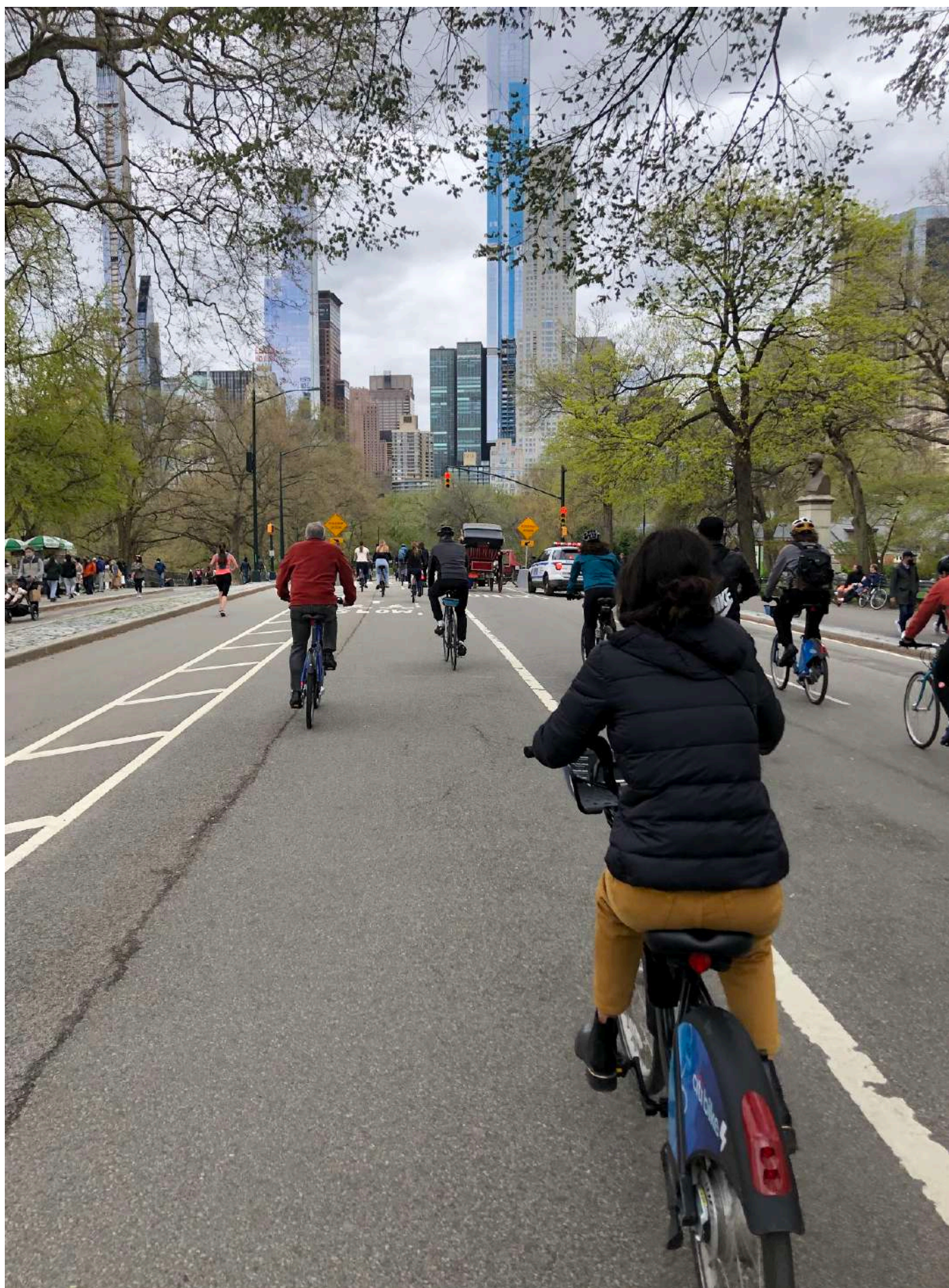
Foto 14: Movilidad sostenible en Nueva York, Estados Unidos.