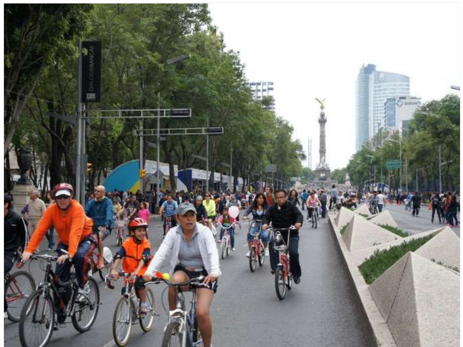
Foto 7: Paseo ciclista en la avenida Reforma, Ciudad de México.

"Nos comprometemos a asegurar el pleno respeto de los derechos humanos de los refugiados, los desplazados internos y los migrantes, ... "