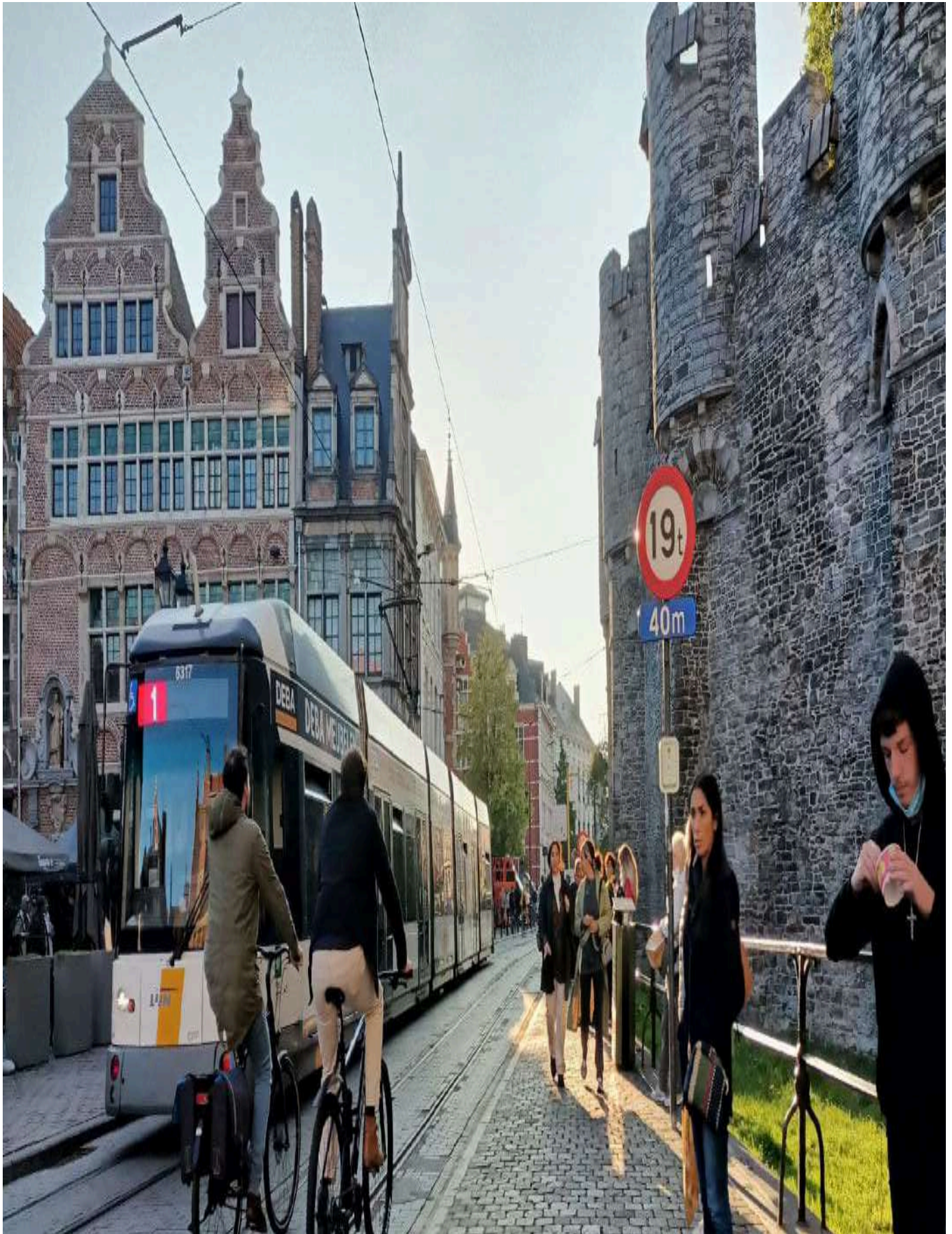
Foto 13: Nuevo plan de movilidad en el Centro Histórico de Gante, Bélgica.