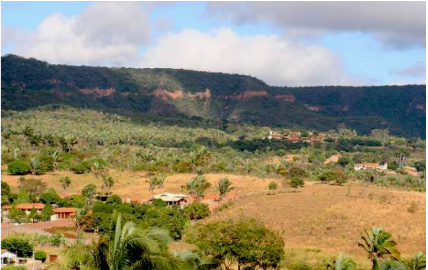
Figura 2. La Chapada de Araripe.

Según Viana y Neumann, Litológicamente, está compuesto por estratos calizos horizontales, intercalados con esquistos, limolitas y areniscas, depositados durante el Cretácico Inferior (unos 120 millones de años) y es un importante yacimiento de calizas, actualmente explotado para la industria del cemento y las rocas ornamentales. (1999, p. 113, nuestra traducción 5 )