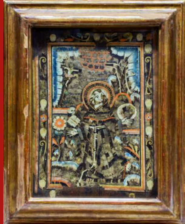
San Pedro y San Francisco en éxtasis

Amanteca por identificar de tradición purépecha Segunda mitad del siglo xvii | Mosaico de plumas (colibrí, canario, gorrión y pato) y mucílago de orquídea sobre lámina de cobre batido; pan de oro | 40.5 x 28.5 cm | reproducción autorizada por el instituto nacional de antropología e historia, secretaria de cultura.-inah.-mg.-mex | Fotografía: Ángel de Jesús Saucedo Enríquez | Museo de Guadalupe, INAH