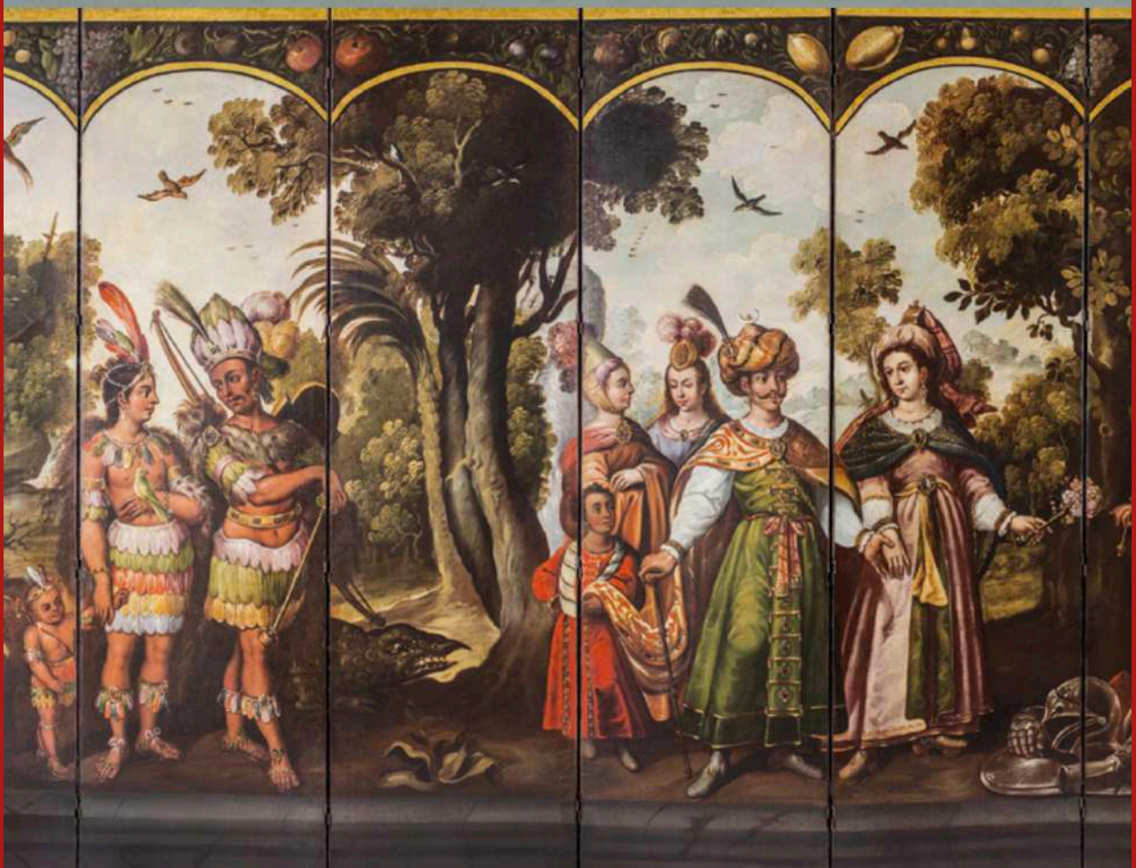
Las cuatro partes del mundo

Juan Correa (México, hacia 1646 – 1716) Biombo de diez hojas | c 1700-1730 | Óleo sobre lienzo. Bisagras de hierro con cuero remachado en los cantos de cada hoja. Reverso recubierto de textil rojo | Abierto: 203.5 x 563.5 x 2.9 cm. Cerrado: 203.5 x 56.5 x 33.8 cm. Por hoja, de izquierda a derecha: Hoja 1: 203.5 x 57 x 2.9 cm. Hoja 2: 203.5 x 56.5 x 2.8 cm. Hoja 3: 203.4 x 55.7 x 2.7 cm. Hoja 4: 203 x 55.5 x 2.7 cm. Hoja 5: 203.2 x 56 x 2.9 cm. Hoja 6: 202.9 x 55.7 x 2.7 cm. Hoja 7: 203 x 56 x 2.7 cm. Hoja 8: 203.2 x 55.9 x 2.9 cm. Hoja 9: 203 x 56.1 x 2.7 cm. Hoja 10: 203.2 x 56.3 x 2.8 cm | Museo Soumaya.Fundación Carlos Slim | 4263