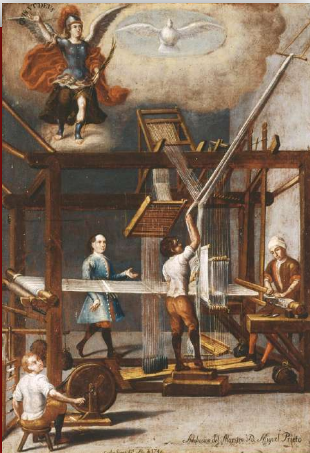
Interior de un obraje con la presencia protectora del Espíritu Santo y el arcángel san Miguel

Por su parte, la tradición civil, en su complejo y fascinante mosaico racial, echó mano de sarapes, rebozos, chupas, calzas, verdugados, fichús, encajes y accesorios para ver y ser visto. Los cuadros de castas, uno de los grandes prodigios de la escena virreinal, nos permiten el acceso al entorno íntimo y cotidiano del Siglo de las Luces.