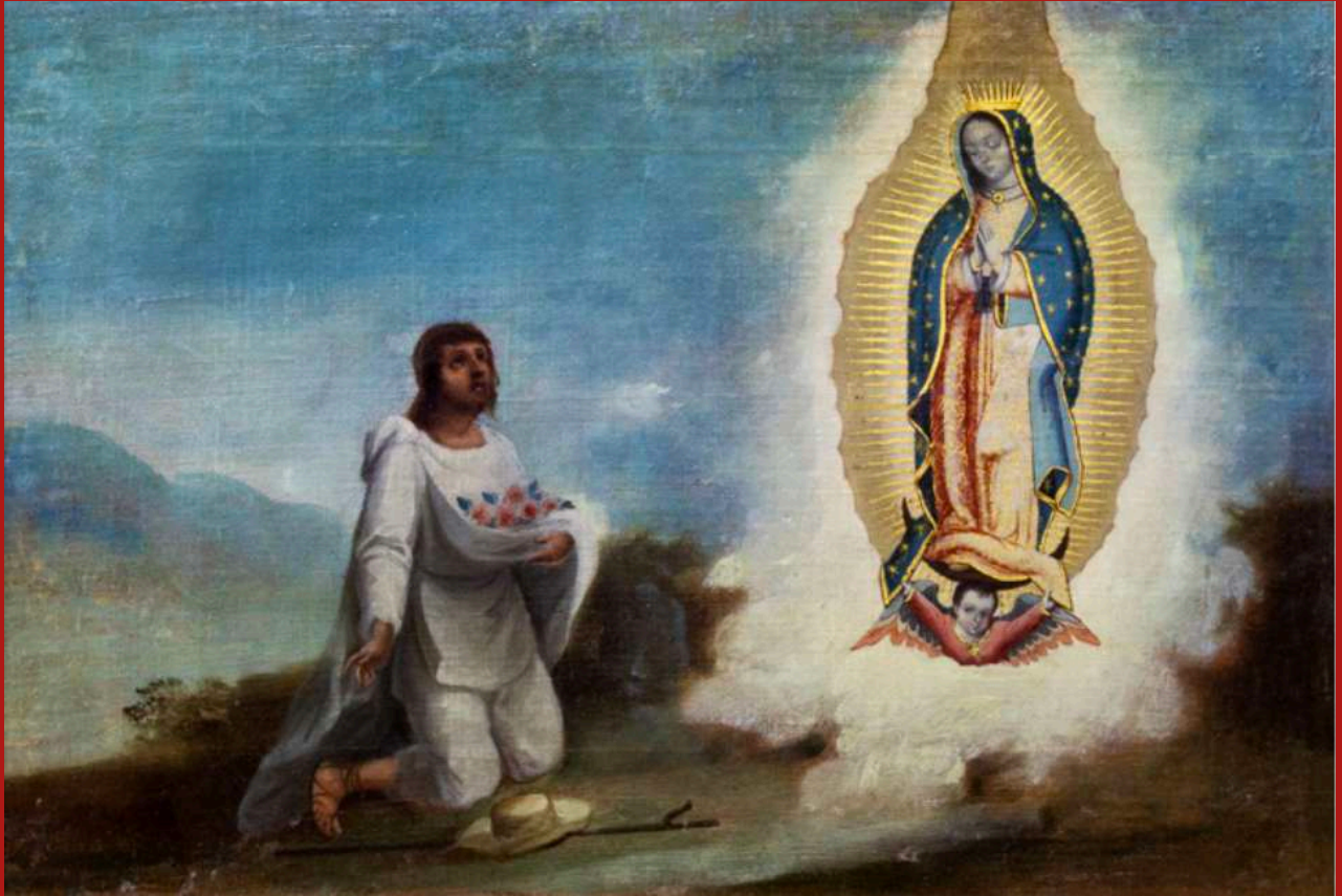
La aparición en el Tepeyac Autor novohispano por identificar Segunda mitad del siglo xviii | Óleo sobre lienzo | 40.5 x 63 cm | reproducción autorizada por el instituto nacional de antropología e historia, secretaría de cultura.-inah.-mg.-mex | | Museo de Guadalupe, INAH