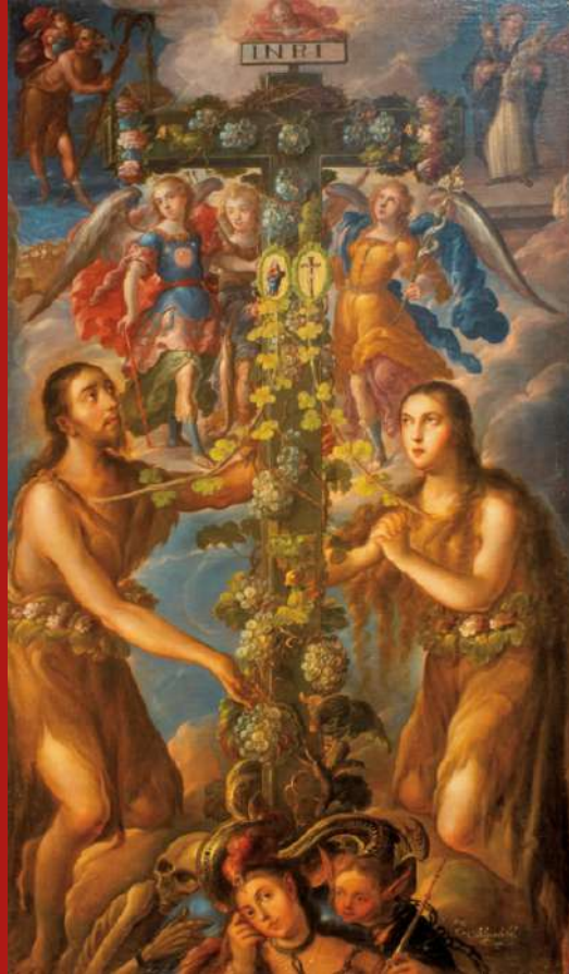
El Árbol de la vida

Frente al Árbol de la Ciencia, Eva toma el fruto prohibido e induce a Adán a desafiar a Dios. Es en este escenario donde, de acuerdo con el relato bíblico, la mujer deberá padecer los dolores del parto y el hombre, el cansancio del trabajo como expiación por su desacato. Será el ángel caído, causa e inspiración del supremo acto de soberbia, el que será condenado a vivir como sierpe... reptar y morder el polvo.