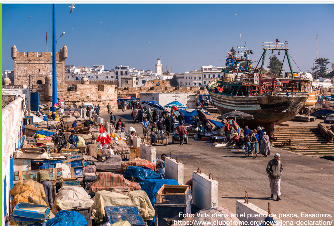
Foto: Vida diaria en el puerto de pesca, Essaouira. https://www.clubofrome.org/news/jena-declaration/