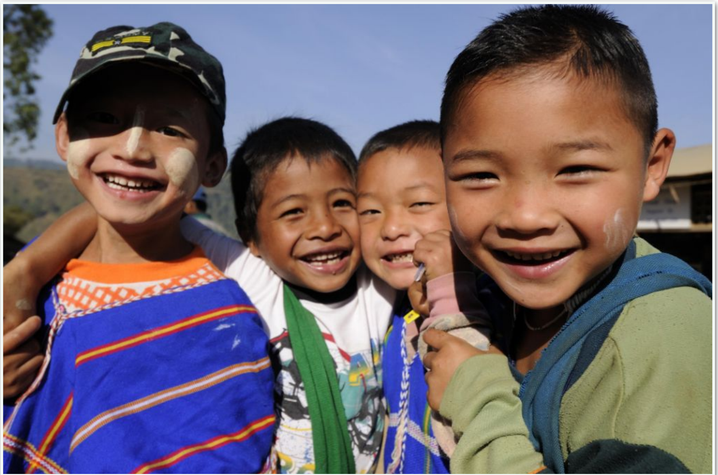
Foto: Celebración "Día Mundial de la Diversidad" 21 de mayo.

Esto implica un cambio radical de paradigma, que lejos de imponer estrategias de arriba hacia abajo de "talla única" evoluciona así hacia enfoques personalizados.