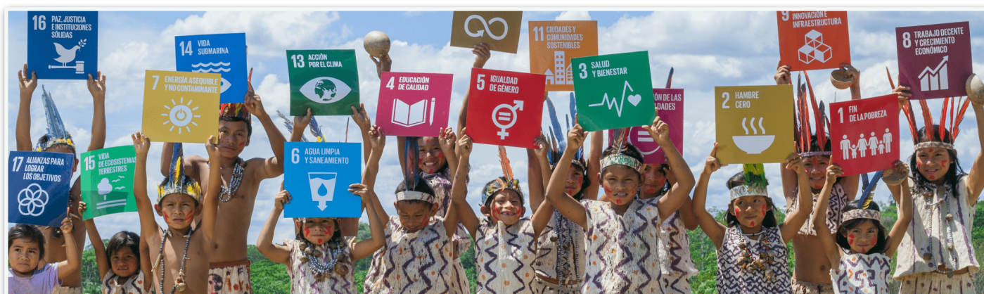
Foto: "La Agenda para el Desarrollo Sostenible" para llevar a cabo la década de acción de la ONU. https://www.un.org/sustainabledevelopment/es/development-agenda/