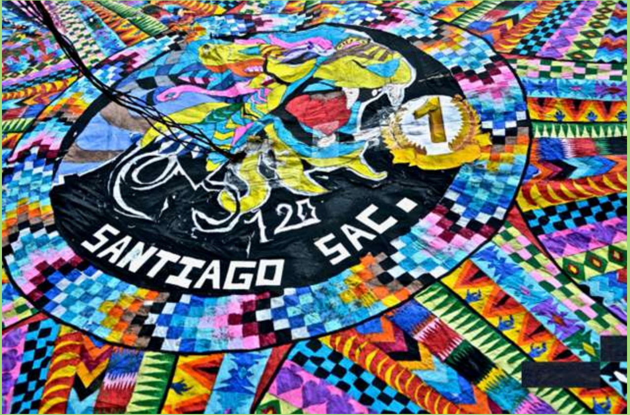
Ejemplo de colores, formas y figuras en Barriletes .