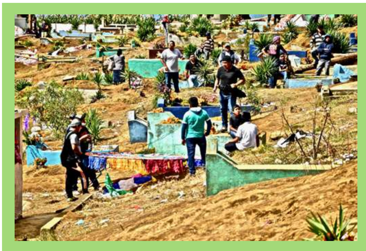
Familias en el panteón durante festival de Barriletes en Día de Muertos.