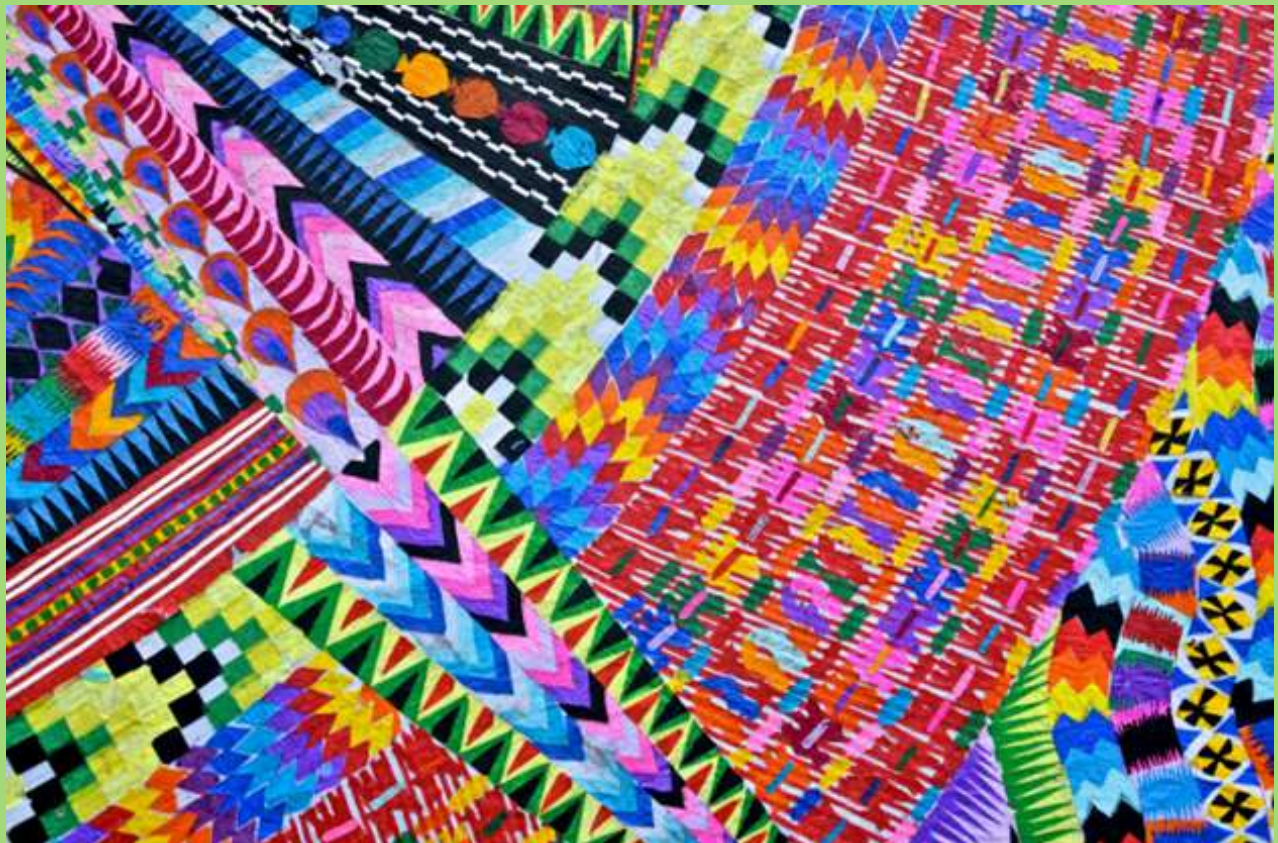
Ejemplo de colores, formas y figuras en Barriletes .