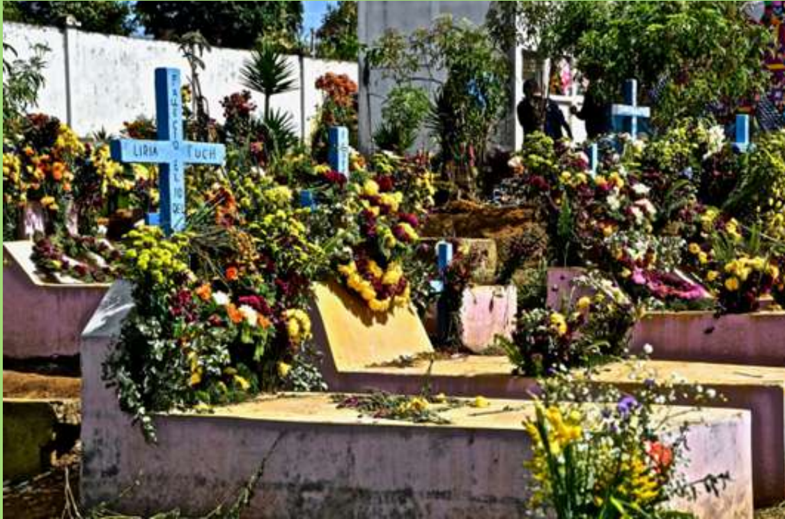
Tumba durante festival de Barriletes en Día de Muertos.