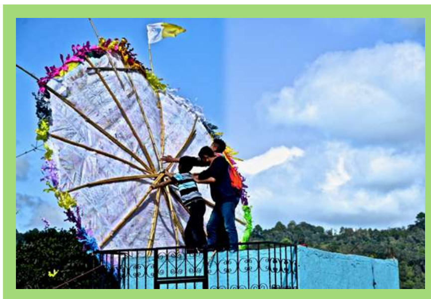
Niños apunto de volar Barrilete gigante.