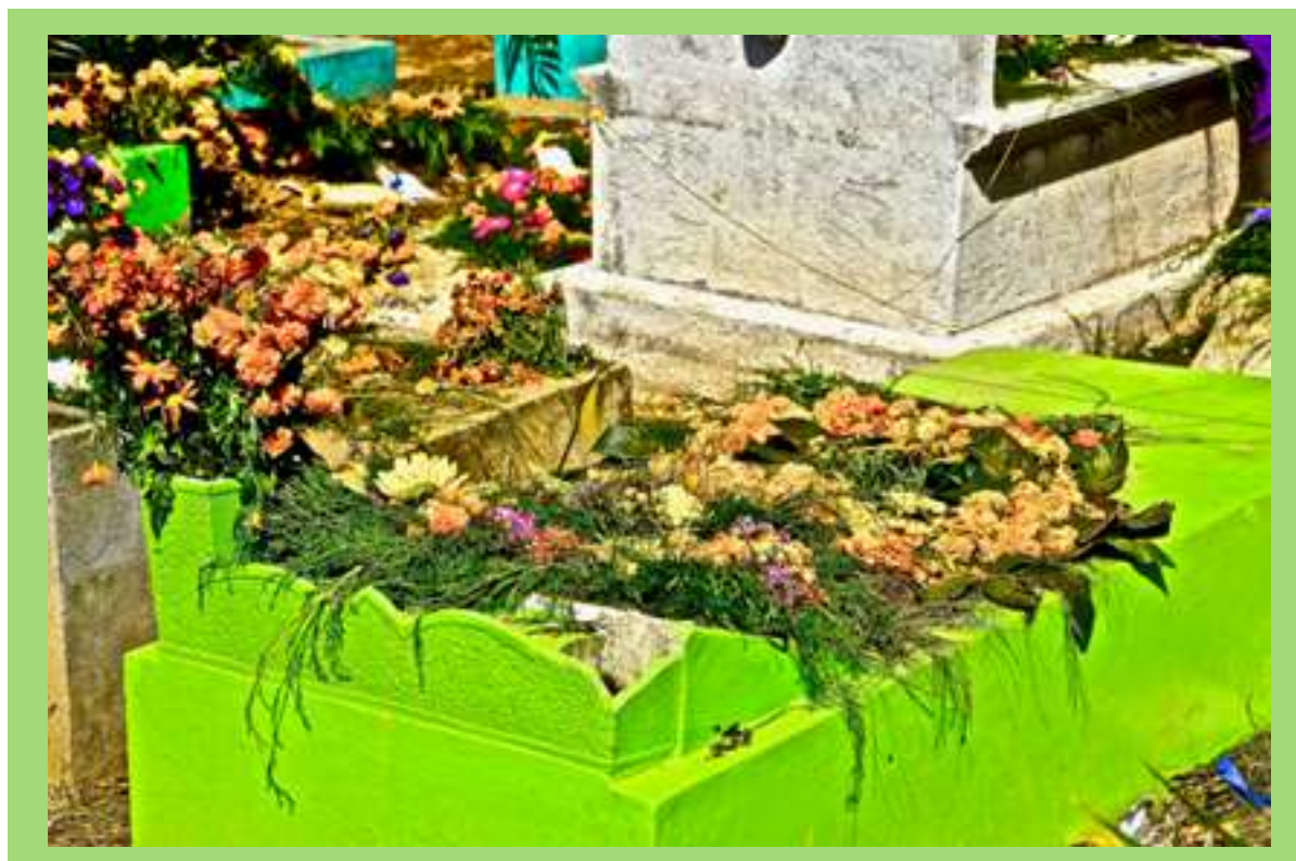
Tumba durante festival de Barriletes en Día de Muertos.