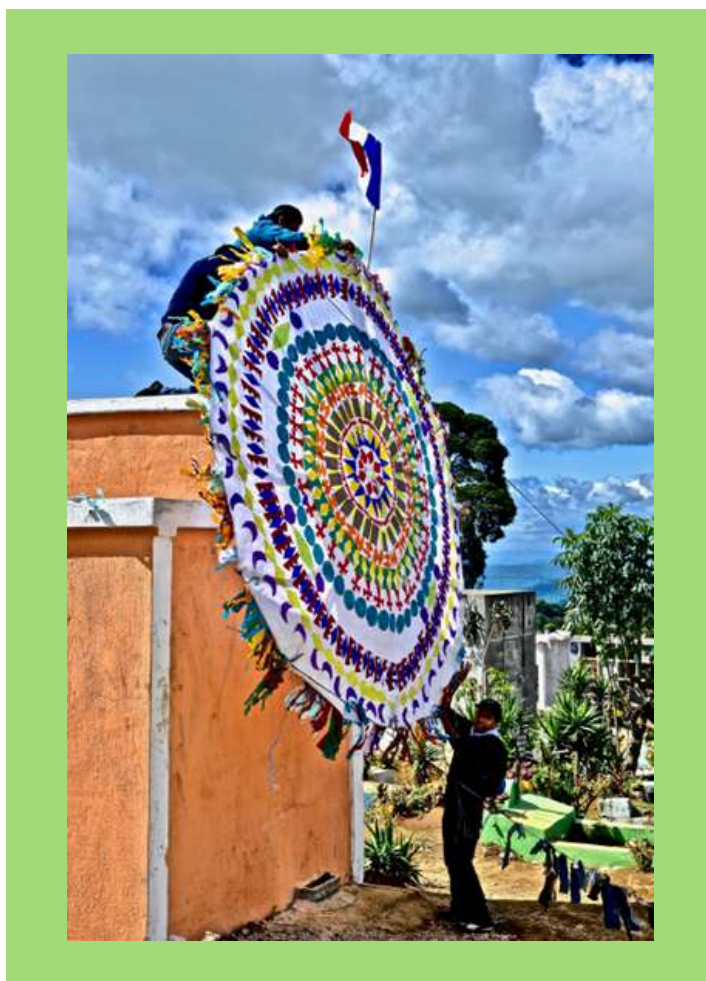
Hombres apunto de volar un Barrilete.