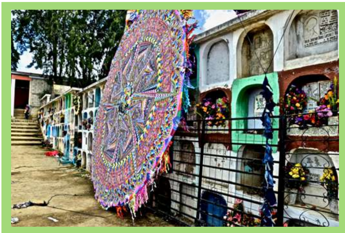
Barrilete en panteón.