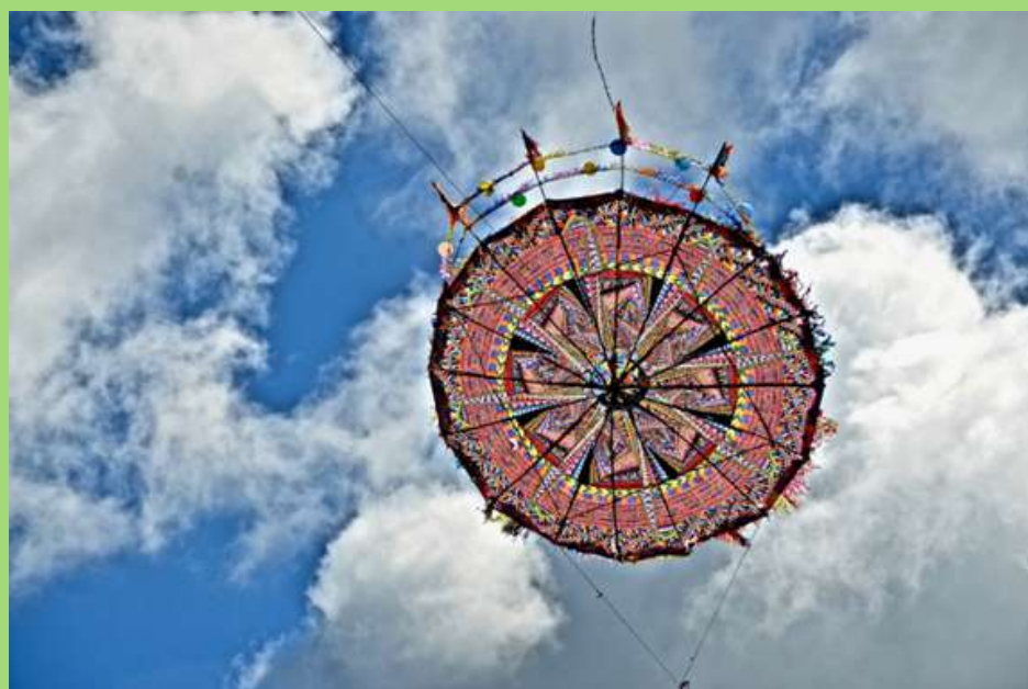
Barrilete en Santiago, Guatemala.

Monumentales discos de papel y colores aparecen en el cielo elevados por viento hasta las nubes y el sol en un espacio azul que recrea un espacio florido similar al de la tierra y las tumbas del espacio funerario en el que descansan lo restos de los familiares de los que acuden en esa fecha especial a recordarlos.