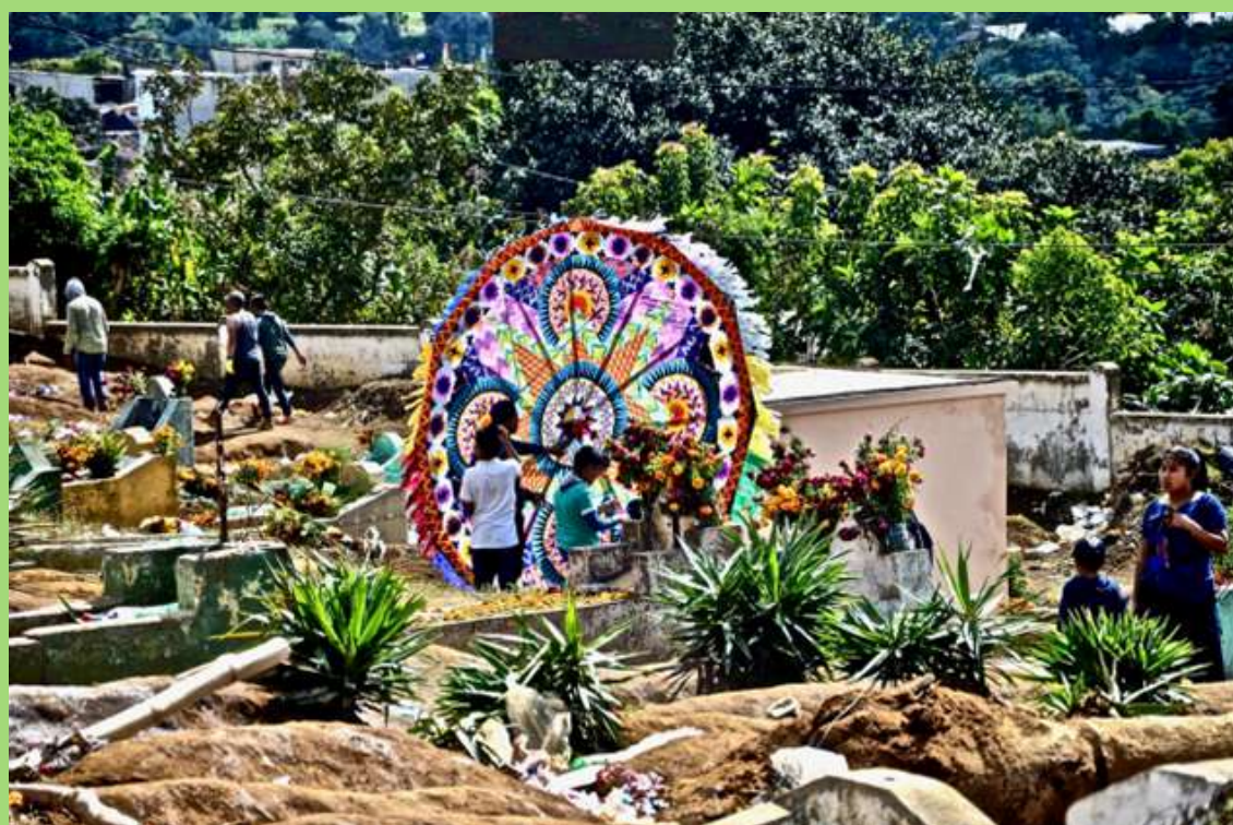
Familia presentando Barrilete ante familiar difunto.