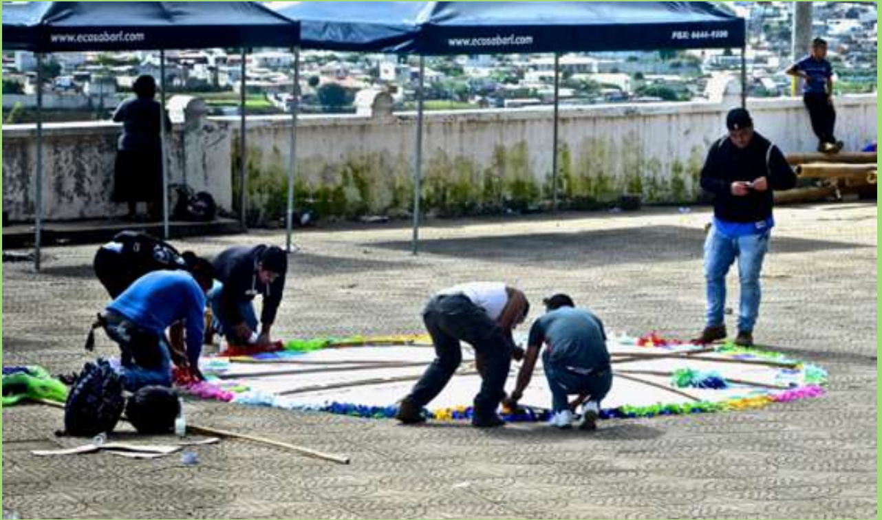
Grupo elaborando Barrilete.