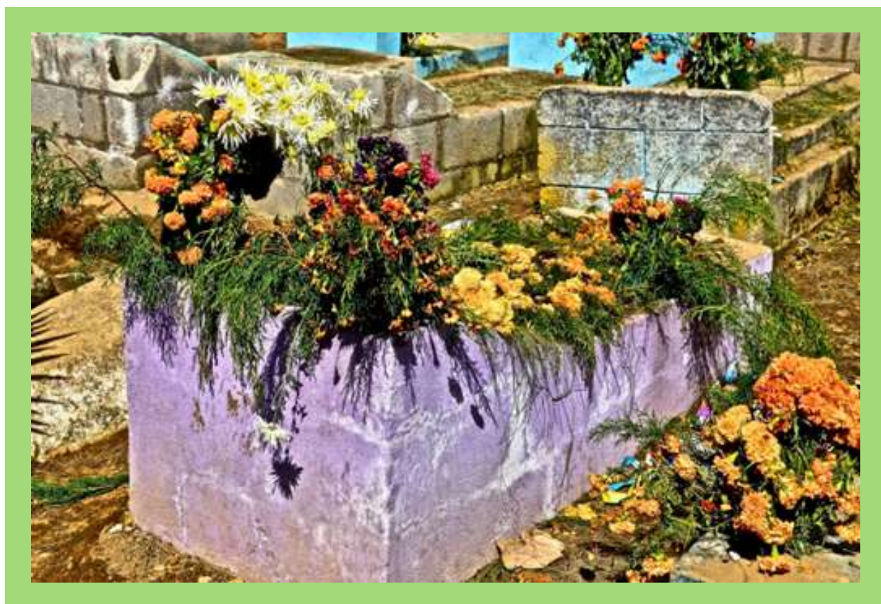
Tumba durante festival de Barriletes en Día de Muertos.