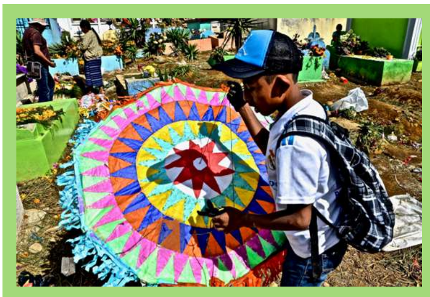
Niño con Barrilete.

Una conexión simbólica y espacial se establece en ese momento entre la tierra en donde habitan los seres vivos, el inframundo de la tierra, en donde habitan los restos de los muertos y el cielo o celeste en donde habitan los dioses y las almas que llegan al lugar y en el que año con año se comunican a través de este medio cultural establecido por la comunidad.