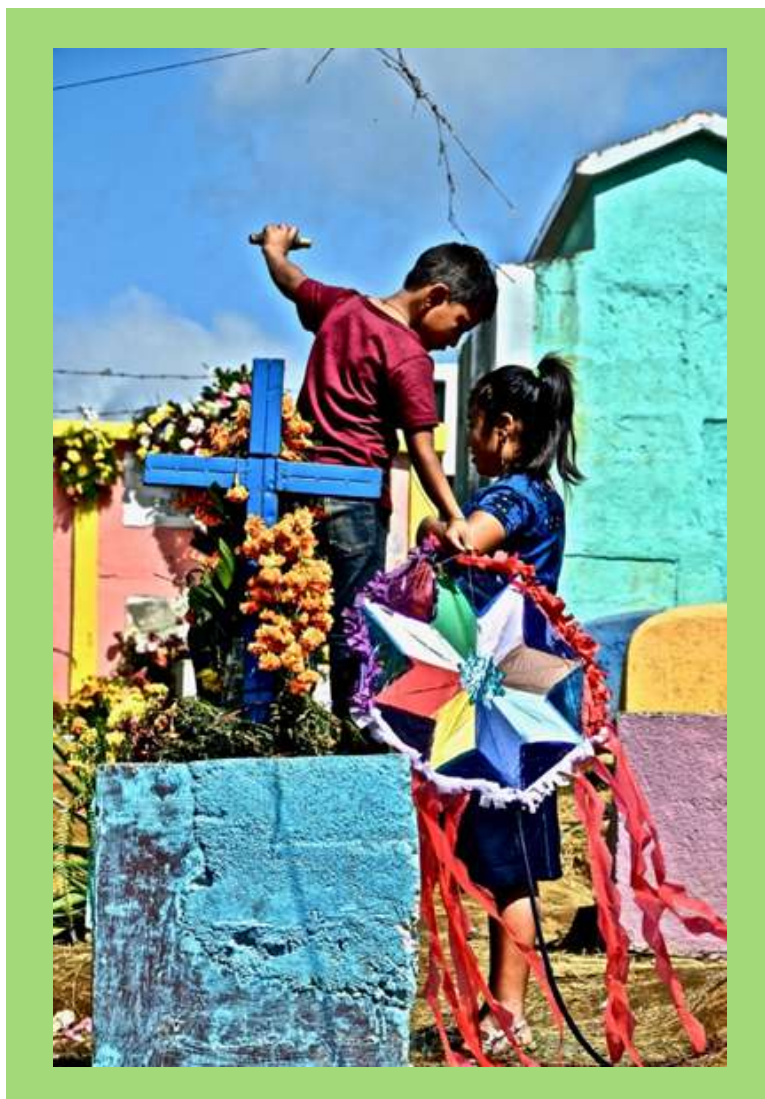
Niños volando Barriletes en Santiago.

¿Serán estos enormes disco solares representaciones de la palabra florida y un contexto de campo de flores en la tierra de manera temporal en la ceremonia y la celeste con estas que adquieren un carácter inmaterial y