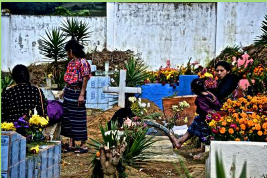
Familias durante festival de Barriletes en Día de Muertos.