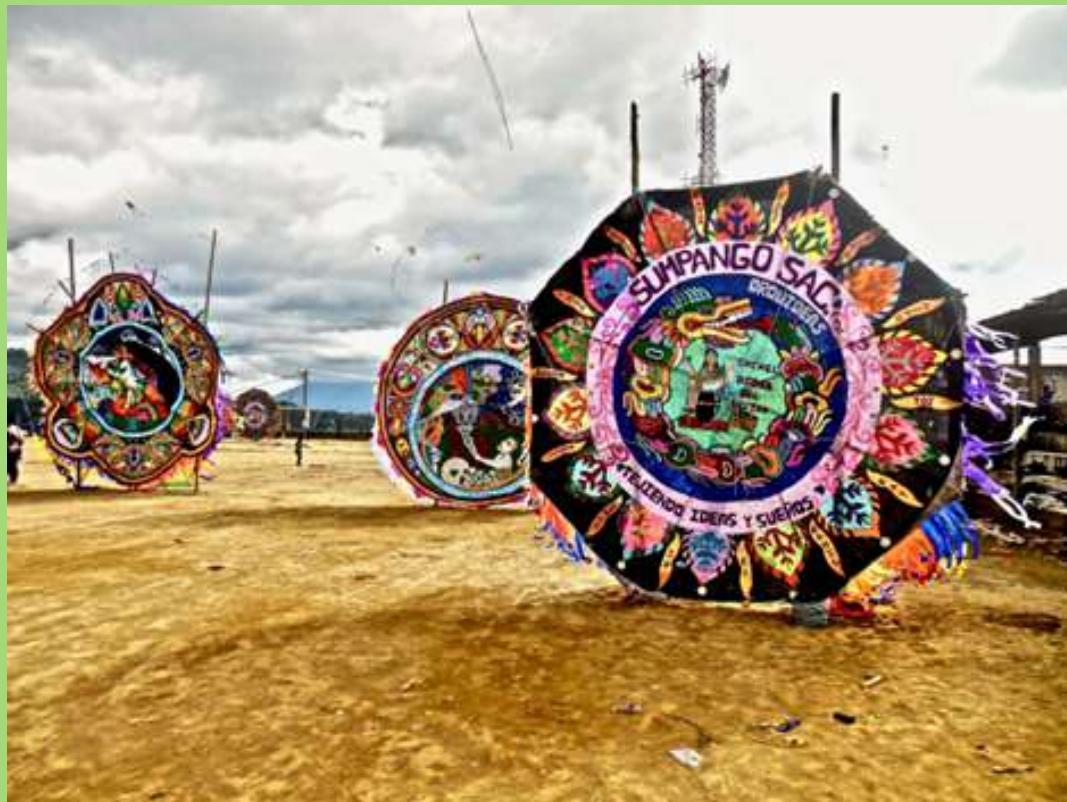
Barriletes en Día de Muertos.