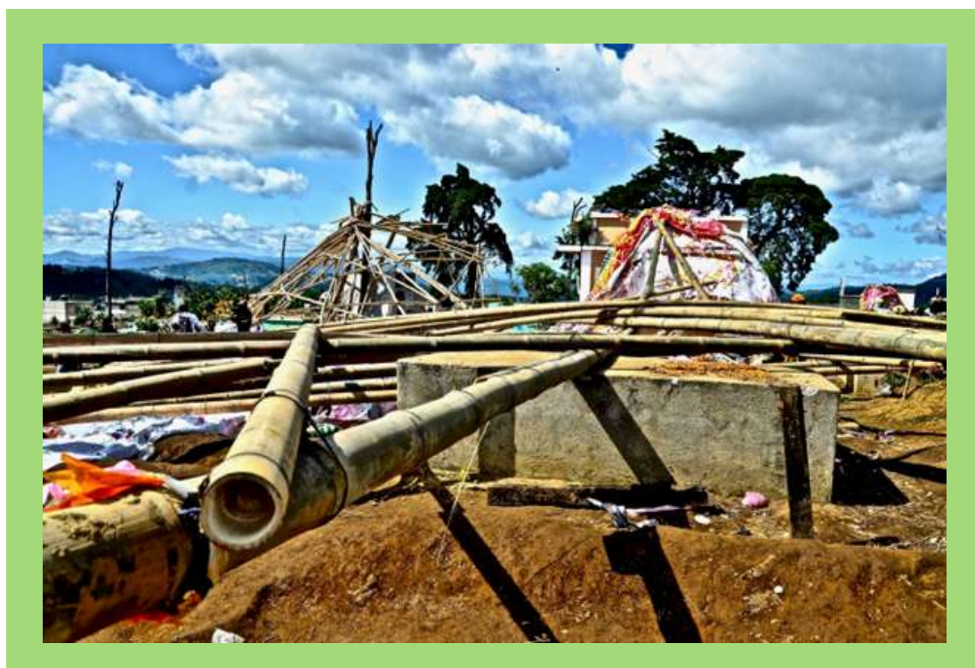
Estructura de Barrilete gigante.