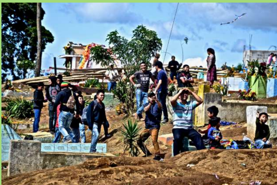
Barrilete en Santiago, Guatemala.

El gran disco inanimado adquiere una focalidad e importancia para todos los presentes, cuando éste al fin logra elevarse y contrastar con el cielo azul y la luz del sol que atraviesa la delgada superficie del barrilete, como se les denomina a estos “comentas” o “papalotes”.