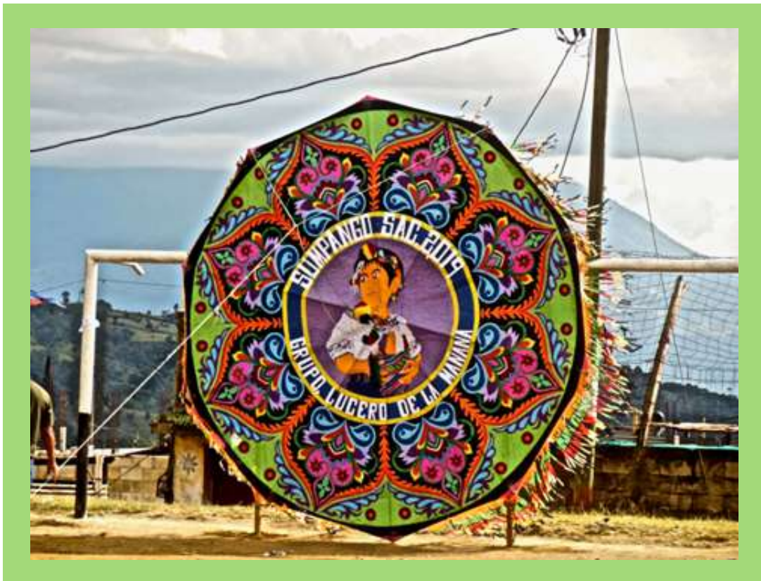
Barriletes en Día de Muertos.