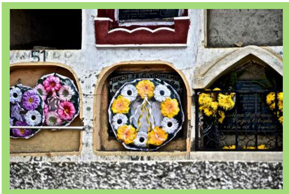
Tumba durante festival de Barriletes en Día de Muertos.