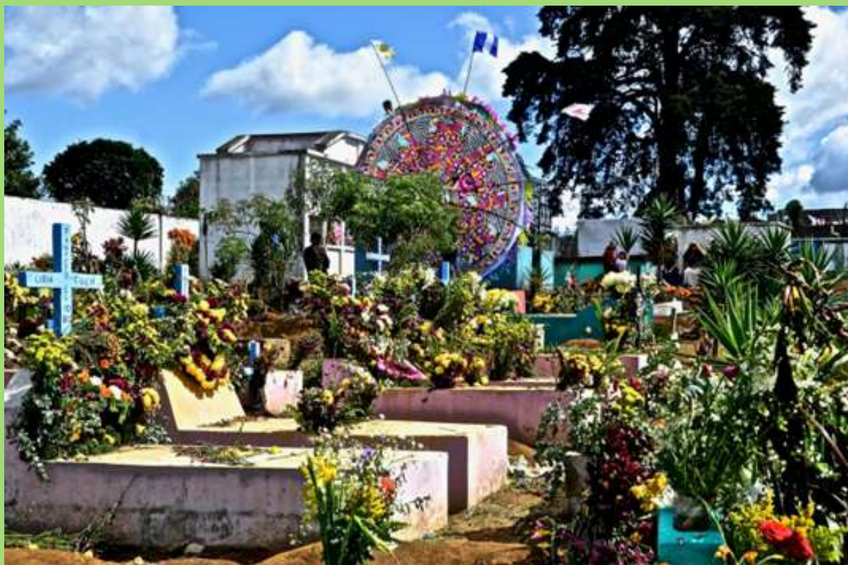
Tumba durante festival de Barriletes en Día de Muertos.