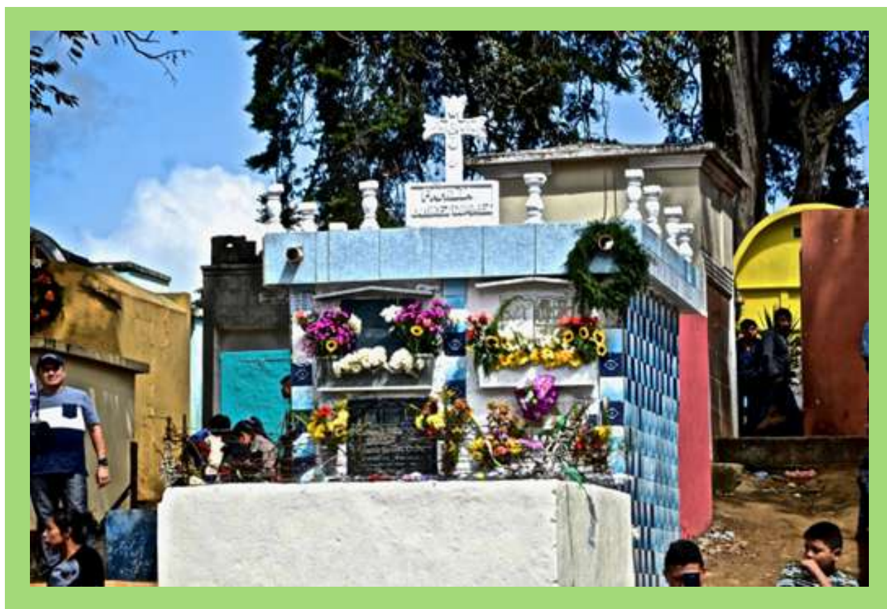
Tumba durante festival de Barriletes en Día de Muertos.