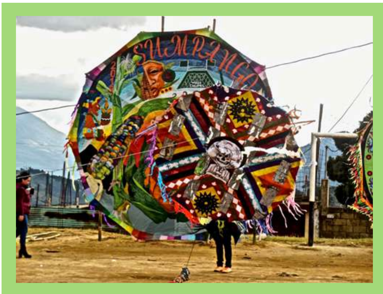
Barriletes en Día de Muertos.