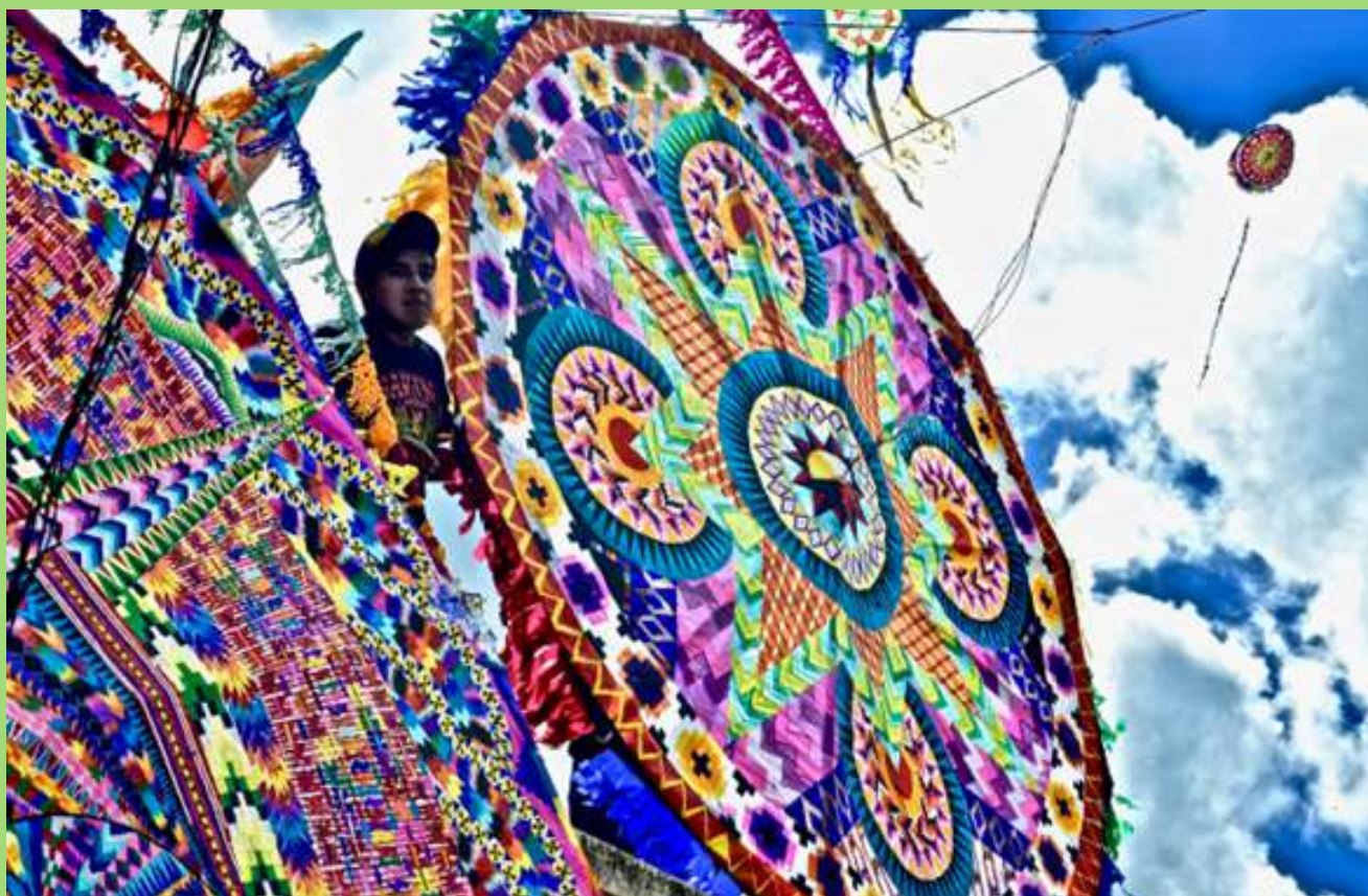
Barrilete en Santiago, Guatemala.