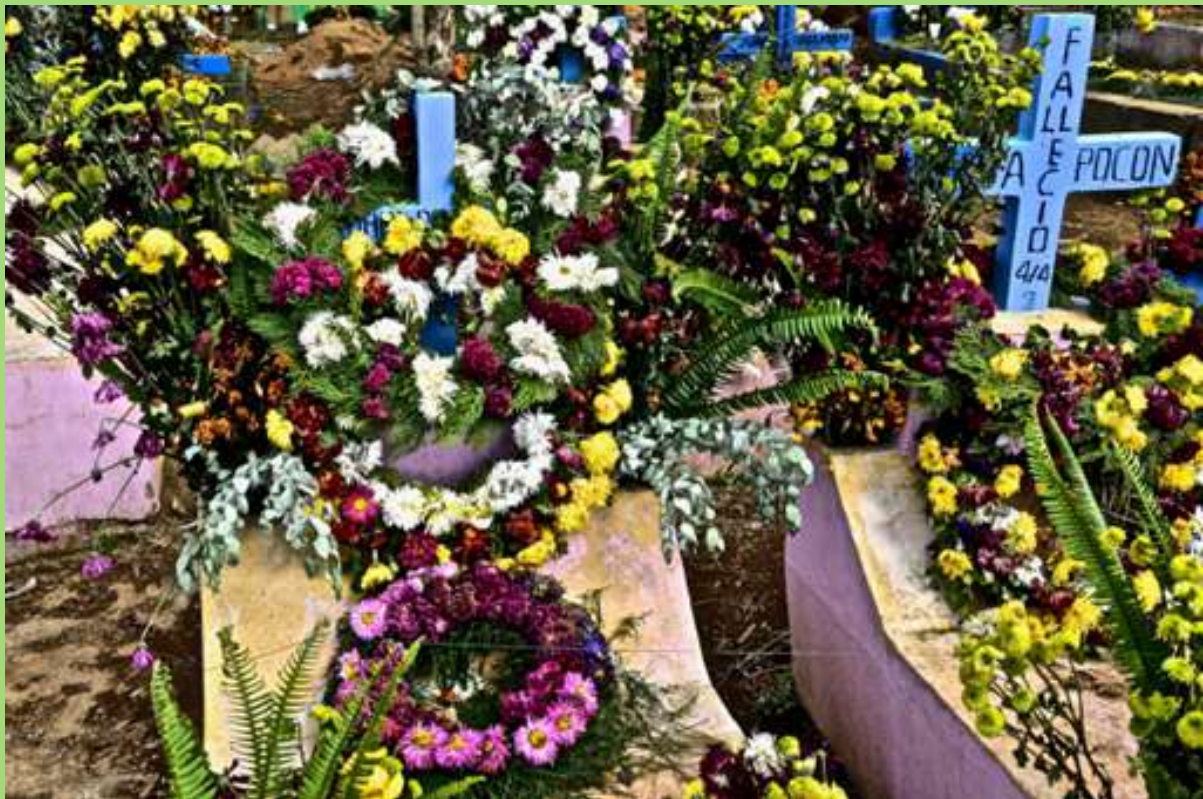
Tumba durante festival de Barriletes en Día de Muertos.