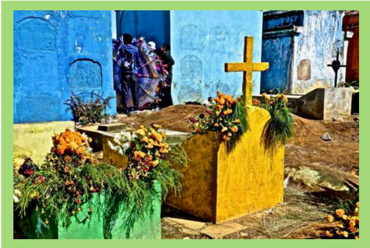
Tumba durante festival de Barriletes en Día de Muertos.