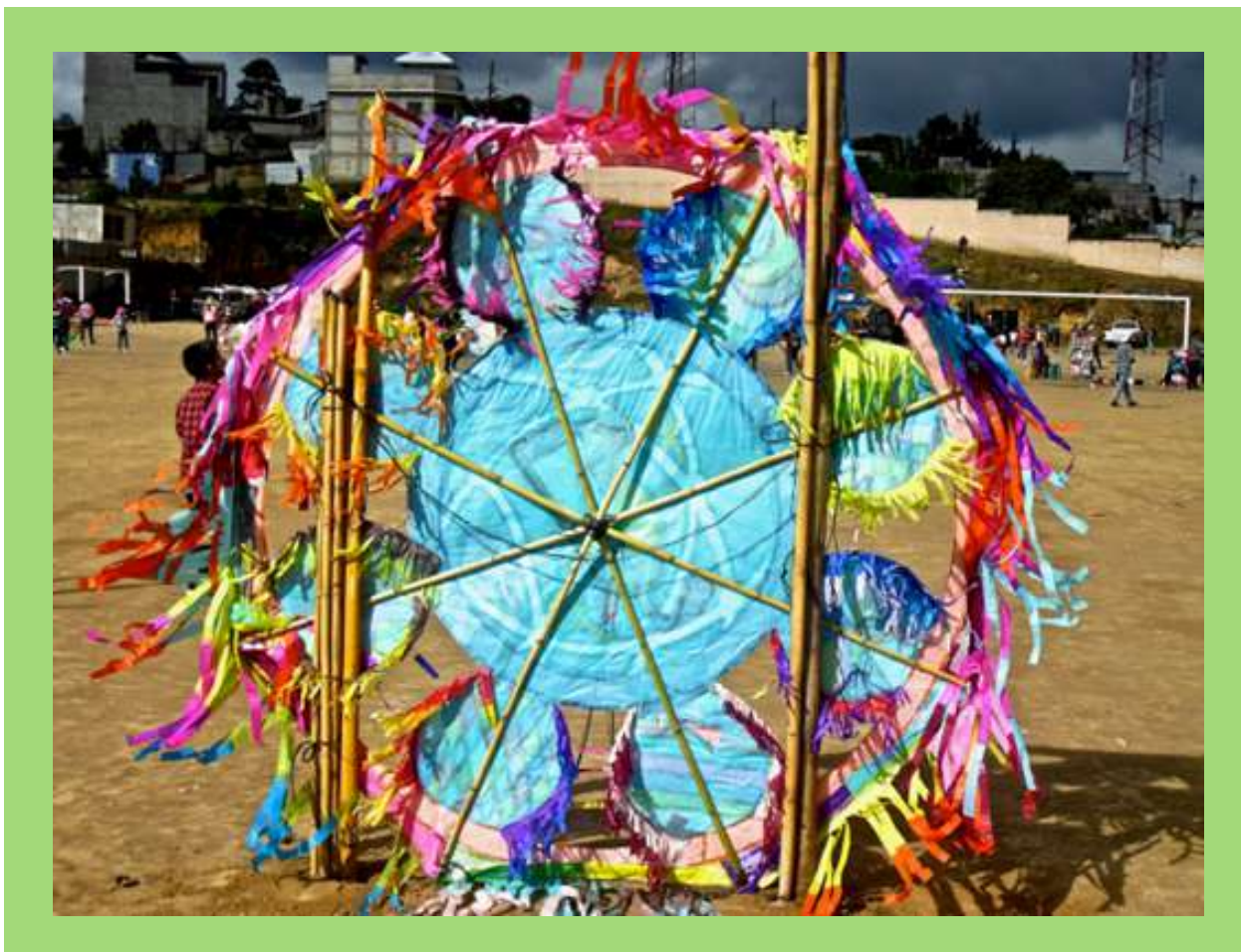
Barriletes de colores en Día de Muertos.