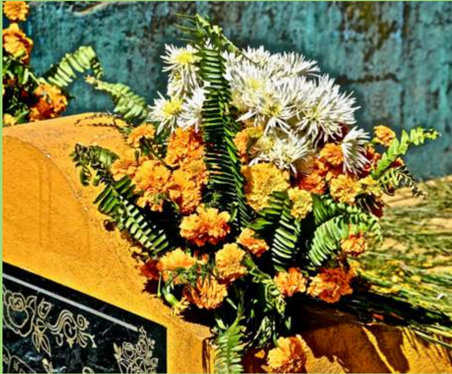
Tumba durante festival de Barriletes en Día de Muertos.