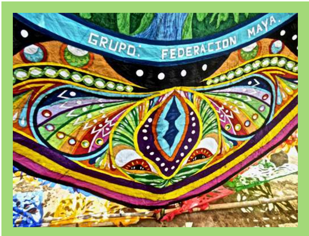
Barriletes en Día de Muertos.