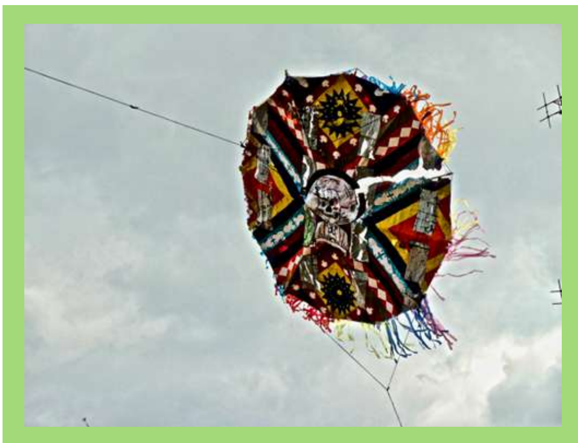
Barriletes de colores en Día de Muertos.