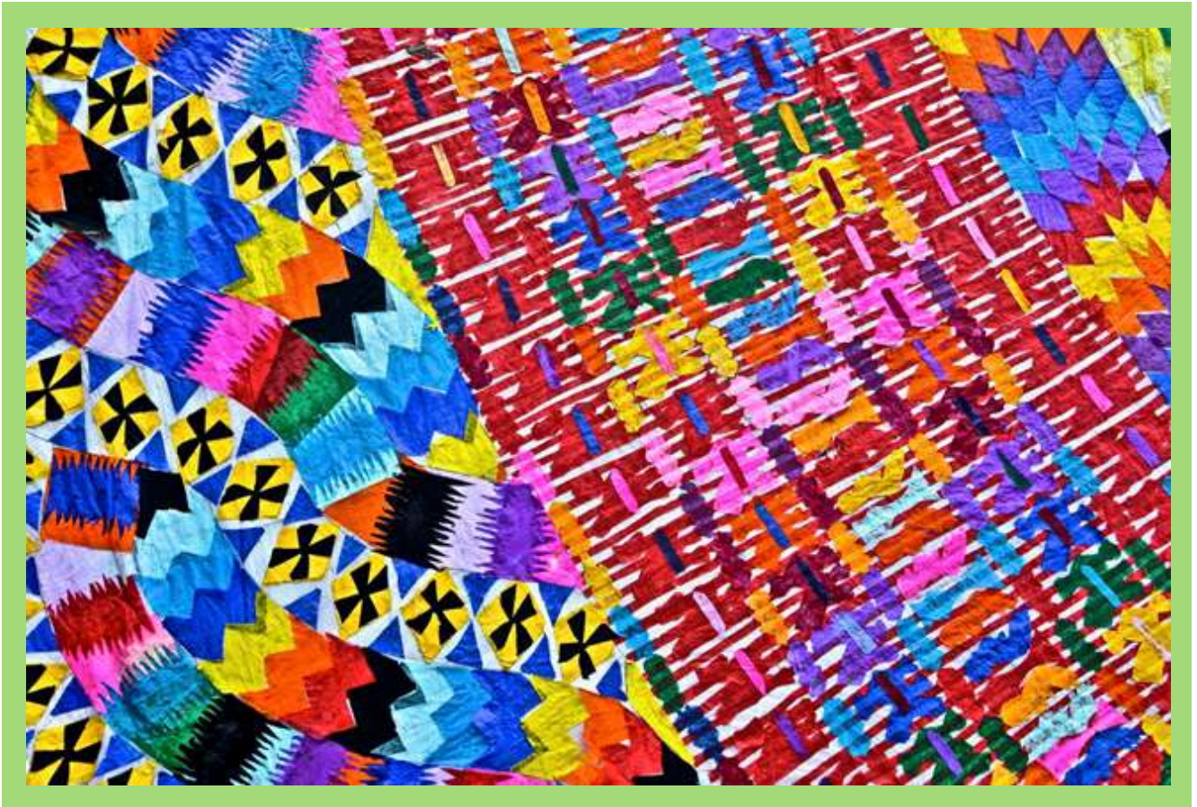
Ejemplo de colores, formas y figuras en Barriletes .