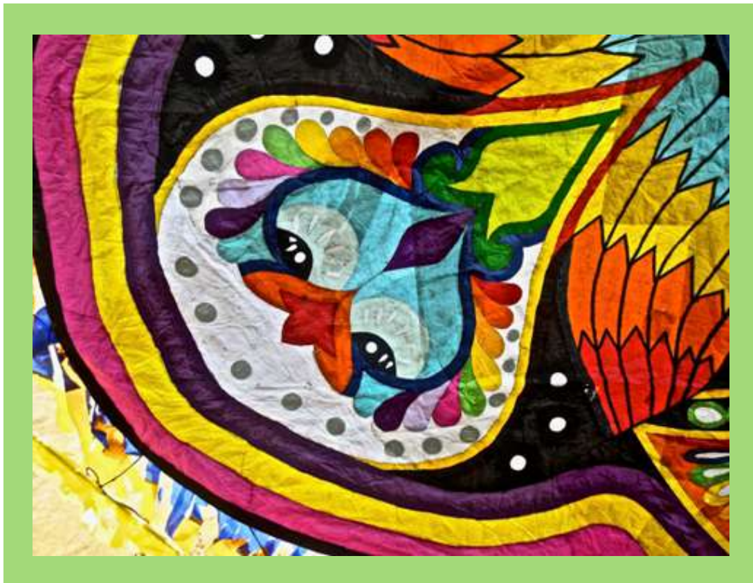
Barriletes en Día de Muertos.