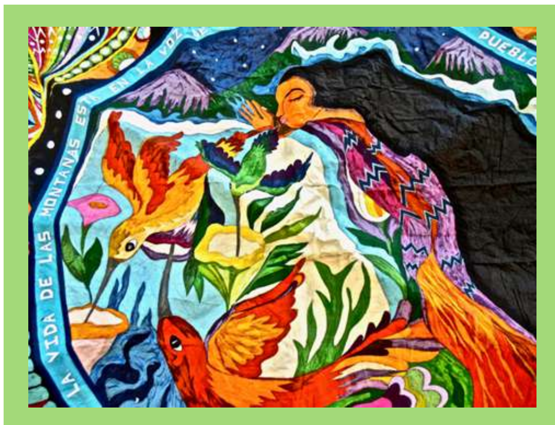
Barriletes en Día de Muertos.