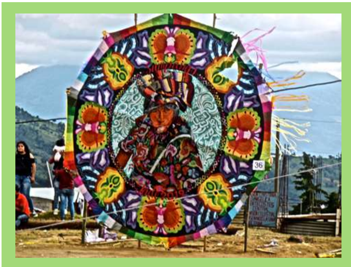
Barriletes de colores en Día de Muertos.