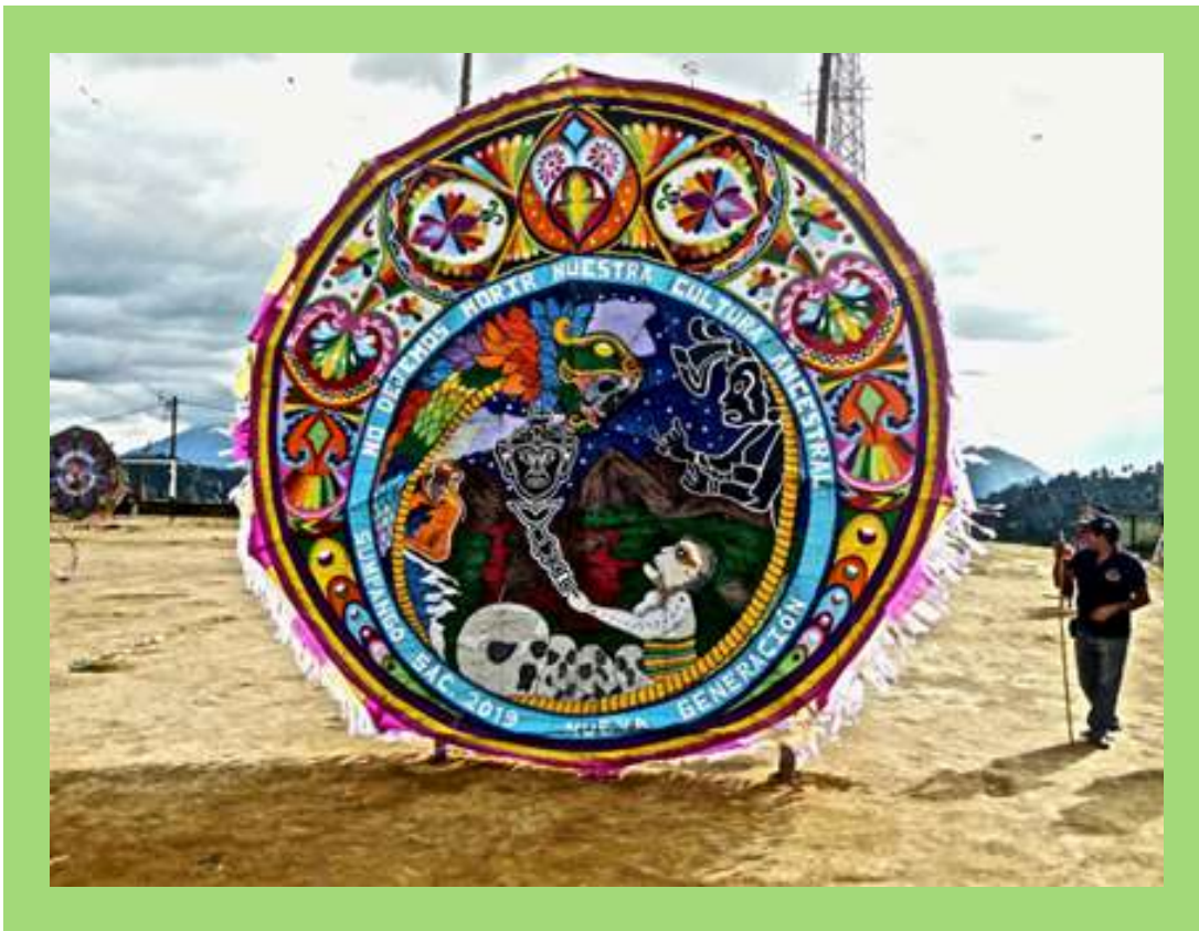
Barriletes en Día de Muertos.