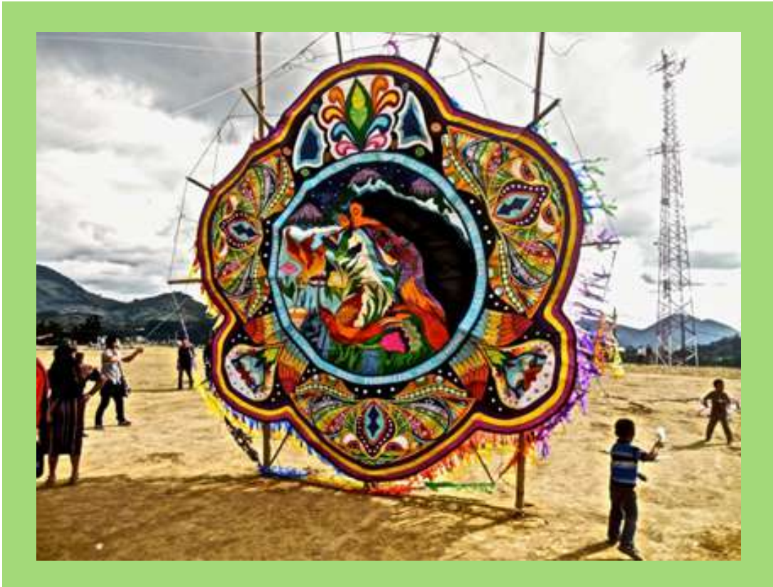
Barriletes en Día de Muertos.