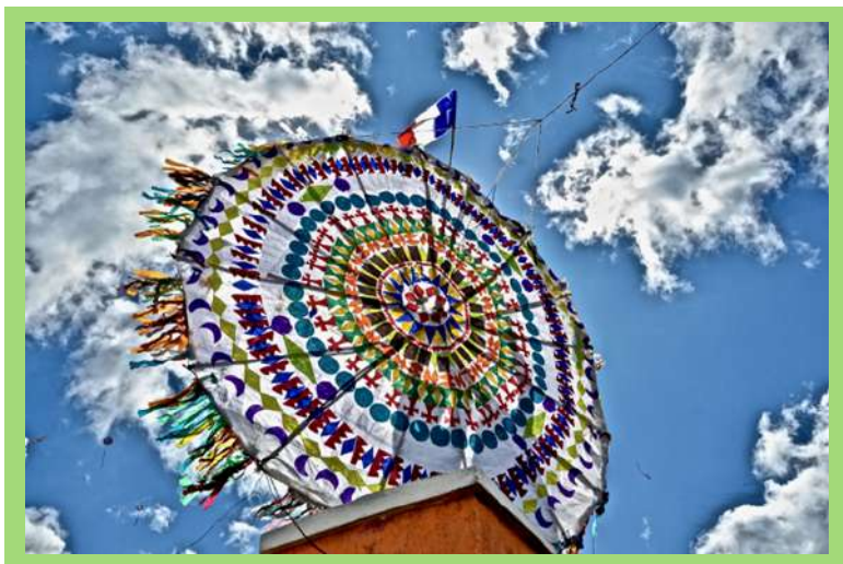
Ejemplo de Barrilete.

Se crea un movimiento y un soplo en ella con el movimiento y el viento que hacen posible que esta se eleve, se ilumine con los rayos del sol, transformándose en una multitud de soles artificiales hechos por el hombre en ese momento y en esa relación temporal.