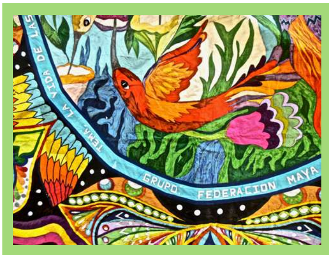
Barriletes en Día de Muertos.