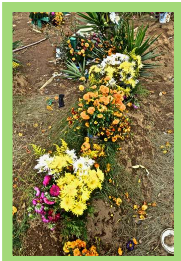
Tumba durante festival de Barriletes en Día de Muertos.