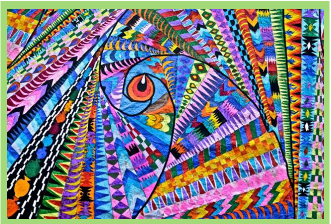
Ejemplo de colores, formas y figuras en Barriletes .