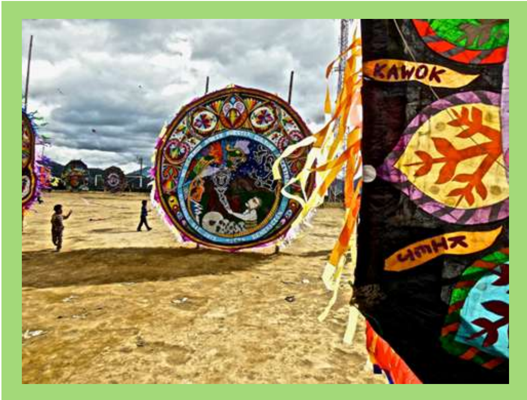
Barriletes en Día de Muertos.