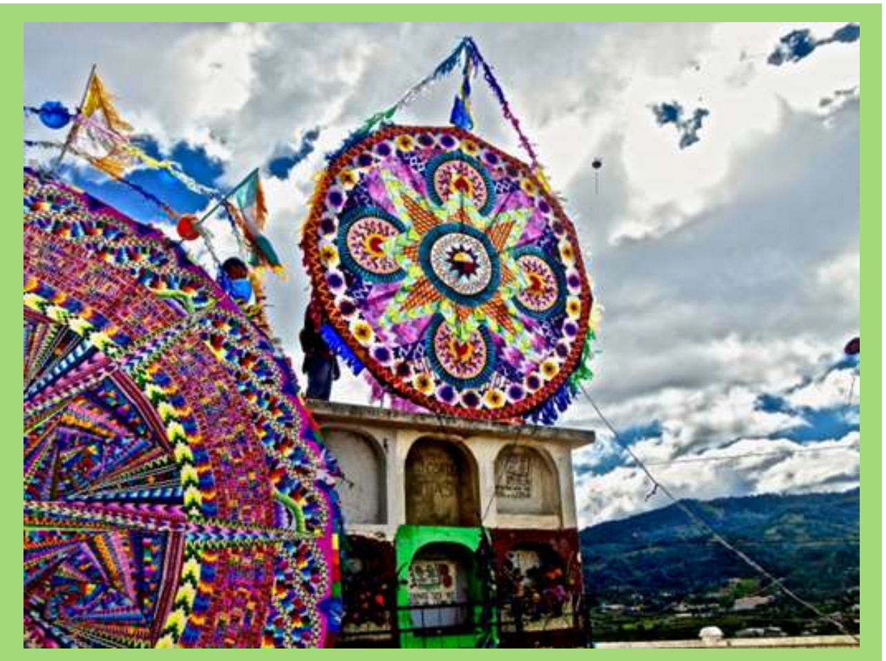
Ejemplo de Barrilete.