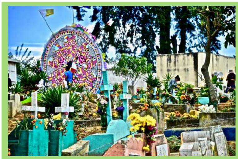
Barrilete en el panteón.