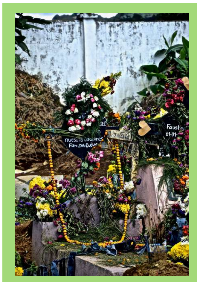
Tumba durante festival de Barriletes en Día de Muertos.