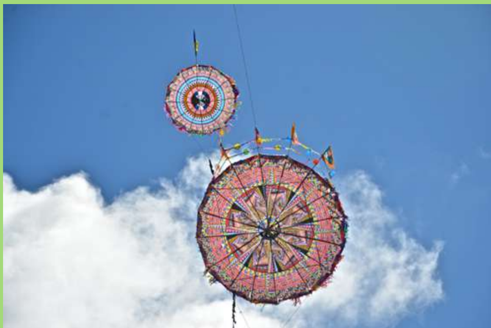
Barrilete en Santiago, Guatemala.