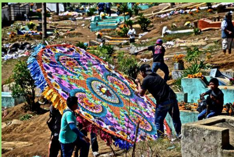
Barrilete en Santiago, Guatemala.