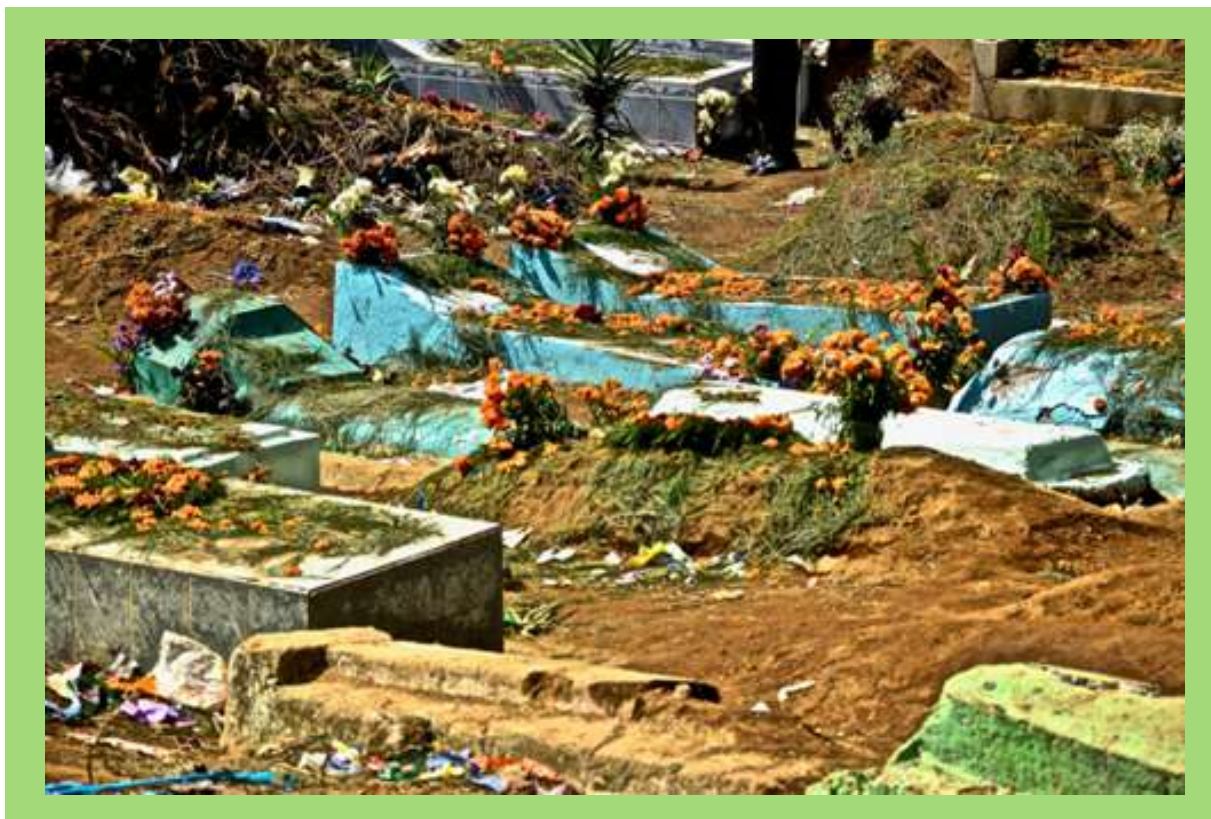
Tumba durante festival de Barriletes en Día de Muertos.