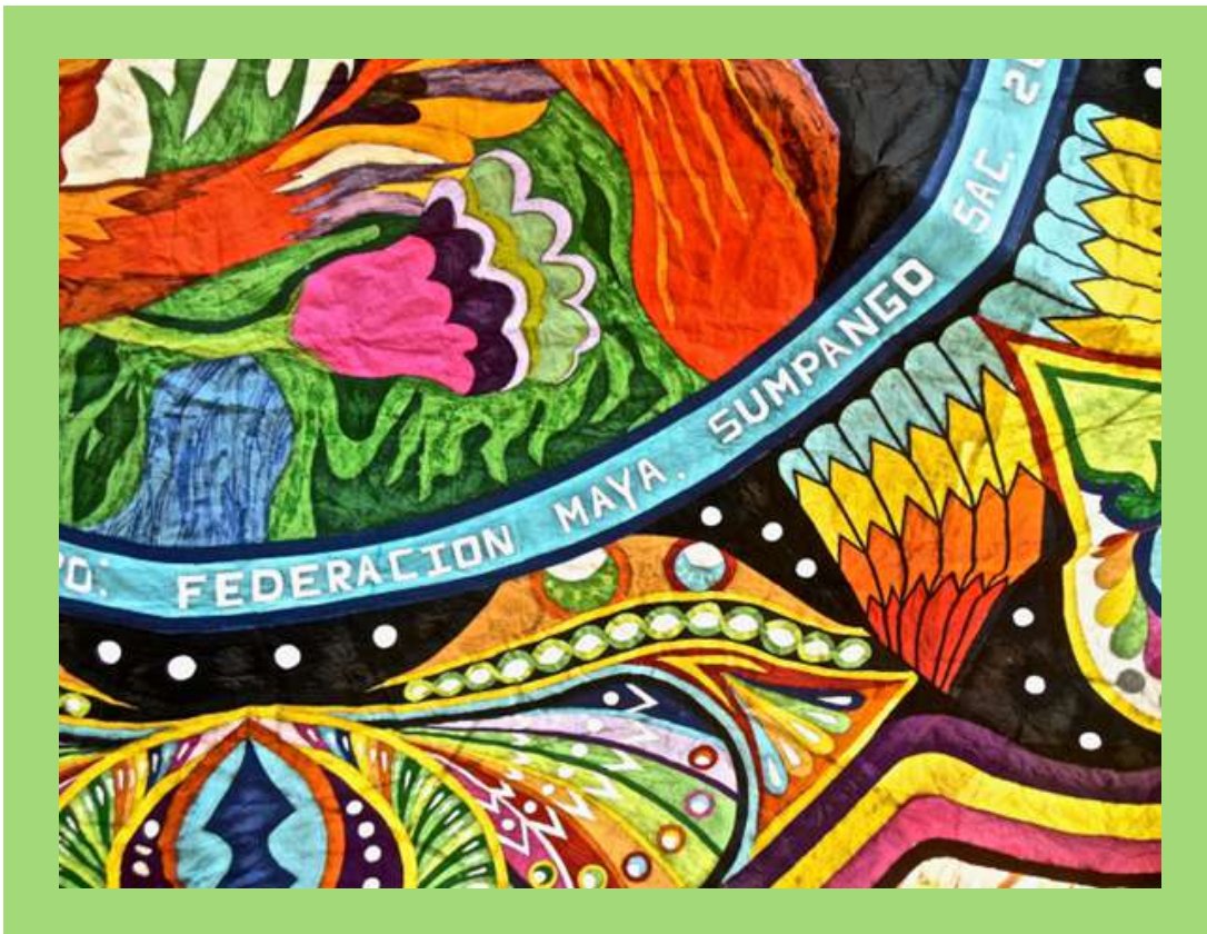
Barriletes en Día de Muertos.