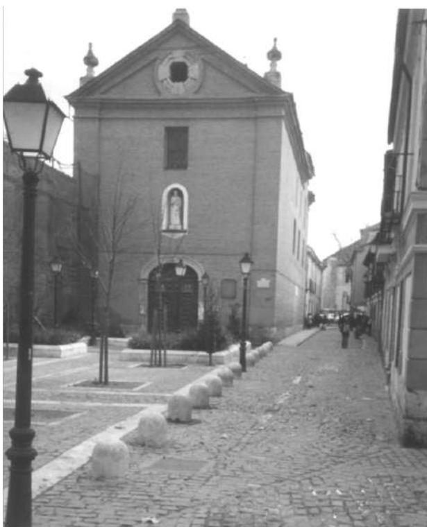
Ilustración 5. Iglesia del Oratorio de San Felipe Neri. 2004.

La plaza de Abajo o de la Picota era una calle ancha y amplia, ataño unía la calle del Ayuntamiento con la plazuela de Palacio, desde este se perdía la vista más allá del convento de la Merced Descalza, llegando hasta la puerta del Vado, pero esta vista panorámica tenía los años contados ya que en la que fue calle de la Tocinería, habían fundado su colegio y oratorio los padres de San Felipe Neri, la amplitud de esta calle hacia que estos padres se hubiesen fijado en ella, para mutilarla, ya que aunque la misma se estrechase un poco, aún quedaba suficiente anchura como para una galera, estos se dirigieron al Ayuntamiento en el 1692 diciéndole que pensaban agrandar su pequeño oratorio, para cuyo efecto solicitaban sacar la obra 14 pies para construir su iglesia 788.