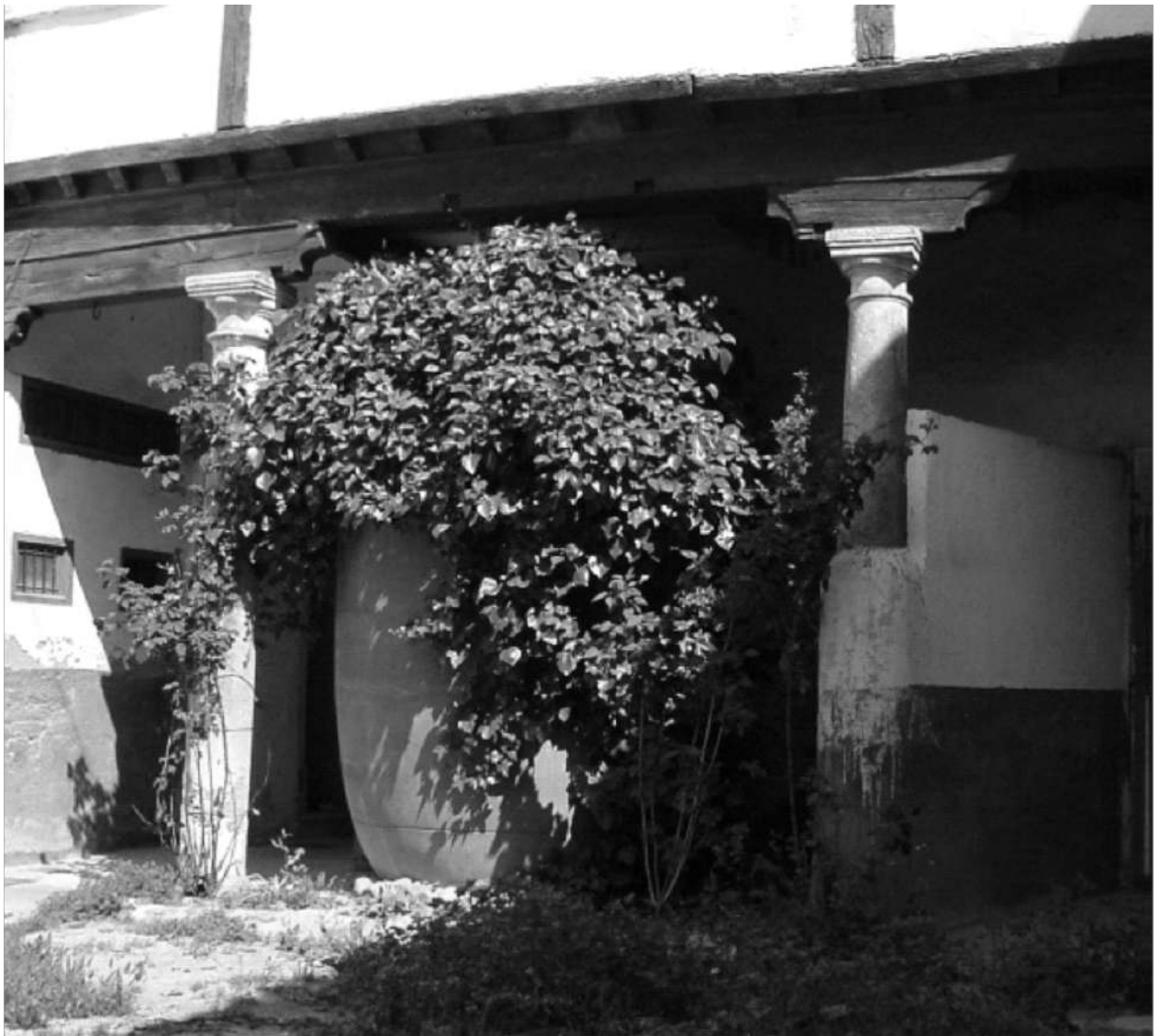
Ilustración 7. Interior del patio del colegio de Aragón. 2004.

Con el pretexto de que era un lugar donde se cometían injurias a Dios y un depósito de inmundicias, fue cedido al colegio de Aragón, bajo las condiciones antedichas. Con el correr de los tiempos esta cesión se había olvidado ya que los edificios que franqueaban el callejón eran particulares.