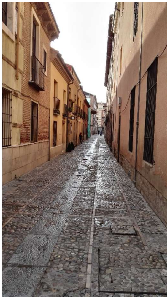
Ilustración 13. Callejón de Baena, de la Manta o calle de las Escuelas.

Con la construcción del mercado municipal se abrió la calle del Mercado dándole salida al callejón de la Manta hacia la calle Cerrajero, pero la parte correspondiente al ex convento del Carmen lo utilizaba el ayuntamiento como cuadra y corralón para encerrar el carro del servicio de la limpieza y los mulos, así como almacén de estos materiales y como pajar.