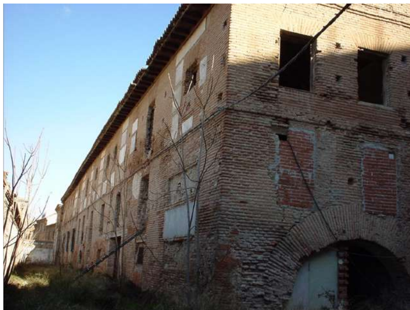
Ilustración 21. Lateral del colegio de los Basilius y tapias del colegio de la Merced, hoy integrada en el Parador de Turismo, y convertido dicho tramo en el callejón del Pozo. F. Rafael Fernández.

Posiblemente Guerra adquirió un trozo de terreno y la servidumbre del colegio que tenía el actual propietario del colegio de los Gramáticos, ya que junto a la puerta de salida de la calle Azucena existía una puerta y un cobertizo utilizado como taller mecánico por la Bandera Paracaidistas.