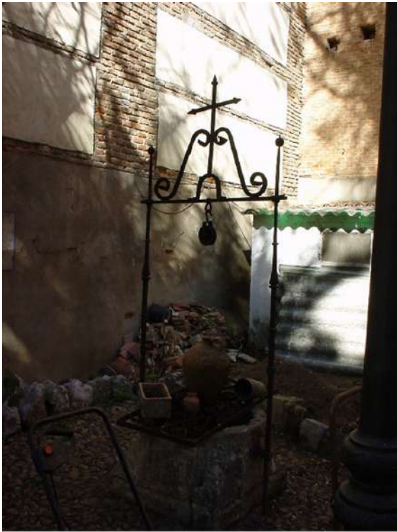
Ilustración 19. Patio de Mataperros.

Que el colegio de la Santísima Trinidad reparen y cuiden de la pared que linda a la casa del Sto. Cristo de los Doctrinos, por haberle concedido y dado esta Ciudad la calle que llamaban de la Virginidad, que incorporó a su vivienda y que esta posee en calidad y escritura 858. Según se desprende de este acuerdo del Ayuntamiento en este callejón de la Virginidad, en el tramo colindante con el colegio de la Santísima Trinidad es donde estuvo el primer colegio de los jesuitas en Alcalá, y tal vez donde fundara la compañía de Jesús San Ignacio de Loyola, espacio conocido hoy como patio de Mataperros.