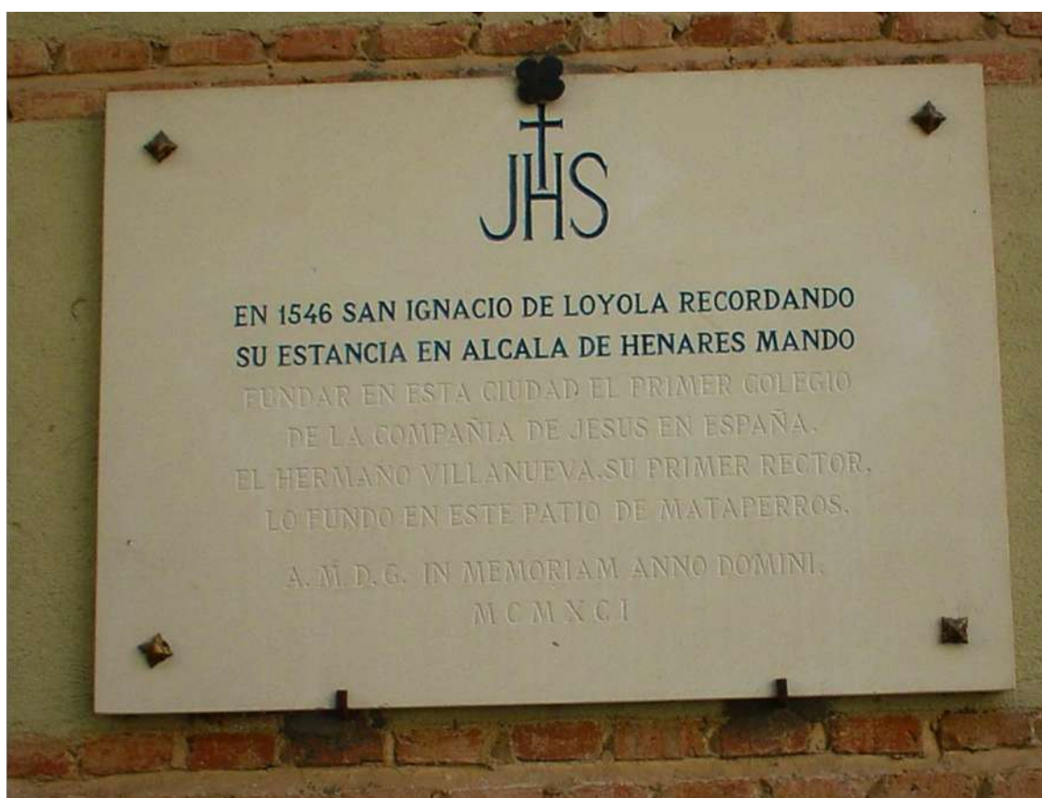
Ilustración 17. Lapida en el patio de Mataperros, o ensanche del callejón de la Virginidad. F.

Por los libros de actas del Ayuntamiento y demás legajos conservados, estos nos indican reiteradamente que el llamado callejón de Mataperros comenzaba en el callejón del Perro y llegaba hasta la puerta de Aguadores, es decir las hoy Travesía de San Julián y Basillos, la calle o callejón de la Virginidad, ya había desaparecido, ahora los frailes del colegio de Trinitarios Descalzos: