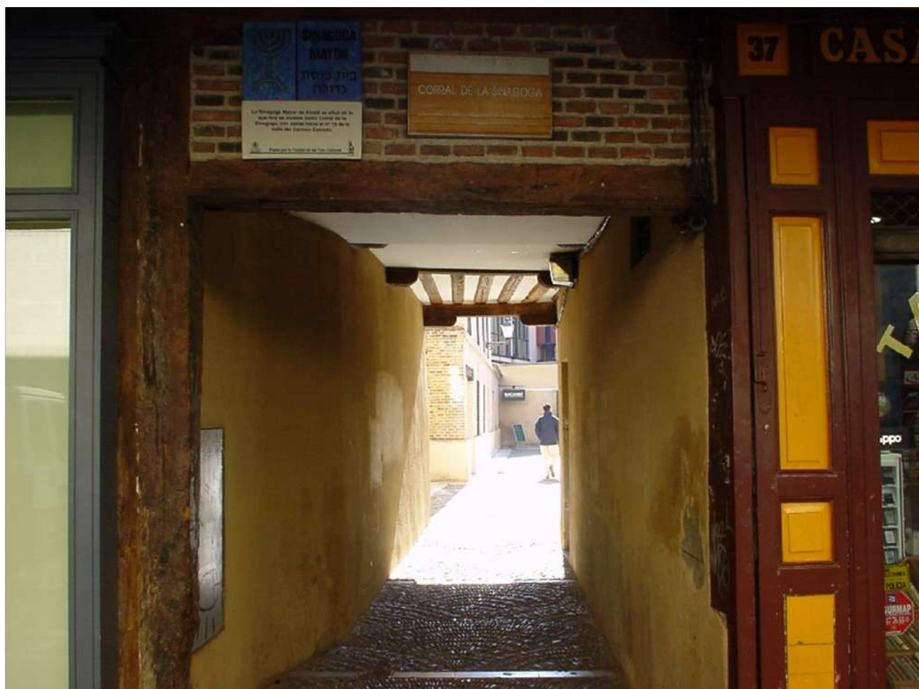
Ilustración 12. Entrada al corral de la Cruz, de la Sinoga o de la Sinagoga en febrero del 2005. F. Rafael Fernández.

pueda tolerarse la estancia de algún vehículo en la pertenencia indicada, pero siempre que no obstaculice la franca circulación, que se proceda al empedrado de aquella localidad con el fin de encauzar las aguas de lluvia a la acometida general, con lo que se evitará las inundaciones en las habitaciones bajas por el bajo nivel en que respectivamente se hallan algunas de ellas, que aun cuando puedan sustraerse a las afueras de la población las escorias de la fragua no son nocivas a la salud y que desaparezca el sumidero a la entrada de la mencionada calle, porque no responde al objeto para el que fue construido 824.