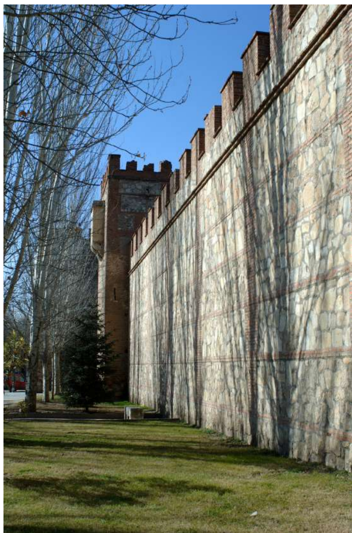
Memoria del Mundo. UNESCO

El callejón, elemento consustancial de la tradicional medina árabe, aún se conserva como legado de la arquitectura urbana de la Europa medieval, en un variado y valioso muestrario de callejones, y en muchas ocasiones forma toda una red vial en los cascos históricos (la ciudad vieja) tanto de villas y capitales como en pequeñas poblaciones del medio rural” 771.