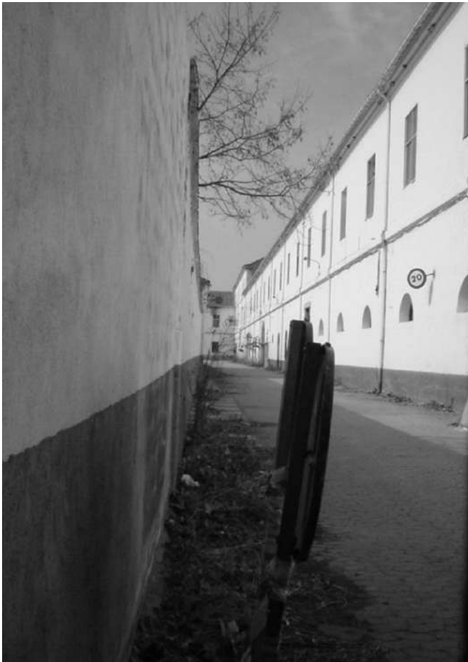
Ilustración 20. Callejón de los Gramáticos desde la calle Azucena en 2004, poco antes de ser cedido a la Universidad el acuartelamiento del Príncipe. Foto

El cuartel había tomado para sí un estercolero en la misma línea del cuerpo del edificio, un trozo de terreno baldío al otro lado del camino de Ronda, lindante con la huerta de la Trinidad: