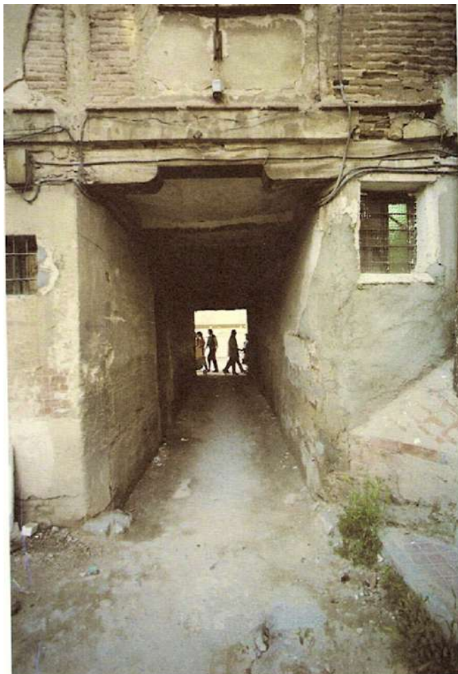
Ilustración 10. El corral de la Cruz, Sinoga o Sinagoga. https://www.facebook.com/sfarad.es/photos/a.161841807718081/214259365

Hubo que esperar hasta las últimas décadas del siglo XX, en las cuales se llevó a cabo la urbanización del colegio de los Irlandeses, conservándose el edificio del colegio y urbanizándose el resto que incluía el antiguo mesón de la Parra, parte del corral de la Sinagoga, abriéndose la calle de los Irlandeses y una amplia plaza para uso y disfrute de los complutenses.