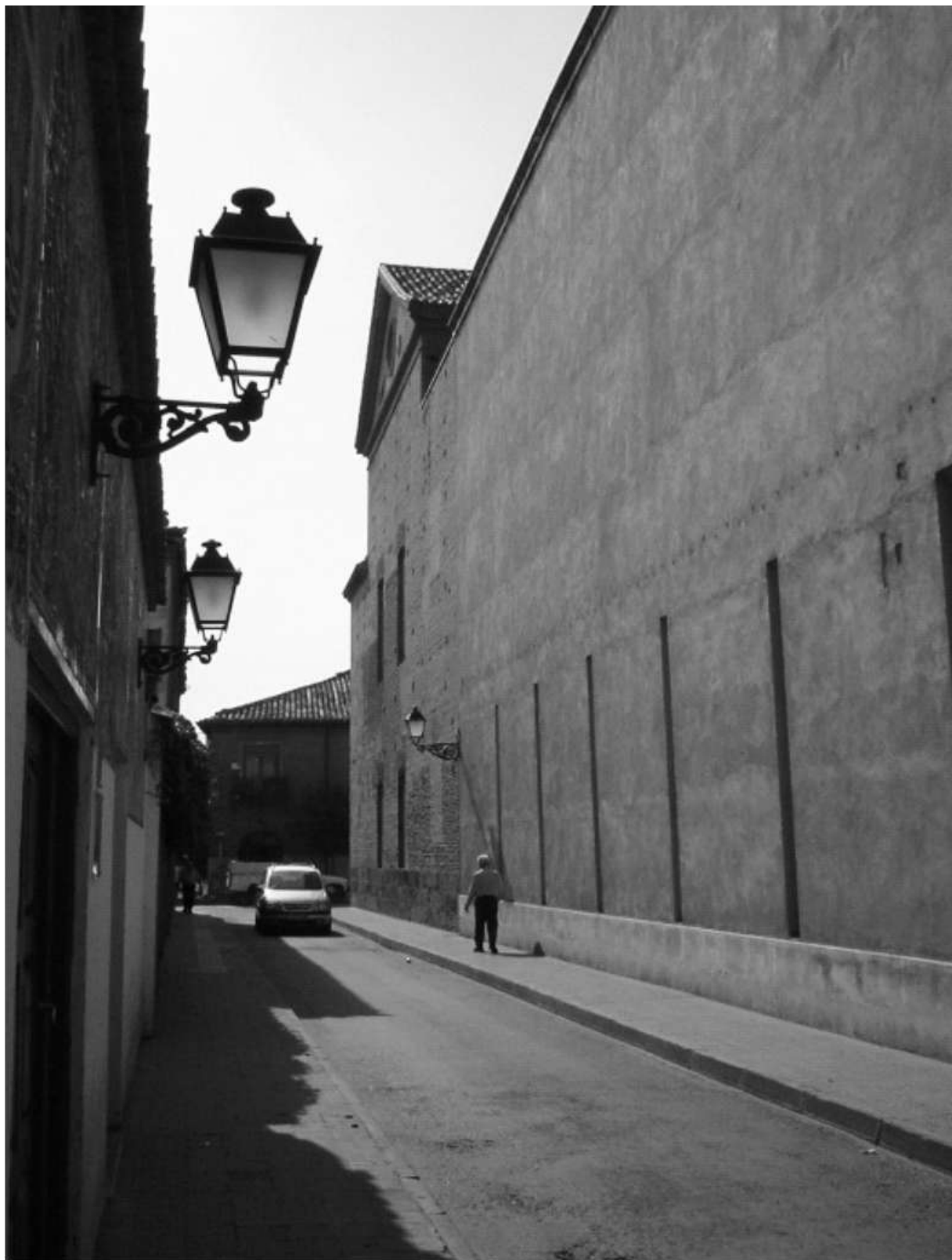
Ilustración 6. Callejón de la Audiencia, hoy calle Cid Campeador, aspiración del ayuntamiento de 1894. 2004.

790. AHMAH. Libro de actas del Ayuntamiento n° 163. Ayuntamiento de fecha 21-03-1894.