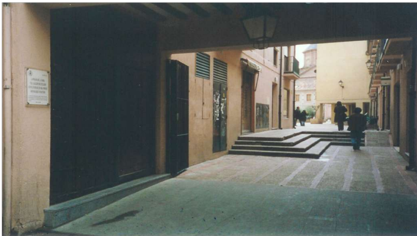
Ilustración 9. . Entrada al Callejón de los Irlandeses o del Peligro, desde la puerta de la posada de la Parra. Foto J. Prades 2007.

proponía cursar a los herederos del Exmo Sr. Márquez de Canillejas, dueños de la finca que un día fue colegio de los Irlandeses, y sitio en que esta la calle de Referencia, la cesión de esta última, a condición de que el Ayuntamiento haga por su cuenta las tapias necesarias para cerrar dicha calle, comprometiéndose la corporación a dar a la referida calle, una vez fuera de dominio público el nombre de calle de Revillagigedo...” 816