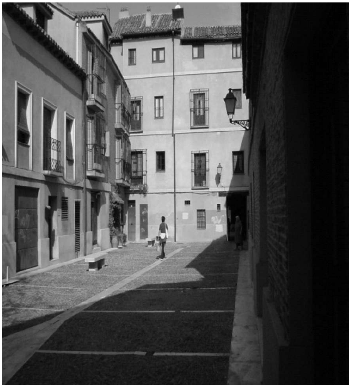
Ilustración 11. Corral de la Sinagoga. Calle desde el 12-10-1882. 2004.