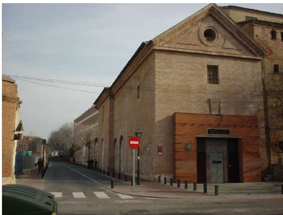
Ilustración 16. Callejón de los Basilos o de la Galera. F. Rafael Fernández, enero 2005.

Que se encargue al Sr. Arquitecto la formación del plano de la calle de la Galera o sea la comprendida entre las tapias del penal de hombres y la casa Galera que conduce al campo 852.