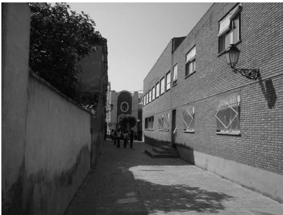
Ilustración 8. Callejón de las Escolapias. Antaño del colegio de Aragón, desagüe de la calle de Santiago y de la de Cervantes. Cedido en su día al colegio de Aragón, pero sin que el ayuntamiento perdiese su propiedad. La apertura de este callejón, como vía de unión con la Ronda, fue una constante de todos los ayuntamientos durante siglos. 2003.

Que el 31 de julio 1673 ante Ignacio Vilorria y este dicho colegio y Vuestra Señoría se hizo escritura sobre el arroyo, o albañal que llaman de la puentezuela, linde del dicho colegio que salen las aguas que viene desde Palacio toda la calle San Santiago, hasta la esquina de las casas de Juan de Córdoba y parte de las que vienen por la calle de la Carnicería vieja, que a crecentan dicho arroyo o albañal, con la condición y calidades contenidas en ella que desde luego aprobó.