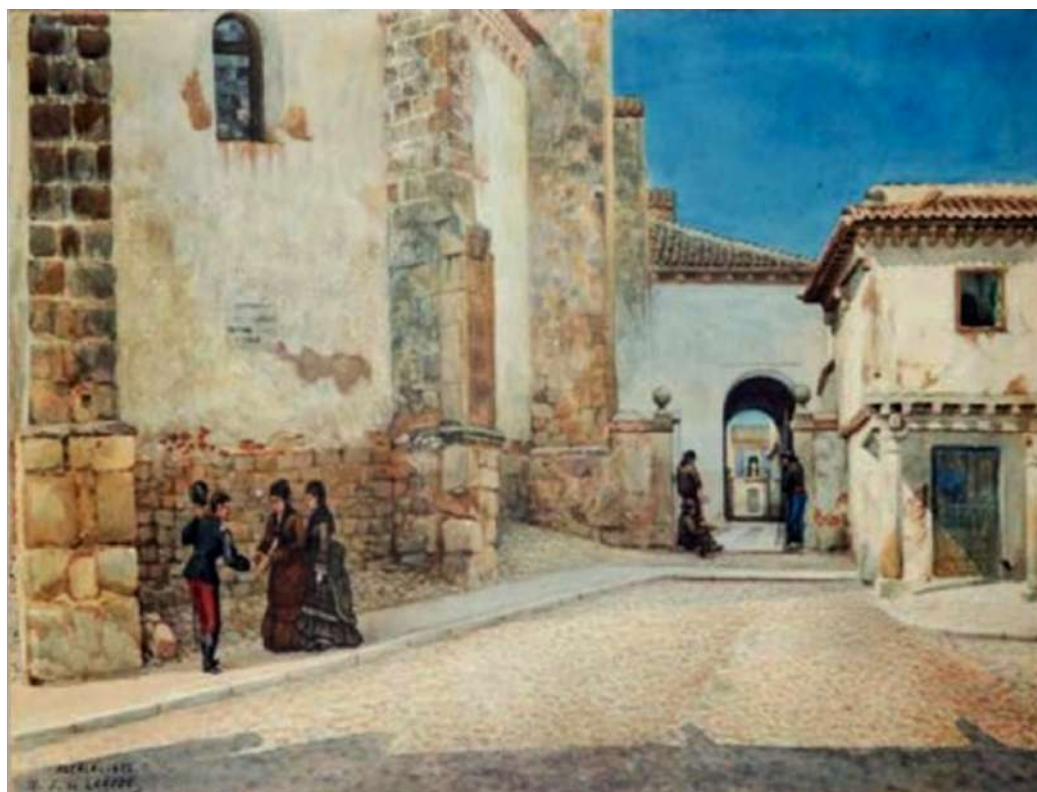
Ilustración. El Callejón del Crsto de la cadena. Laredo, Ilustración publicada por J.C. Canalé personal, el 30 de abril 2021. https://www.jccanalcala.cristocadena

La casa situada en la plaza de Abajo, con vuelta a la calle de Cisneros y pasadizo de San Justo, era la que presentaba un estado más alarmante de ruina, así como las casas nº 5-7-9-11-15 de la calle de Cisneros, la última con vuelta a la plaza del Trigo. La única que estaba en buenas condiciones era la nº 3 de la calle de Cisneros 779.