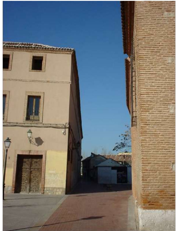
Ilustración 1. Callejón de la Victoria. enero 2005.

El Concejo dentro de su política de embellecer la Villa y casi siempre con el pretexto de ser lugares pecaminosos y depósitos de basuras, mandó pregonar 774 :