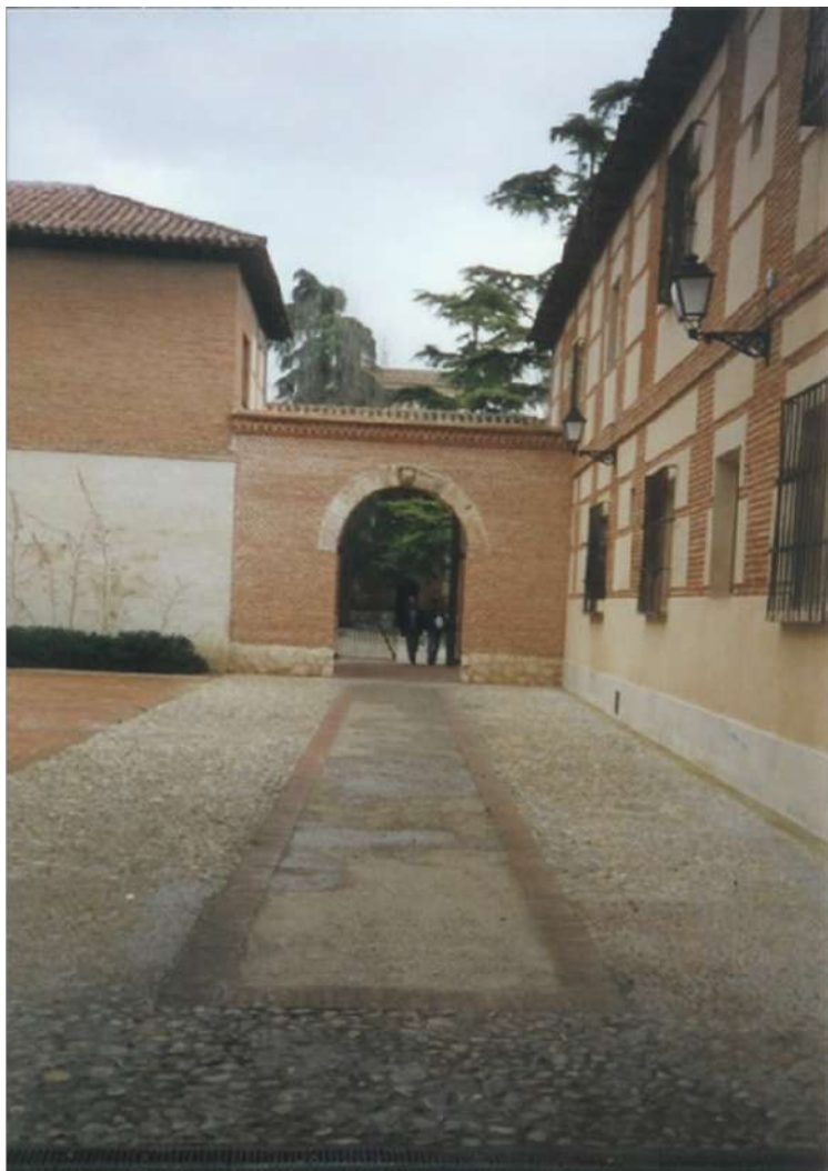
Ilustración 14. Callejón de los Continuos y la puerta de los Burros. febrero 2007.

El perjuicio que se sigue a la vecindad por tener abierto el paso del patio de los Continuos del Colegio Mayor de San Idelfonso, sitio únicamente útil para efugio de mal entretenidos y expuesto a ocurrir daños y perjuicios, y por lo tanto pedía que para evitarlo todo, se pasase un oficio al Sr. Rector de dicho colegio, a fin de que cierre dicho patio con puertas, según antes lo estaba.