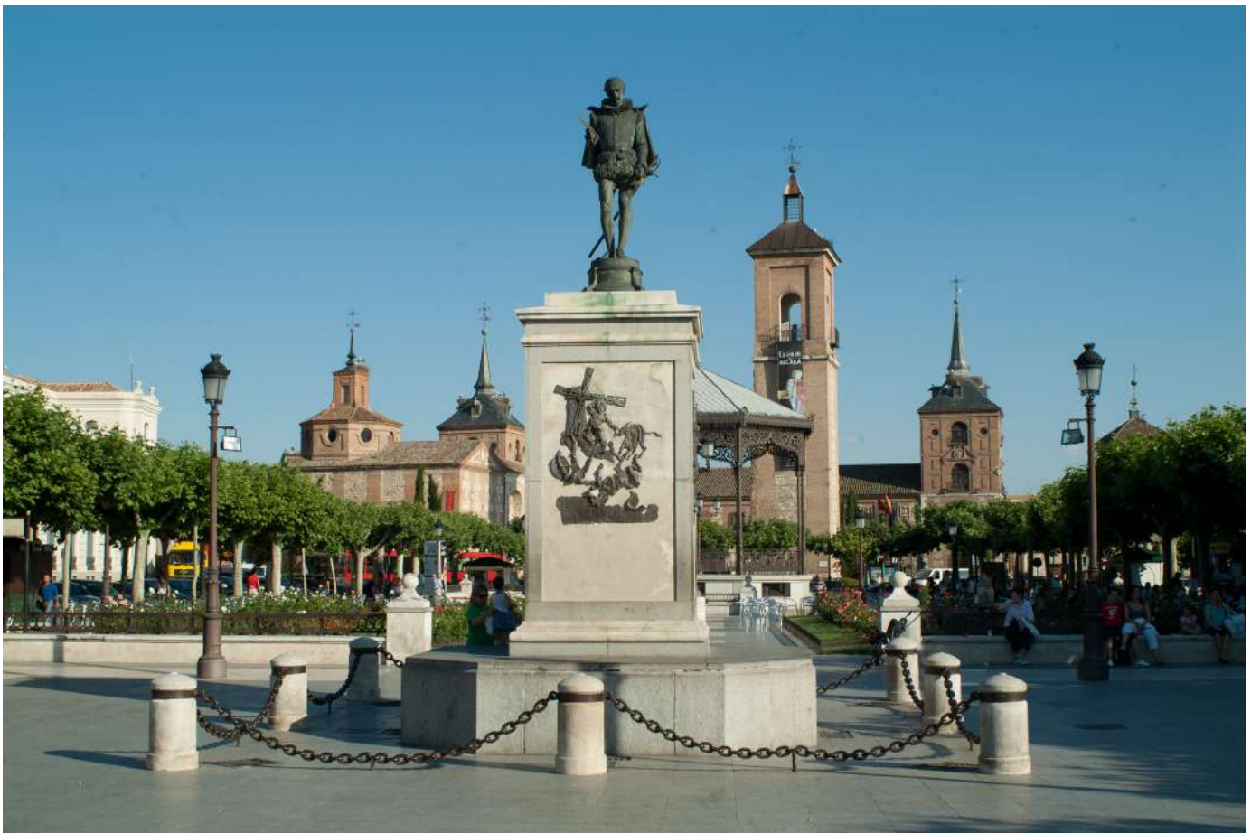
Plaza Cervantes de Alcalá de Henares. Nodo de donde se desprenden calles, callejones y callejuelas.

U n adarve es un paseo de ronda en lo alto de una muralla, pero también es una callejuela en el interior de una población, a veces los adarves tienen una doble funcionalidad como es el caso del adarve de Priego de Córdoba ya que por sus características lo hace ser único en su género, ya que además de ser un paseo en la parte superior de su muralla, es una calle, y como tal vía con viviendas y vida, y como tal Adarve se conservó durante siglos con sus pretilos, almenas y torres de vigilancia, hasta que en 1915 se sustituyeron los vetustos elementos medievales por una larga barandilla de hierro, convirtiéndose el Adarve según el argot popular en “La Baranda” 77.