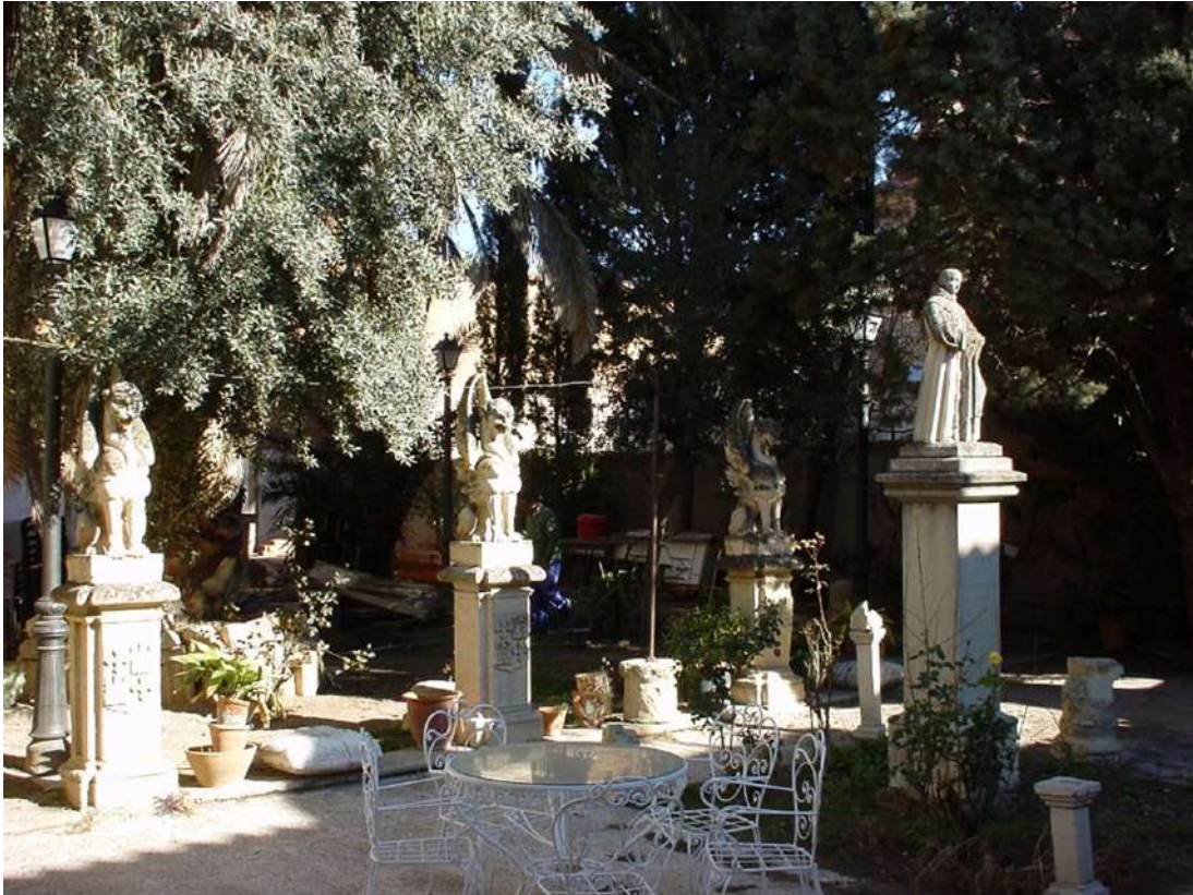
Ilustración 18. Patio conocido como de Mataperros, del mismo arrancarí el comienzo del callejón de la Virginidad o tal vez este corral fuese un ensanche de dicho callejón. F. Rafael Fernández enero 2005.

Pedían licencia para la puerta carretera que tienen en la calle de Mataperros y tapias que se han caído, la levanten y saquen dicha puerta a nivel con las tapias de la calle como es pedido y estorbar a la salida de las aguas 857.