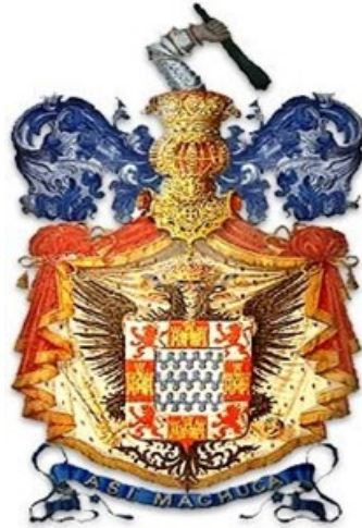
Escudo Heráldico de los Vargas Machuca, con brazo armado con rama o tronco de encina.