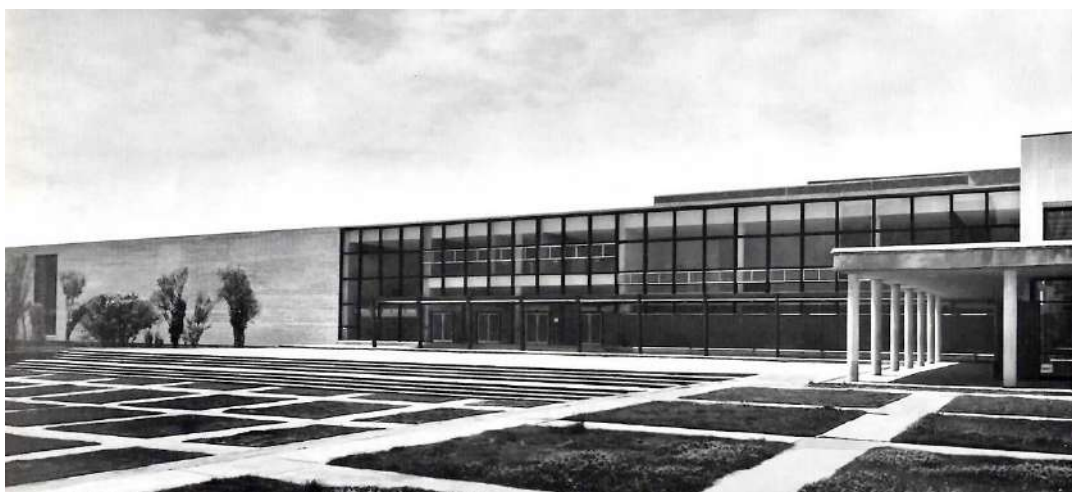
Facultad de arquitectura