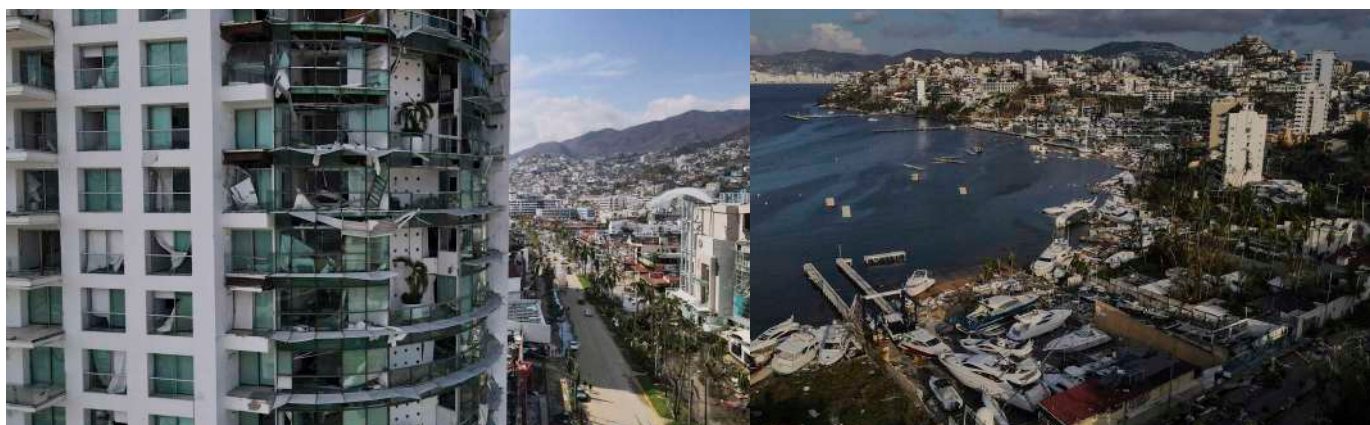
Imágenes del impacto del Huracán Otis https://images.app.goo.gl/sZUcdnLZ6fwHgLQD7

No es culpa del gobierno que llegue un huracán, pero sí es su responsabilidad contar con un plan de prevención, monitoreo y atención. Esa irresponsabilidad está costando muchas vidas que no debieron truncarse.