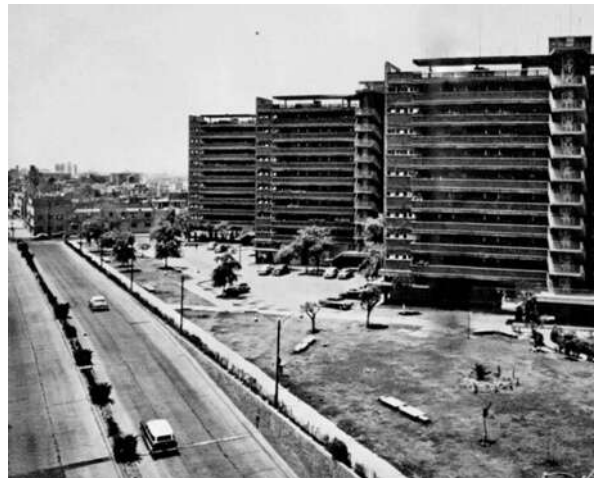
Centro Urbano Presidente Juárez