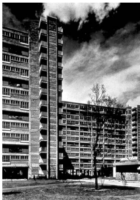
Centro Urbano Presidente Alemán https://images.app.goo.gl/

"En el urbanismo, hay creación, luego hay arte, sin que esto signifique que este confundiendo el urbanismo con el arte urbano, que sería como confundir a la arquitectura con la escenografía o la simple construcción".