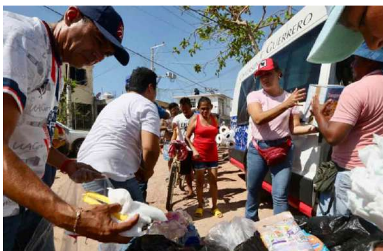
Imagen de solidaridad en Huracán Otis https://images.app.goo.gl/C5UH5oqQaJP8CkuH6

Huracanes como el Paulina en 1997, Manuel e Ingrid en 2013, pusieron a prueba la capacidad de la sociedad. Las ciudades de México y Acapulco, con su esfuerzo ante gobiernos empequeñecidos, se recuperaron.