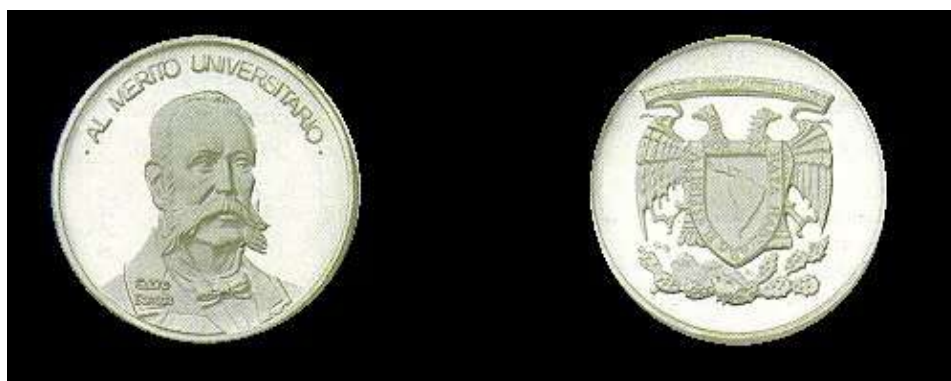
Medalla "Gabino Barreda" https://images.app.goo.gl/Z8QnY7RyefUwe4GK8

Es doctora en Economía por la UNAM, por su tesis "Las obras públicas de la ciudad de México. Política urbana e industria de la construcción" recibió Mención Honorífica y por ser el mejor promedio de su generación fue distinguida con la Medalla Gabino Barreda.