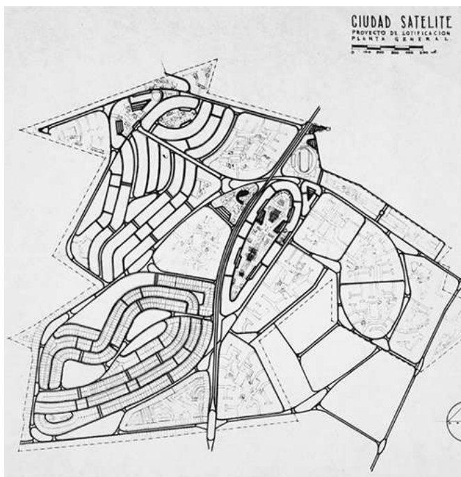
Plan Maestro Ciudad Satélite. https://images.app.goo.gl/wREy6ok3xru8Hdxo8