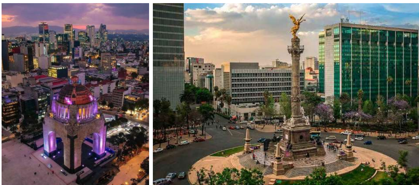
Plaza de la República o Monumento a la Revolución (izq) y Glorieta el Ángel de la Independencia en la Ciudad de México.

La Asociación Mexicana de Urbanistas se ha propuesto colocar al Desarrollo Urbano, al Ordenamiento Territorial y sobre todo al Urbanismos en la Agenda Pública Nacional, este es un esfuerzo más para difundir y valorizar el quehacer urbanístico, esta 1º Biental recibirá proyectos dentro de las siguientes cinco categorías: Investigación y crítica, Instrumentación urbana, Proyectos Urbanos y Territoriales, Medio ambiente y cambio climático y Divulgación y participación. Contará con un jurado integrado por profesionales de prestigio con experiencia en cada una de las temáticas. La imagen de esta 1º Biental estuvo a cargo del estudio mexicano de diseño, estudio Bonito.