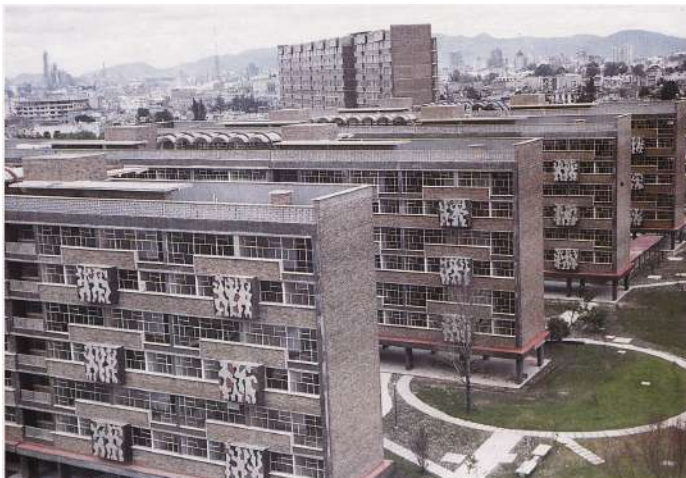
Unidad Habitacional Santa Fe